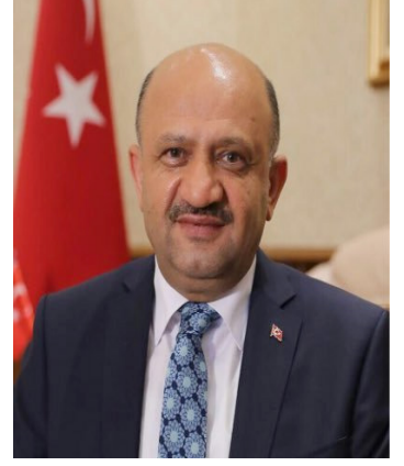
Fikri IŞIK Başbakan Yardımcısı

Atatürk Kültür Merkezi Başkanlığı, Atatürk Kültür, Dil ve Tarih Yüksek Kurumu bünyesinde, kamu tüzel kişiliğine sahip özel bütçeli bir kurumdur.