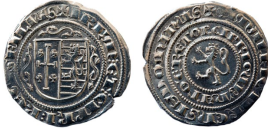
Fotoğraf 11- Kıbrıs Kralı Amaury'nin diğer grosunun ön ve arka yüzü.