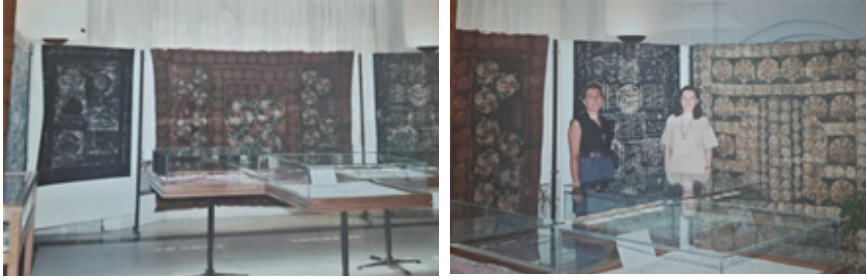
Resim 3.3. “Yazmacılıkta Renkler, Semboller, Düşler” İstanbul Büyükşehir Belediyesi Şehir Müzesi, 1995.