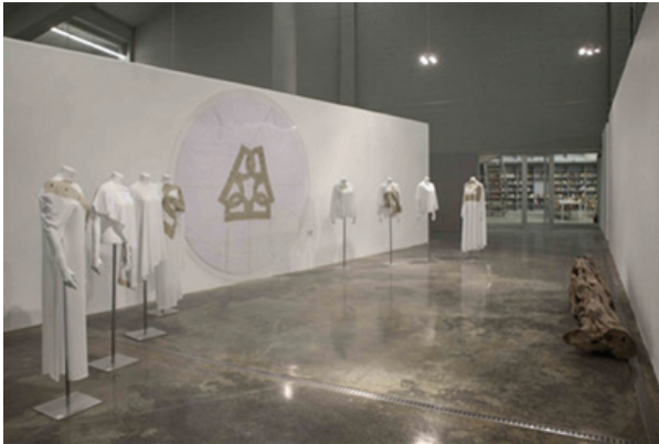
Resim 3.5. “Mesafe ve Temas” Baksı Müzesi, 2014. Üç Boyutlu Tekstil Sergisi