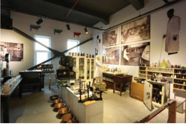
Resim 2.1. Merinos Tekstil Sanayi Müzesi, 2011, Bursa.

20. yüzyılın ikinci yarısından itibaren tekstil, zengin el sanatları geleneği ile çağdaş sanat yaklaşımları ve teknolojinin de olanaklarından etkilenen bir plastik sanat dalı olarak kabul görmeye başlar (Dereci, 2014:55).