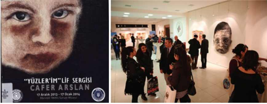
Resim 3.7. “Yüzlerim” Merinos Tekstil Sanayi Müzesi, 2014. (Üç Boyutlu Tekstil Sergisi)

Sergide sisal yaprak liflerini kullanarak kendi geliştirdiği teknikle çalışmalar yapan sanatçının, çağdaş bakış açısıyla yapmış olduğu çalışmalar tekstil sanatıyla müze ziyaretçisinin sergi salonunda buluşarak tanışmasını sağlamıştır.