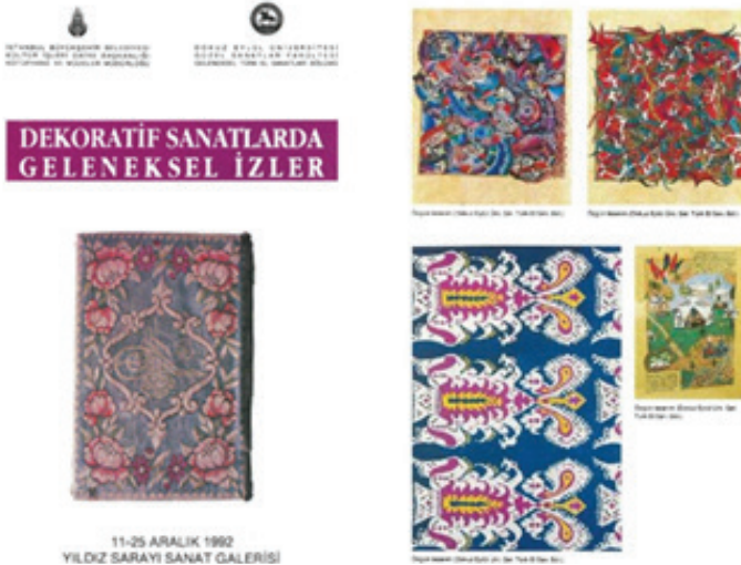
Resim 3.1. ‘Dekoratif Sanatlarda Geleneksel İzler’ Yıldız Sarayı Sanat Galerisi, İstanbul İki Boyutlu Tekstil Sergisi, 1992.

Çalışmanın konu başlığı doğrultusunda bu çeşit sergilere verilen ilk örnek “Dekoratif Sanatlarda Geleneksel İzler” isimli Yıldız Sarayı sanat galerisinde 1992 yılında açılmış sergidir. İstanbul Büyükşehir Belediyesi Şehir Müzesi koleksiyonunda bulunan çoğunlukla 20.yüzyılın ikinci yarısına tarihlendirilen tekstillerden seçilen eserlerle, İzmir Dokuz Eylül Üniversitesi Güzel Sanatlar Fakültesi, Geleneksel Türk El Sanatları Bölümü öğrencilerinin sözü geçen dönem tekstillerinin motif ve kompozisyon özelliklerinden esinlenerek yaptıkları tasarımların yer aldığı iki boyutlu tekstil sergisidir.