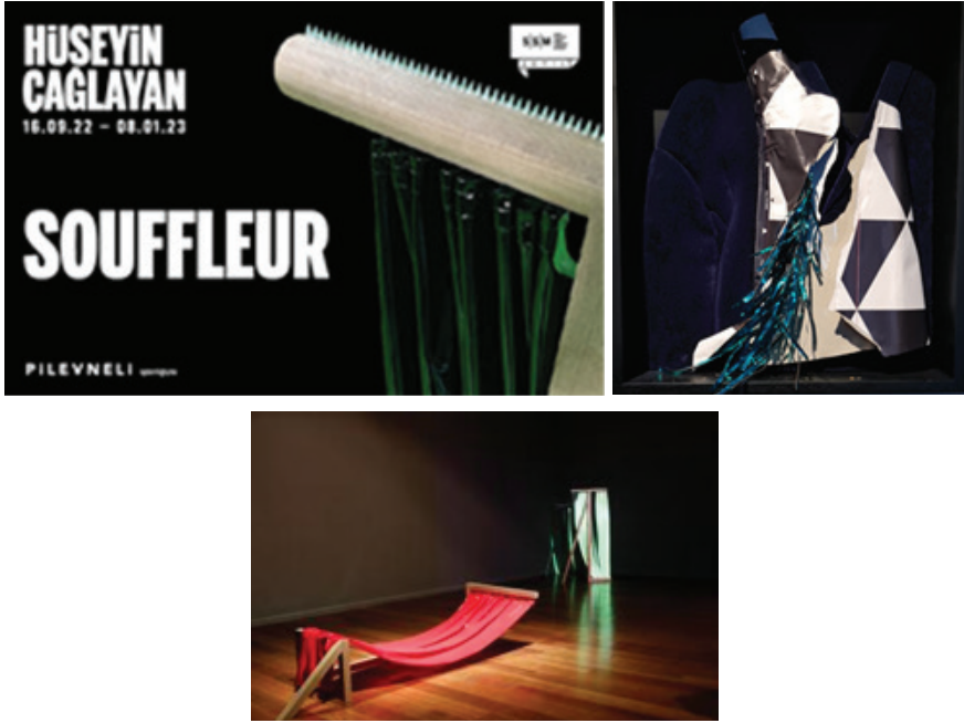
Resim 3.3. “Süflör” Sabancı Müzesi, 2022. Sömürgecilik Sonrası Beden Hüseyin Çağlayan 2022, (Üç Boyutlu Tekstil Sergisi)