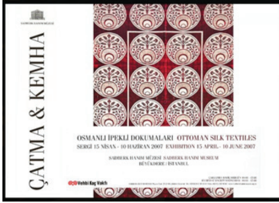
Resim 3.4. ‘Çatma & Kemha’ Sadberk Hanım Müzesi, 2007. İki Boyutlu Tekstil Sergisi.