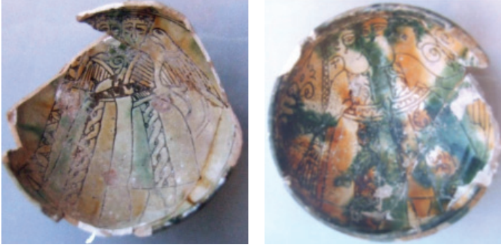
Foto. 10-11: Çift tasvirlerinin görüldüğü Kıbrıs üretimi (14-15. yüzyıl) seramikler (Doğar, 2011: 54-55)

çanaklardaki dans eden ya da birlikte tasvir edilmiş kadın ve erkek figürleri vardır. Batılı tarzda saçları ve giysileri olan çiftler birbirlerine neredeyse yapışık olarak eğlenirken ya da içki içerken düğün eğlencesi içinde gösterilmişlerdir (Foto.10-11).