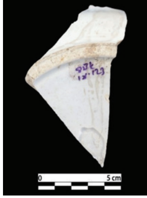
Foto. 23: Balatlar örneğinde görülen soğuk damga, 2018 yılı buluntusu.

Serigrafî (transfer) tekniği ile porselene aktarılmış Kral Oscar ve eşi Josephine'nin kol kola görüldüğü resim "Illustrated London News" in 27 Nisan 1844 tarihli sayısında yayımlanmıştır (Foto. 25). Gazetede basılan kral ve eşinin portreleri Fransız ve İngiliz yayın organlarında yayınlanmış ve bu yayınlarda Oscar'ın tahta çıkışı belirtilmiştir. Yayınlanan bu resmi Kral Oscar'ın, İsveçli bir sanatçıya 1844 yılında tahta çıkışından dolayı yaptırmış olduğu bilinmektedir (Polat, 2018: 119, 142) 11 .