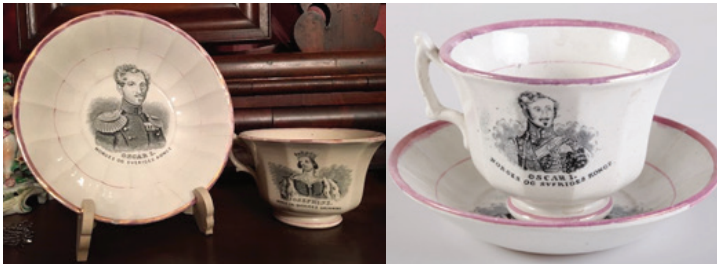
Foto. 28-29: Kral Oscar ve eşi Josephine'nin tasvirlerinin ayrı ayrı basıldığı fincan takımları.

( https://www.worthpoint.com/worthopedia/josephine-leuchtenberg-king-oscar-1618965371 ; https://www.etsy.com/listing/1319736717/antique-staffordshire-royalty-plate )