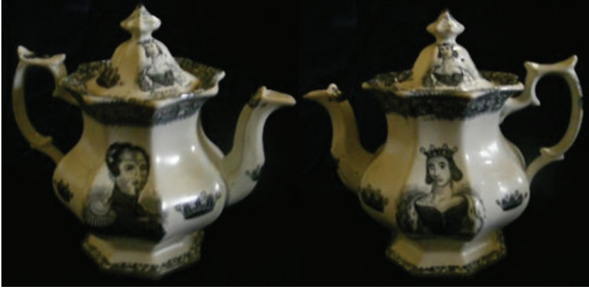
Foto. 30: Kral Oscar I ve eşi Josephine'nin tekli tasvir edildiği demlikler. ( https://www.worthpoint.com/worthopedia/king-oscar-josephine-sweden-norway-308916465 )

Oscar ve Josephine tasvirli porselenler sadece servis tabaklarında kullanılmamıştır. Çay servisinde kullanılmış fincan, fincan tabağı ve demlikler üzerinde de kraliyet çiftinin tasvirleri bulunmaktadır. Çay demliği ve sütlük üzerinde, tabaklardan farklı olarak Kral Oscar ve Kraliçe Josephine'in tek figürleri vardır. Çiftin birlikte değil de ayrı ayrı tasvir edilmelelerinin nedeni yer darlığının yanı sıra her iki porselen servis çaydanlığının aynı takıma ait olmasıyla da açıklanabilir (Foto. 28, 29, 30). Kral I. Oscar'ın tek başına tasvir edildiği porselen tabak da tespit edilen örnekler arasındadır (Foto. 31).