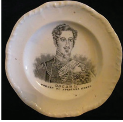
Foto. 31: Kral Oscar I'in tek başına tasvir edildiği porselen tabak. ( https://www.worthpoint.com/worthopedia/king-oscar-sweden-norway-1844-278998281 )

Kral ve kraliçenin tasvirlerinin yer aldığı porselenlerdeki form çeşitliliği, porselenlerin anı tabağı veya takım olarak üretildiğini göstermektedir. Ayrıca başka kral ve kraliçelerin resimleri de porselen tabaklar üzerinde betimlenmiştir. Fotoğraf sanatının gelişmesiyle birlikte fotoğrafların da porselene aktarıldığı görülmektedir (Foto. 32 ).