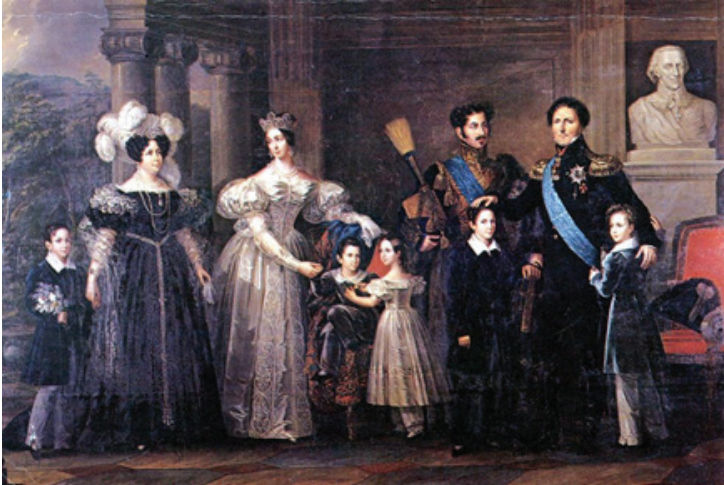
Foto. 33: Fredric Westin tarafından yapılan “Kraliyet Ailesi” resmi ( https://en.wikipedia.org/wiki/Josephine_of_Leuchtenberg ).

Kral Oscar'ın yaşamı boyunca çeşitli sanatçılara kendisini ve eşi Josephine'in tek ya da çift portreleriyle 1837 yılında yapılan “Kraliyet Ailesi (Bernadotte Ailesi)” resmi gibi birçok resim yaptırdığı dikkati çekmektedir (Foto. 34). Kralın tüm bu resimleri yaptırması onun hem sanata, hem de tasvir yoluyla anlaştırmaya ve kalıcı olamaya olan ilgisini yansıtmaktadır.