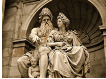
Foto.3: Zeus ve Hera heykeli. ( https://walkswithin.com/2020/01/ the-sacred-marriage/ )

Bu bildiride tarihsel süreçte bu anlamda yapılmış olan sanat eserlerine genel olarak değinildikten sonra yukarıda da bahsi geçen Sinop kent merkezindeki Balatlar Kilisesi kazısında bulunmuş bir porselen tabak parçasına odaklanılacaktır (Foto.3). Bu bağlamda İsveç Kralı I. Oscar'ın (Joseph François Oscar Bernadotte) yaşamına ve evlilik sürecine göz atılacak, eşi ile birlikte serigrafi/ transfer tekniğinde yapılmış portrelerinin yer aldığı porselen takımlar üzerinde durulacak ve tespit edilen benzer örnekler ile karşılaştırmalar yapılacaktır.