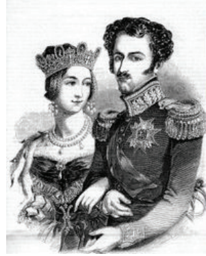
Foto. 25: Kral ve eşinin gazetede yayınlanan litograf baskı resmi (Polat, 2018: 285) ( https://124.im/gvZDH )