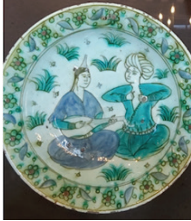
Foto.16: Osmanlı dönemi tabağında bahçede eğlenen çift tasviri ( https://tarihdergi.com/mu%CC%88this-bir-c%CC%A7ini-koleksiyonu/ )