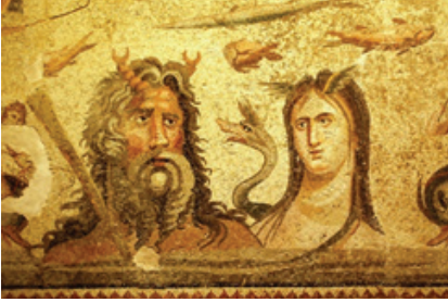
Foto. 2: Zeugma Okeanos ve Tethys mozaiği. ( https://tr.wikipedia.org/wiki/ Dosya:Okeanos_ve_Tethys.jpg )