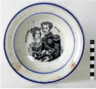
Foto. 24: Marmaray kazı buluntusu olan Kral I. Oscar ve Kraliçe Josephine'in tasvir edildiği tabak.