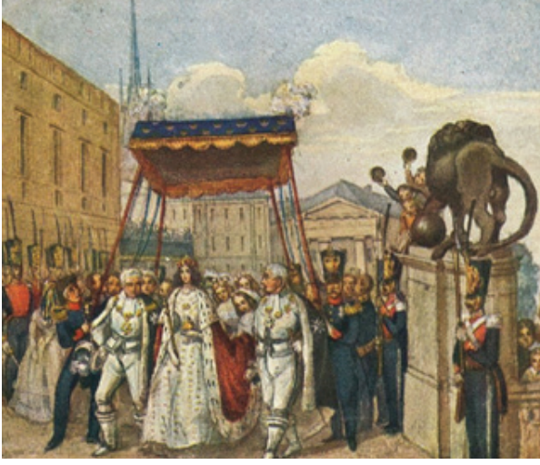
Foto. 22: Josephine'in taç giyme töreni ( https://en.wikipedia.org/wiki/Josephine_of_Leuchtenberg )

Çiftin evliliğini betimleyen porselen anı tabaklarının Osmanlı coğrafyasına ulaştığını gösteren kazı buluntularından biri Marmaray kazılarında gün ışığına çıkarılmış olup Turgay Polat'ın doktora tezi kapsamında değerlendirilmiştir (Polat, 2018: 284-285). Bu örnek, Balatlar kazısında bulunan porselen tabak parçasının tam hali hakkında fikir vermesi ve araştırmalarımız esnasında tespit edebildiğimiz tek kazı buluntusu olması bakımından önemlidir (Foto. 24). Marmaray kazılarında bulunan tabağın arka kısmında damga olmadığı ifade edilmiştir (Polat, 2018: 284-285). Balatlar örneğinde ise üretici fabrikaya ait soğuk damga bulunmaktadır. Bu damga tam olarak okunamamış olsa da damgada çapa motifi algılanmakla beraber bu işaret İngiliz porselen markalarında sıkça görülmektedir (Foto.:23). Balatlar'da Geç Osmanlı dönemi Rum Ortodoks mezarlık alanında gömü hediyesi olarak bırakılmış serigrafî (transfer) tekniği ile üretilmiş çok sayıda İngiltere'den ithal edilmiş porselen ve yarı porselen fincan, kase ve tabaktaki (Gök İpekçioğlu, 2018: 337-340) soğuk damgada çapa motifinin görülmesi bu eserin de İngiltere'de üretilmiş olabileceğini düşündürmektedir.