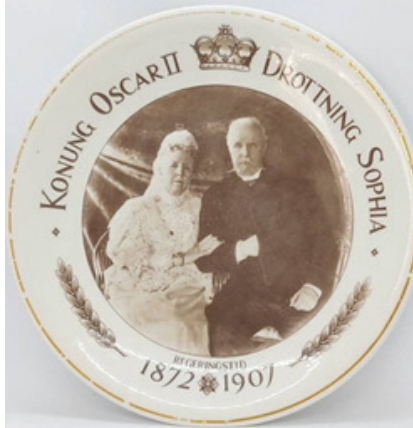
Foto. 32: Kral I. Oscar'ın oğlu Kral II. Oscar ve eşinin fotoğrafının basıldığı porselen tabak. ( https://www.etsy.com/ca/listing/1324419209/konung-oscar-ii-and-drottning-sophia )

Kral ve kraliçenin tasvirlerinin yer aldığı porselenlerdeki form çeşitliliği, porselenlerin anı tabağı veya takım olarak üretildiğini göstermektedir. Ayrıca başka kral ve kraliçelerin resimleri de porselen tabaklar üzerinde betimlenmiştir. Fotoğraf sanatının gelişmesiyle birlikte fotoğrafların da porselene aktarıldığı görülmektedir (Foto. 32 ).