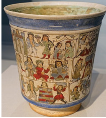
Foto.15: Washington D.C. Freer Galery'de bulunan kadeh.

Yine konusunu Şehname'den alan bir aşk hikâyesinin ana karakterleri Bijan ve Manijeh'in birlikte de tasvir edildiği 12. yüzyıla ait bir eser de bugün Washington D.C. Freer Galeri'dedir 6 (Foto.15). Osmanlı dönemine ait seramik eserlerde de çift tasvirleri çeşitli şekillerde görülebilmektedir 7 (Foto.16).