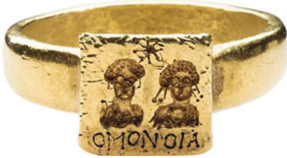
Foto.1: Bizans dönemine (6-7. yüzyıl) ait evlilik yüzüğü ( https://www.metmuseum.org/art/collection/search/661703 )

Kadın ve erkeğin gelenekler uyarınca birlikteliklerini toplum önünde hukuki ve dini bir yetkili huzurunda resmileştirmesine evlilik denilmektedir. Hem toplum, hem de dinler evliliği her zaman yüceltmıştır. Tarih boyunca çiftler birlikteliklerini belgeleme, duyurma, anılaşırma ve ölüm-süzleştirme kaygısıyla görsel ve yazılı ifade biçimleri kullanarak heykel, kabartma, seramik ve en çok da takılar üzerine kendilerini tasvir ettirerek kalıcı hale getirmişlerdir. Bunun sonucunda sanat eseri olarak nitelendirilen objeler/eşyalar ortaya çıkmıştır. Bu objeler/eşyalar arasında Roma döneminden itibaren en yaygın olanı evlilik yüzükleri yani alyanslardır 3 (Foto. 1-2).