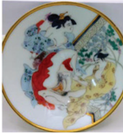
Foto. 20: Japon Kutani Shunga porselen sake bardağı (Cengiz, 2019: 16)

Benzerlerinden farklı olarak Kutani Shungab porselen sake ardağı evlilik ve cinsellikle ilişkilendirilebilecek kaplar açısından değişik bir örnektir. Japon kültürüne ait bu örnekte cinsellik teması ayrıntılı olarak işlenmiş olup bu bardakların çiftlere düğün hediyesi olarak verildiği bilinmektedir (Cengiz, 2019: 16-17). Bu da objenin üretim amacı bakımından Antik Roma'da yapılan zıfak kandillerini akla getirmektedir (Foto. 20).