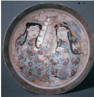
Foto.12: Washington D. C. Freer Gallery of Art'da bulunan Büyük Selçuklu dönemi minai teknikli seramik kap (Öney, 2008: 68).

Sadece Hristiyan kültürün egemen olduğu topraklarda değil İslam dünyasında da minyatürler, alçı kabartma, diğer sanat eserleri ve bilhassa da seramikler üzerinde figüratif tasvirler yer verilmiştir. Büyük Selçuklu ve Anadolu Selçukluları dönemlerinden günümüze ulaşan sanat eserleri üzerinde genellikle iki sevgili karşı karşıya oturur ve birbirine bakar vaziyette betimlenmişlerdir (Öney, 1983: 34, 111, 112; Öney, 2004: 76; Öney, 2008: 68-69) (Foto.12).