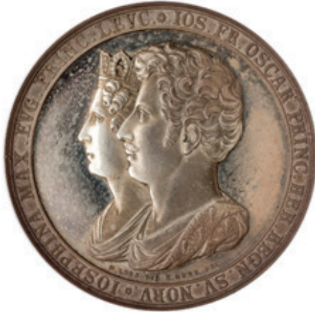
Foto. 21: Kral I. Oscar'ın eşi ile tasvir edildiği madalyon

Bu çalışma kapsamında çift betimlerinin porselene yansımaları açısından Balatlar Kilisesi kazı çalışmalarında, 19.yüzyıla tarihlenen Rum Ortodoks mezarlığında sürdürülen çalışmalar sırasında gün ışığına çıkarılmış bir tabağa ait figürlü parça oldukça dikkat çekicidir. Araştırma konusunun öznesi olan İsveç Kralı Oscar'dır. Kral Oscar'ın eşi Josephine ile birlikte tasvir edildiği madalyonlar ve porselen tabaklar oldukça yaygındır. Oscar, Kral XIV. Karl ile Desiree Clary'nin tek çocuğudur. Oscar'ın Josephine ile evliliği, kral olduğu tarihten 11 yıl öncesine rastlamaktadır. Oscar, 22 Mayıs 1823 tarihinde Josephine ile Münih'teki Leuchtenberg Sarayı'nda vekil vasıtasıyla nikâhlanmış, aynı yıl 19 Haziran'da Stockholm'de yapılan bir düğünle evlenmiştir 8 . Oscar ve Josephine'in düğünleri anısına ve iyi alametler altında girilen bu evliliğe mutluluk dileme amacıyla 19 Haziran 1823 tarihli bir gümüş madalya da bastırılmıştır 9 (Foto. 21). Babasının ölümünden sonra Bernadotte Hanedanı'nın ikinci hükümdarı olarak 8 Mart 1844 tarihinde İsveç-Norveç Kraliyet tahtına oturmuştur. Josephine de kraliçelik tacını 28 Eylül 1844'te İsveç'te giymiştir 10 (Foto. 22). Oscar 8 Mart 1844'den, 8 Temmuz 1859'daki ölümüne kadar kral olarak hüküm sürmüştür.