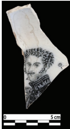
Foto.3: Kral I. Oscar'ın tasvirinin yer aldığı Balatlar porselen tabak parçası, 2018 yılı buluntusu.

Bu bildiride tarihsel süreçte bu anlamda yapılmış olan sanat eserlerine genel olarak değinildikten sonra yukarıda da bahsi geçen Sinop kent merkezindeki Balatlar Kilisesi kazısında bulunmuş bir porselen tabak parçasına odaklanılacaktır (Foto.3). Bu bağlamda İsveç Kralı I. Oscar'ın (Joseph François Oscar Bernadotte) yaşamına ve evlilik sürecine göz atılacak, eşi ile birlikte serigrafi/ transfer tekniğinde yapılmış portrelerinin yer aldığı porselen takımlar üzerinde durulacak ve tespit edilen benzer örnekler ile karşılaştırmalar yapılacaktır.