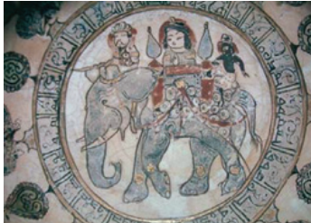
Foto. 14: Sapinud'un Gelin Alayı sahnesinin görüldüğü seramik eser (Öney, 2008: 70)

Bu eserler üretildikleri dönemi ve içinde bulunulan inanç sistemini de açık bir şekilde yansıtmaktadır. Bazen kimlikleri belirsiz kişiler tasvir edilirken bazen de tarihte yaşamış, dini ve edebi metinlerde bahsi geçen kişilerin de tasvir edildikleri görülmektedir. Firdevsi Şehnamesi'nde geçen metinden esinlenerek işlenen Sapinud'un Gelin Alayı sahnesi, Selçuklu dönemine ait Washington D. C. Freer Gallery of Art'da yer alan bir seramik eserde görülmektedir (Öney, 2008: 70) (Foto.14). Bu eserin bir benzeri de Kayseri Selçuklu Uygarlıkları Müzesi'ndedir 5 .