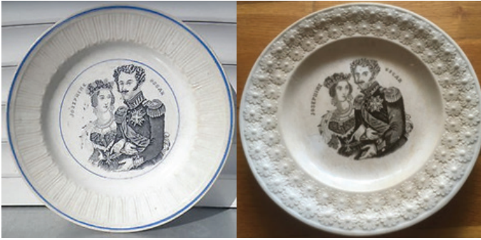
Foto. 26-27: Kral I.Oscar ve eşi Josephine'in tasvirlerinin yer aldığı porselen tabaklar

Konuyla ilgili gerçekleştirilen araştırmalarda, Oscar ve Josephine'nin tasvir edildiği çeşitli porselen tabaklar tespit edilmiştir. Bu eserler kazı buluntusu olmayıp müzayedelerde satışı yapılan eserlerdir (Foto. 26-27).