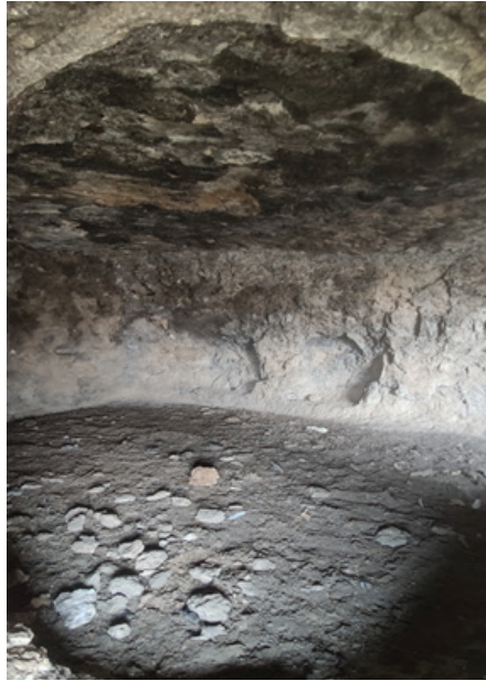
Fotoğraf 7: II. Hebis Manastırı, zemin kattaki hücrenin iç mekânı