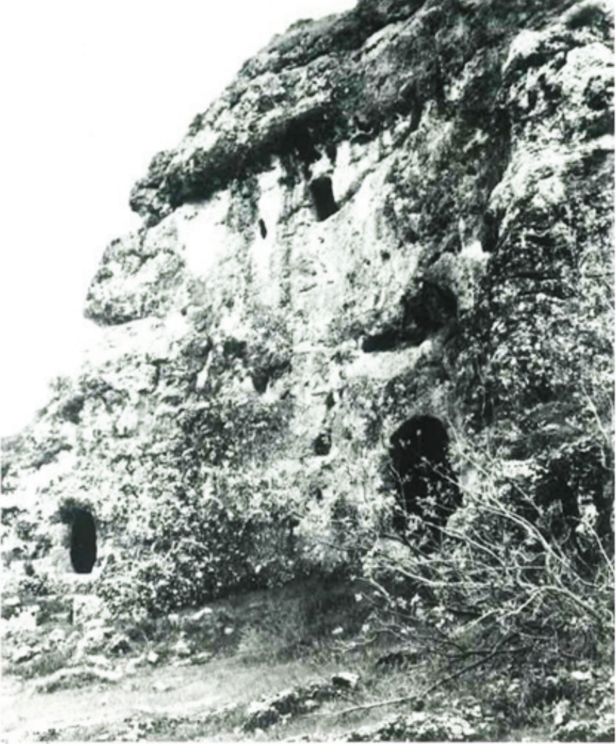
Fotoğraf 2: II. Hebis Manastırı, genel görünüm (G. Wissner, 1993)

Eyvanın kuzeydoğu köşesinde bulunan kapı açıklığı ile tek kişilik küçük bir hücreye geçilmektedir. Zemin katın ön kısmında yer alan avluya açılan yaklaşık 5,00 m derinliğindeki sarnıç da doğal kayanın oyulmasıyla oluşturulmuştur.