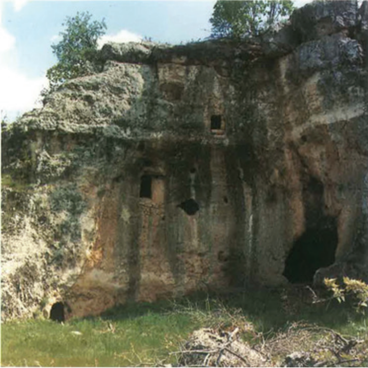
Fotoğraf 14: I. Hebis Manastırı (Ralte) genel görünüm. (G. Wiessner, 1993)

Turabdin bölgesinde kapsamlı araştırma yapan Gernot Wiessner çalışmaları sonucunda bu bölgede benzer tipolojik unsurlara sahip toplam üç Hebis Manastırı olduğunu ancak bunlardan sadece ikisine gidebildiğini ifade etmektedir. (G. Wiessner 1993:90). Kendisinin tespit etmiş olduğu I. Hebis Manastırı, çalışmamızda ele aldığımız II. Hebis Manastırı ile yakın konumlarda ve birbiriyle birçok benzer özellik göstermektedir. Söz konusu I. Hebis Manastırı, Beth Manem Köyü kırsalında ve İdil'e bağlı Mağara (Kivex) Köyü'nün güneyinde ve "Ralte" olarak adlandırılan bir muhitte yer almaktadır.