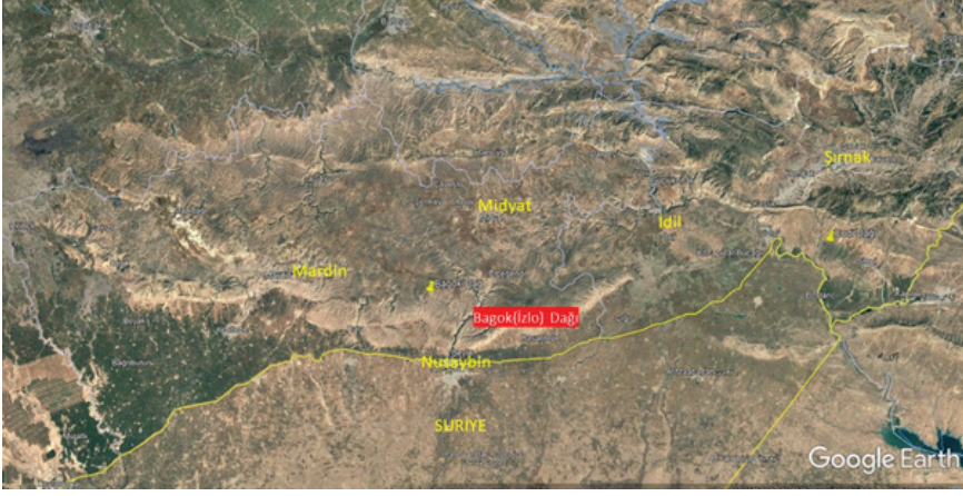
Harita 1: Bagok (İzlo) Dağı ve Çevresi