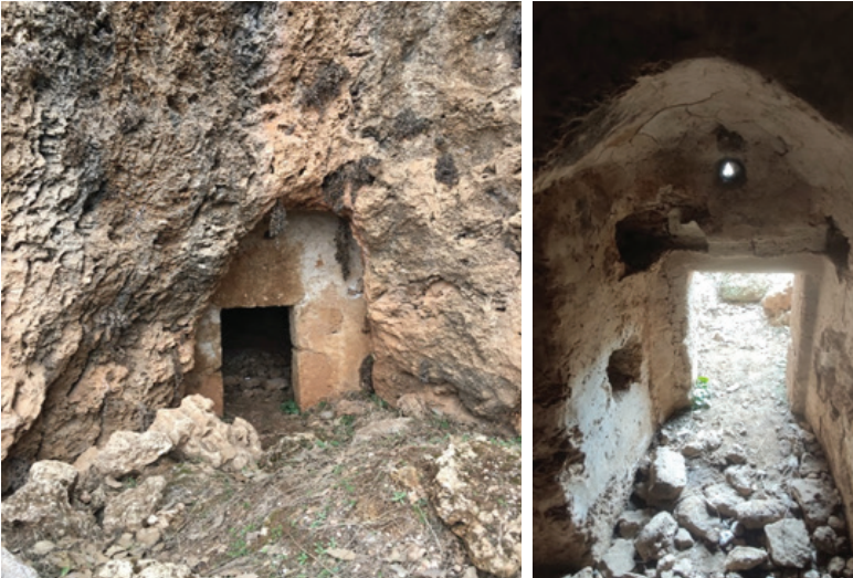
Fotoğraf 9-10: II. Hebis Manastırı, üst kata giriş kapısı, dıştan ve içten görünüm