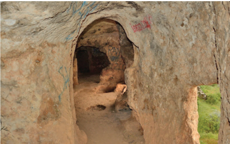
Fotoğraf 19: Mor Barsavmo Manastırı, üst kat iç mekan (Gercüş/Batman)

Benzer kaya manastırlarından bir örneği de; Batman İli, Gercüş İlçesi sınırları içerisinde kalan Arıca (Kafro) Köyü'nün kuzeyindeki kayalık alanın batı yamacında yer alan Mor Barsavmo Manastır'dır. Bu manastır da iki katlı olarak kaya oyma tekniği ile oluşturulmuştur. Manastıra giriş, zemin katın kuzeybatısına bulunan kapı açıklığından sağlanmaktadır. Girişin açıldığı mekanın doğusunda bulunan niş içinde bir sunak masası (Kduşku-dşin) bulunmaktadır. Manastır zemin katı kuzey-güney doğrultusunda ard arda sıralanan çeşitli mekanlardan oluşmaktadır. Manastırın zemin katında çeşitli ek mekânlar ile Beth Slutho (Yazlık Apsis- Dua Evi) olarak adlandırılan bir bölüm bulunmaktadır.