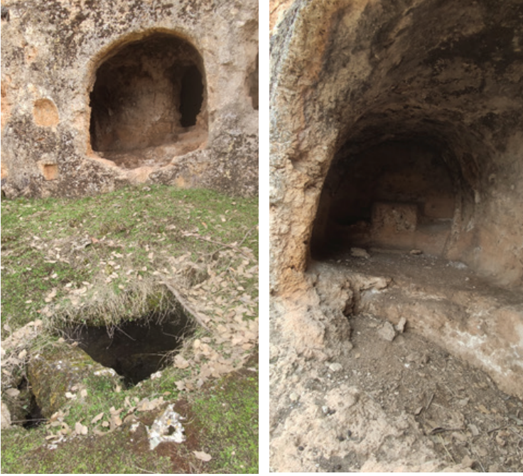
Fotoğraf 5-6: II. Hebis Manastırı, zemin katın önündeki sarnıç ve şapel