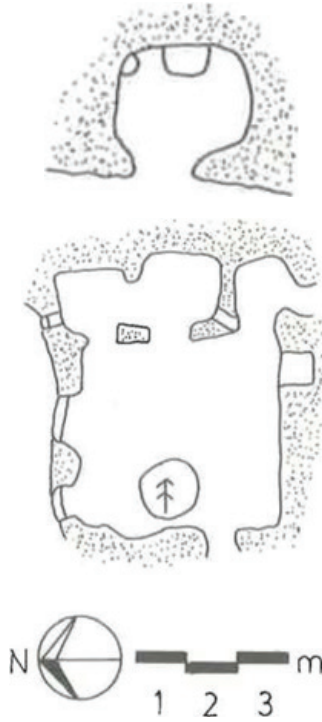
Plan 3: I. Hebis Manastırı, vaziyet planı. (G. Wiessner 1993)

Yapının görüntü, vaziyet planı ve Wiessner'in tanımlamalarına göre her iki Hebis manastırının doğal kayanın oyulması ile oluşturulmuş olmaları, iki katlı olmaları, mekânsal düzenlemeleri ve şapel ile kduşduşkin unsurları arasındaki ortak üslup özellikleri gibi unsurlardan bu yapıların birçok açıdan benzerlik gösterdikleri anlaşılmaktadır. Hatta güvenlik açısından tercih edildiği düşünülen dar geçitler ve rahatça kapatılabilecek dairesel, dar çaplı giriş açıklıkları da belki ortak kaygılar sonucu benzer şekilde yapılmıştır. Bu yapıların önemli diğer bir özelliği eremitik 10 anlayışla yerleşim yerlerinden ve toplumdan uzak dağlık yerlerde, münzevi bir hayat sürdürmek isteyen keşişler tarafından kullanılmış olmalarıdır.