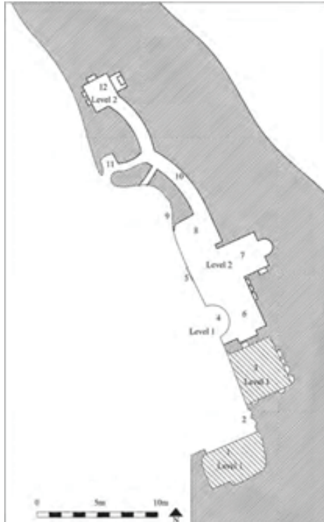
Plan 4: Mor Barsavmo Manastırı (E. Keser-Kayaalp)

Turabdin ve komşu sanat çevresinde benzer tipolojiye sahip bir çok kaya oyma manastırına rastlamak mümkündür. Mardin İli, Midyat İlçesi Barıştepe (Salah-Salhe) Köyü'nde yer alan Mor Barsavmo Manastırı, 9,00-10,00 m yüksekliğe sahip bir tepenin batı yamacına kurulmuştur. Kayaların oyulması ile şekillendirilmiş olan manastır, kuzey-güney doğrultusunda uzanmakta olup küçük ölçekli yapılardan oluşmaktadır. Manastırın ana merkezinde yer alan kilise, 3.65x7.40 m ölçülerinde dikdörtgen planlı olup diğer kaya kiliselerine göre oldukça düzgün bir plan özelliği göstermektedir. Kilisenin doğusunda yer alan apsis, yarım daire şeklinde derin bir nişten oluşmakta ve nişin üst kısmı yarım kubbe şeklinde sonlanmaktadır. Kilisenin kuzey cephe duvarında bulunan ve zemine yakın şekilde yatay olarak yazılmış bir kitabe mevcuttur. 12