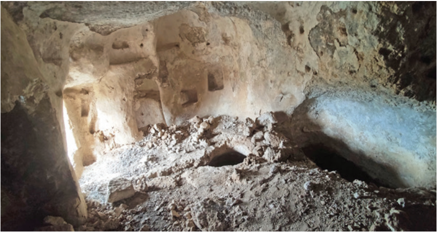
Fotoğraf 13: II. Hebis Manastırı, üst kat, yaşam odası genel görünüm