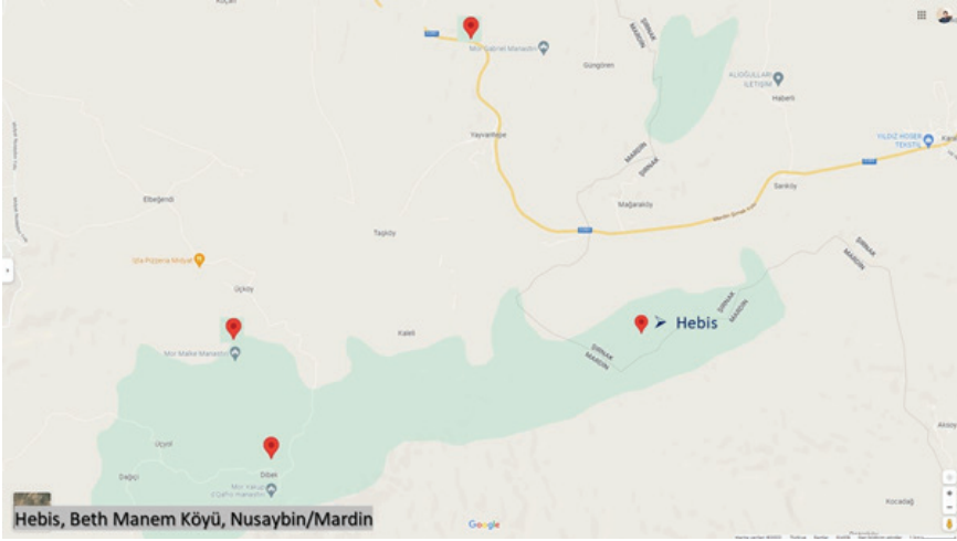
Harita 2: II. Hebis Manastırı konumu ve çevresi

Yapı, Beth Man'em Köyü'nden Bagok Dağı'na doğru patika yoluyla yaklaşık 4 km uzaklıkta olup, Bagok Dağı'nın kuzey yamacında ve ovaya hakim bir tepe üzerinde yer almaktadır. Günümüzde terk edilmiş olan bu manastır, kayaya oyulmuş olarak her katta birer şapel ve hücrelerden oluşan iki katlı bir plan şeması göstermektedir. Yapıda herhangi bir inşa kitabesi bulunmamakta olup, yapının tarihlendirilmesi konusunda herhangi bir kaynağa ulaşamamıştır. 6