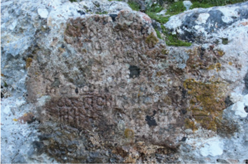
Fotoğraf 2. 1 No'lu Burç'un güney cephesinde harç üzerine kazıma tekniği uygulanan yazıt

Fethiye Kalesi'nde yapılan araştırmalar sırasında 1 ve 5 nolu burçlar ile 5 nolu sarnıçta Grekçe dört kitabe tespit edilmiştir. 1 No'lu Burç'un güney cephesinde yer alan 40 x 21 cm ölçülerindeki kitabe, harç üstüne kazıma tekniğiyle yazılmıştır (Fotoğraf 2).