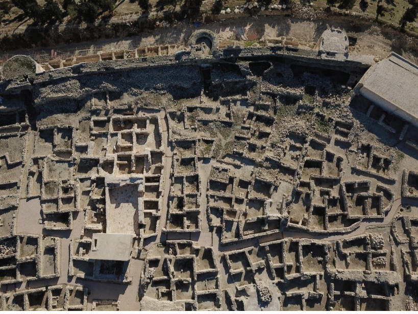
Fotoğraf 18: Arkeolojik kazı sonrası (A21 1. Yol güneyi B koridoru hava fotoğrafı).