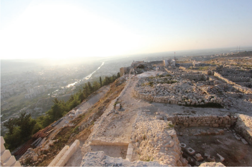
Fotoğraf 9: Arkeolojik kazı ve temizlik öncesi A 5 Mekânı içerisinde yer alan mekanlar.