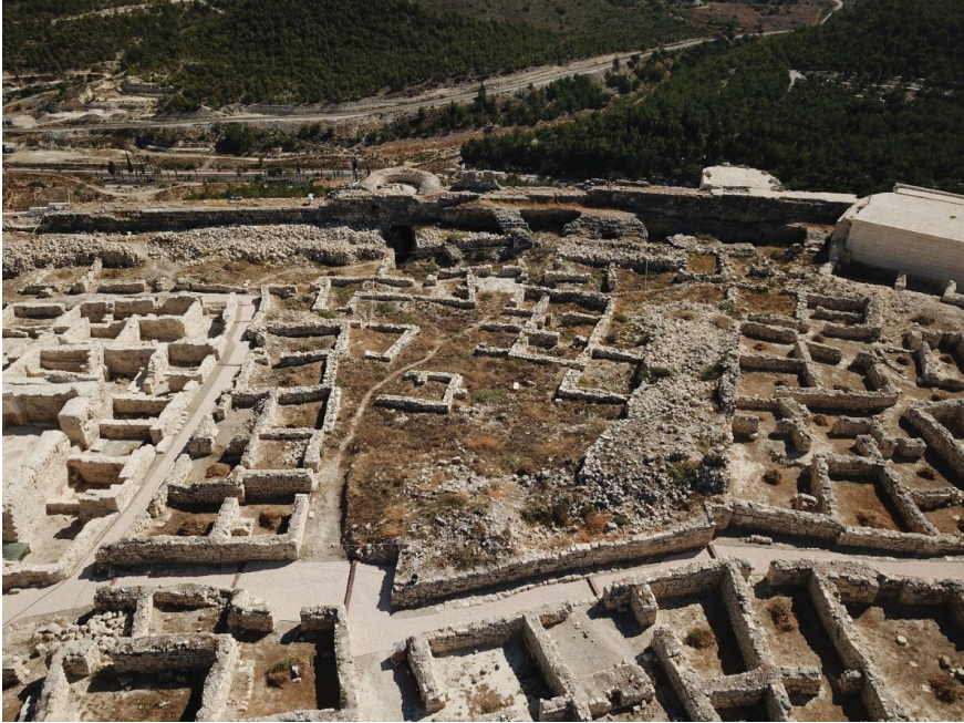
Fotoğraf 17: Arkeolojik kazı öncesi (A21 1. Yol güneyi B koridoru hava fotoğrafı).