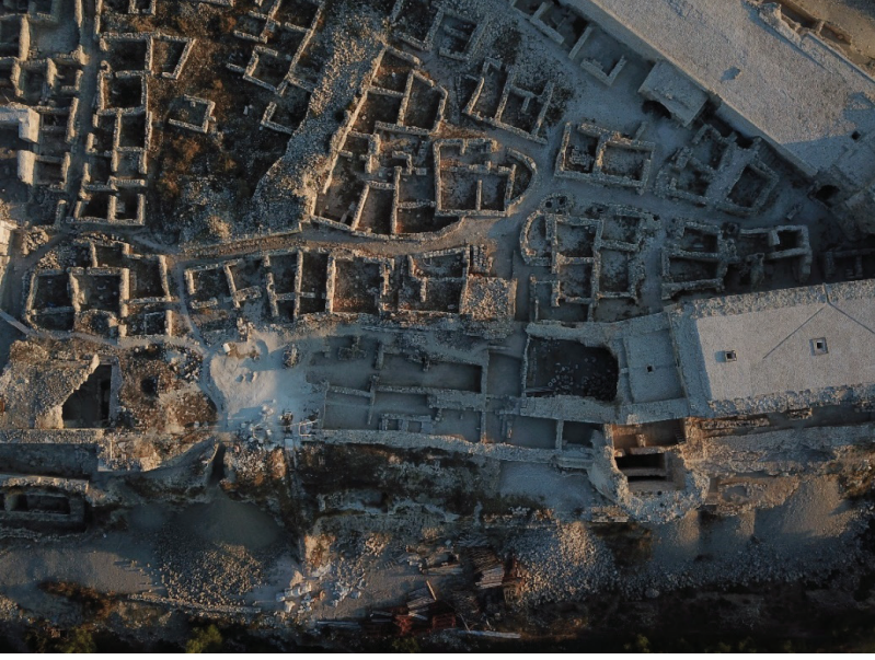
Fotoğraf 11: Arkeolojik kazı ve temizlik öncesi A 4 Mekanı içerisinde yer alan mekanlar.