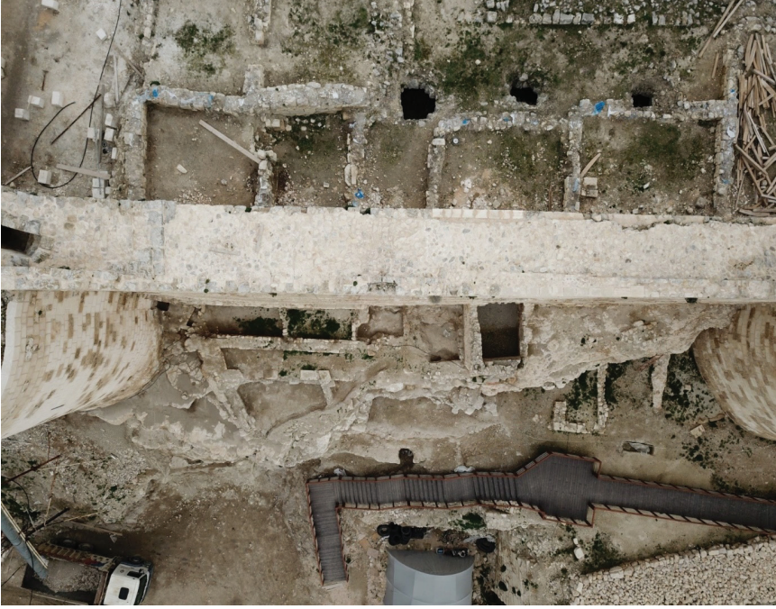
Fotoğraf 22: Arkeolojik kazı ve temizlik sonrası (B7 Bölümünde yer alan mekanlar).