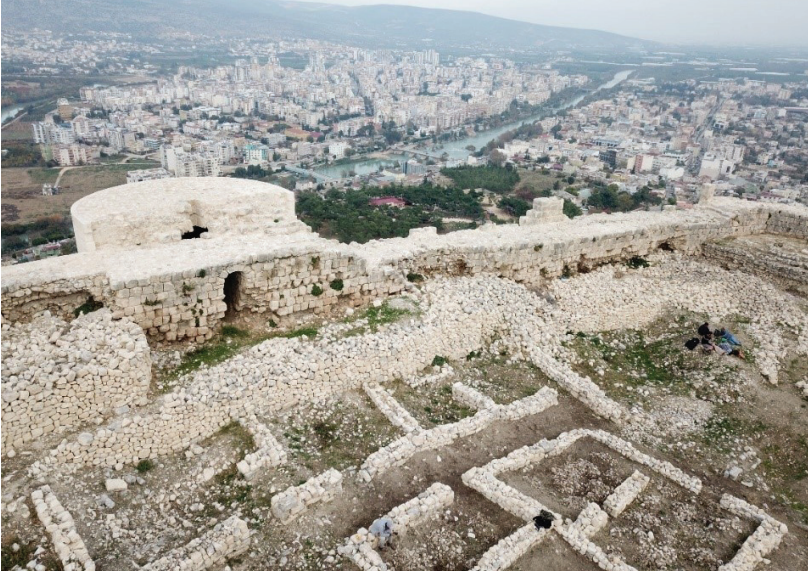
Fotoğraf 19: Arkeolojik kazı ve temizlik öncesi (A20 Burcu önünde yer alan mekanlar).