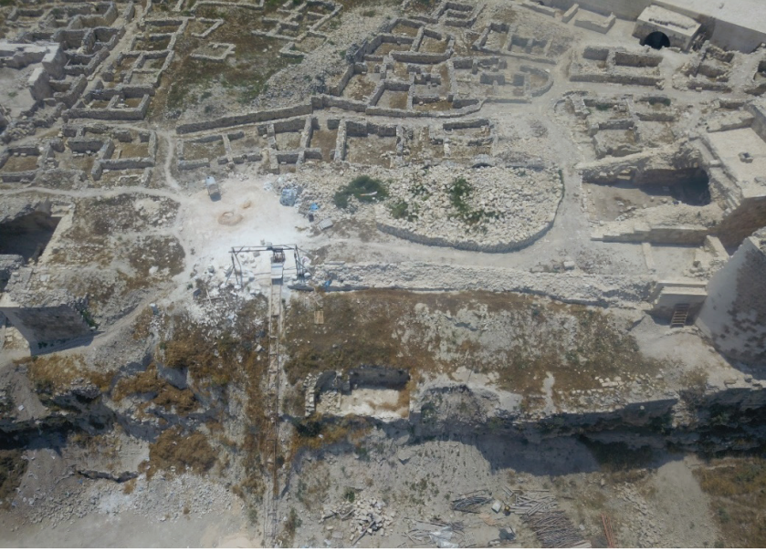
Fotoğraf 5: Arkeolojik kazı ve temizlik ncesi (A6 Mekânı doęusunda yer alan mekanlar).