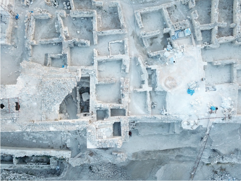
Fotoğraf 12: Arkeolojik kazı ve temizlik sonrası A 4 Mekanı içerisinde yer alan mekanlar.