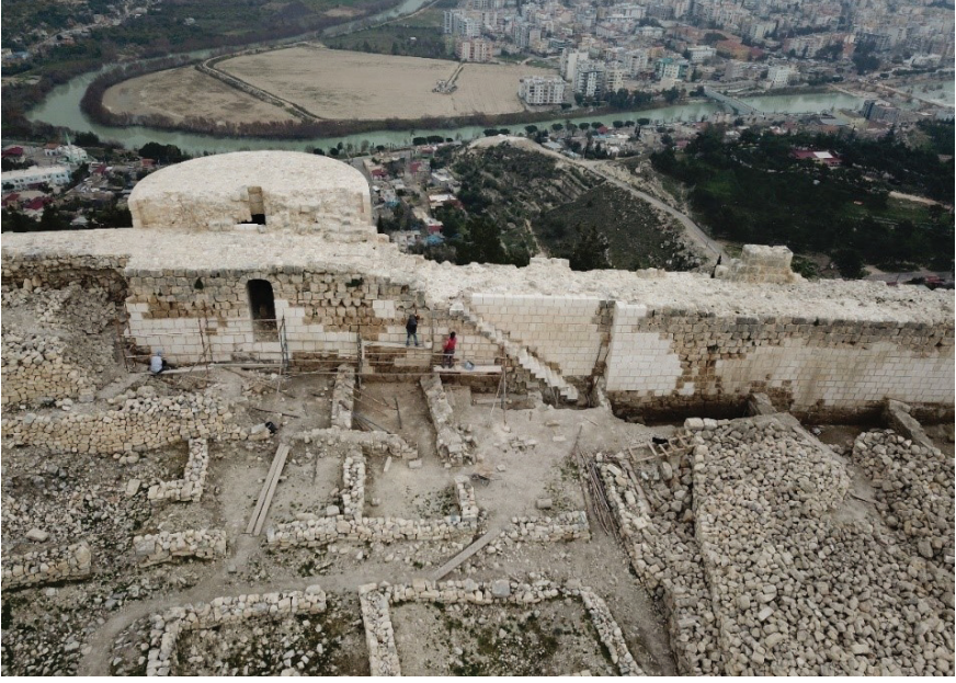
Fotoğraf 20: Arkeolojik kazı ve temizlik sonrası (A20 Burcu önünde yer alan mekanlar).