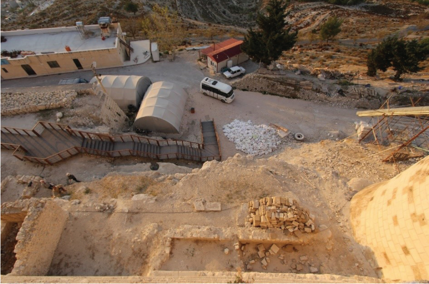
Fotoğraf 21: Arkeolojik kazı ve temizlik öncesi (B7 Bölümünde yer alan mekanlar).