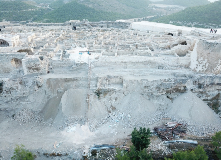
Fotoğraf 6: Arkeolojik kazı ve temizlik sonrası (A6 Mekânı doęusunda yer alan mekanlar).