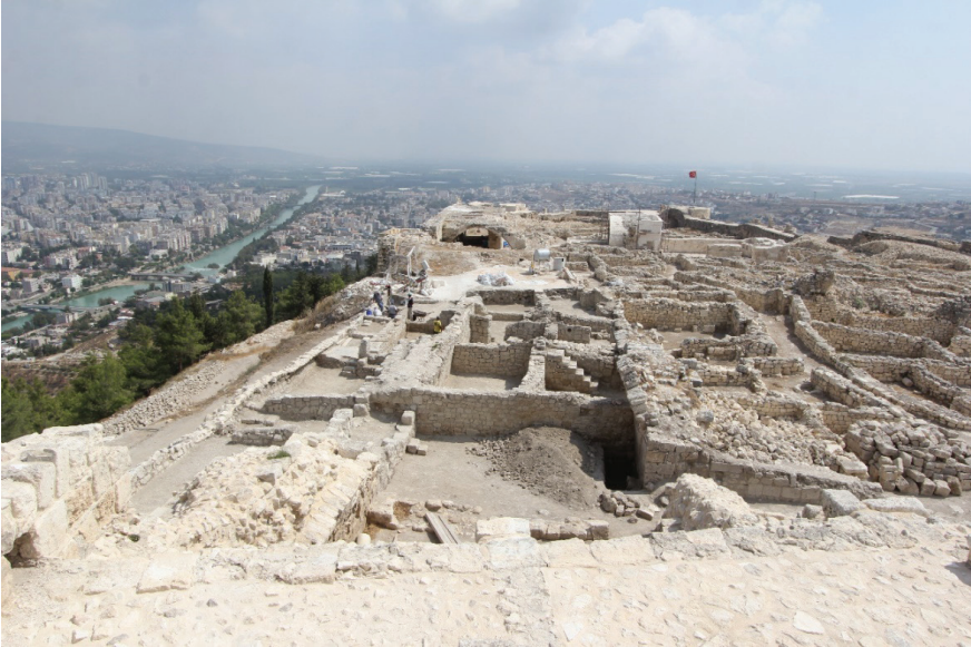
Fotoğraf 10: Arkeolojik kazı ve temizlik sonrası A 5 Mekânı içerisinde yer alan mekanlar.