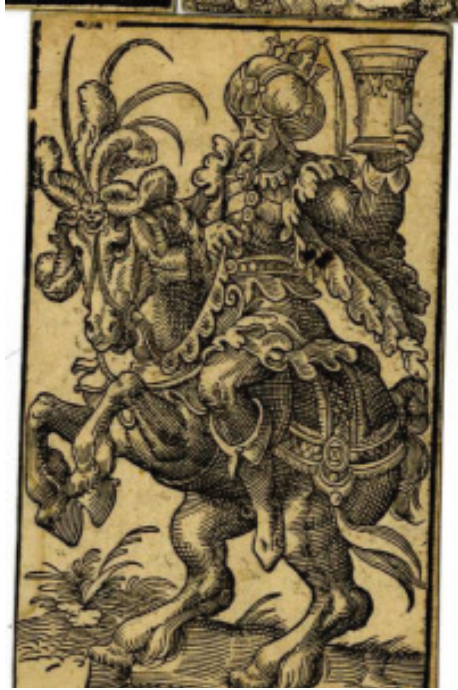
Şekil 6: Jost Amman'ın Kupa Takımı Kral Kartı (The British Museum C, 2022)

yılında yapılmıştır. Sultan, şahlanan bir at üzerinde üç bölü dört profilden bıyıklı olarak resmedilmiştir. Sultanın sol elinde kadeh / kupa tutarken, diğer eliyle atın dizginlerinden tutmaktadır. Sultanın başında tepeliğe eklenmiş bir tacın olduğu sarık bulunmaktadır. Hem sultanın kaftanı hem de atın koşum takımı Osmanlı giyim kuşam geleneğinden uzak olmasına rağmen, atın kuyruğu, Türk geleneğinde olduğu gibi düğümlemiş vaziyettedir.