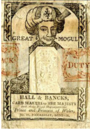
Şekil 7: Hall & Banks ve Ludlow and Company Tarafından Üretilen İskambil Kartı Muhafaza Kutusu (The British Museum D, 2022)

Maça takımının jack / bacak kartı üzerinde Osmanlı sultanı tasvir edilmiştir. De Marchi tarafından Milano’da bir iskambil kartının eskizi olarak el ile çizme suretiyle XIX. yüzyılda yapılmıştır. Çift yönlü olarak tasarlanan kartta Sultan, profilden bıyıklı ve küpe takmış vaziyette resmedilmiştir. Sultanın elinde kılıç, sırtında sadak, başında ise düz tepeliğe sarılmış bir sarığı bulunmaktadır (Şekil 8).