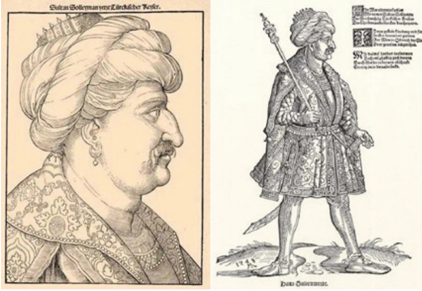
Şekil 15: Büst Portre – Erhard Schoen'in 1532 Tarihli Yavuz Sultan Selim Portresi (Meine Bibliothek, 2022), Boydan Portre – Michael Ostendorfer'in 1548 Tarihli Yavuz Sultan Selim Portresi (Meine Bibliothek A, 2022)

de padişahın başında burmalı bir sarık ve kulağında küpesi olan bir imge bulunmaktadır (M. Şahin 2021: 665). De Marchi'nin kart eskizindeki kıyafet ve başlık farklılığı kartın jack / bacak kartı olması ve kral kartının önüne geçmemesi düşüncesini akla getirmektedir.