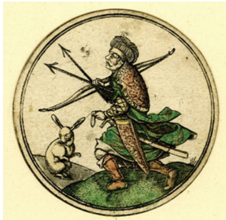
Şekil 4: PW Monogramlı Ustanın Tavşan Takımı Jack / Bacak Kartı (The British Museum B, 2022)

Tavşan takımının jack / bacak kartında bir Türk askeri tasviri bulunmaktadır (Şekil 4). PW monogramlı usta tarafından Köln’de bakır baskı tekniği ile 1499-1503 yılları arasında yapılmıştır. Asker, profilden, ayakta ve hareket halinde bıyıklı olarak resmedilmiştir. Askerin elinde ok ve yay, belinde kılıç ve sadak, sırtında kalkan ve başında sarık bulunmaktadır. Üzerinde kapitoneli iç kaftan ve üzerine giydiği dış kaftanı olup kolları eteğe kadar uzanmaktadır.