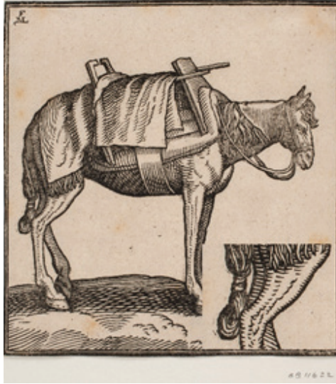
Şekil 13: Melchior Lorck'un Eyerli Türk Atı