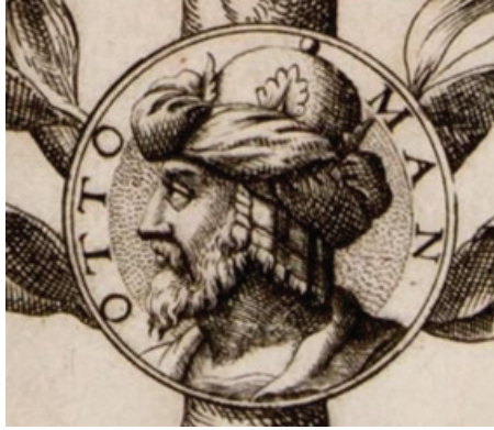
Şekil 11: Francesco Sansovino ve Niccolo Nelli 1567 Tarihli Osmanlı Soyağacındaki Osman Gazi Portresi (The Art Gallery of South Australia, 2022)

Jost Amman'ın iskambil kartı 1588 yılında Nürnberg'de yapılmıştır (Şekil 6) (F.M. O'Donoghue 1901: 94). Amman kartı tasarlarken, Philipp Lonicer ile birlikte 1578 yılında hazırladığı Chronicorum Turcicorum isimli eserindeki Orhan Gazi portresini kendisine prototip olarak kullanmıştır (Şekil 12). Amman, Chronicorum Turcicorum isimli eserdeki portrelerin eskizlerini hazırlarken Melchior Lorck'un etkisinde hazırlandığı düşünülmektedir. Bunun sebebi, Amman ve Lorck'un eserlerindeki başlıkları, silahları, çadırları, kıyafetleri, desenleri ve atların kuyruklarının düğümlü olması vb. birçok hususta birbirleriyle olan uyumdur (Şekil 13). Lorck, 1555-1559 yılları arasında Kutsal Roma Cermen İmparatoru I. Ferdinand'ın elçisi olarak İstanbul'da bulunduğu