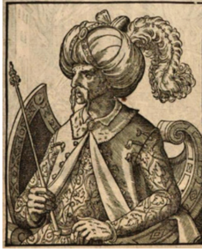
Şekil 12: Philipp Lonicer ve Jost Amman'ın Chorinocrum Turcicorum İsimli Eserindeki Orhan Gazi Portresi (Lonicer, 1578, s. 10)