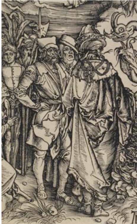
Şekil 9: Albrecht Dürer’in 1498 Tarihinde Basılan Apocalypse İsimli Serisindeki Babil’in Fahişesi Sahnesinden Kesit (The British Museum F, 2022)