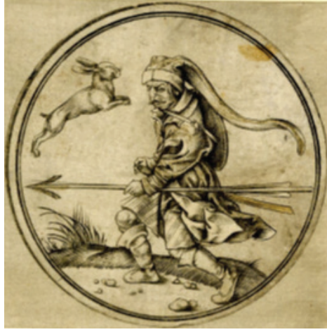
Şekil 3: PW Monogramlı Ustanın Tavşan Takımı Jack / Bacak Kartı (The British Museum A, 2022)

Tavşan takımının jack / bacak kartında bir Türk askeri tasviri bulunmaktadır (Şekil 4). PW monogramlı usta tarafından Köln’de bakır baskı tekniği ile 1499-1503 yılları arasında yapılmıştır. Asker, profilden, ayakta ve hareket halinde bıyıklı olarak resmedilmiştir. Askerin elinde ok ve yay, belinde kılıç ve sadak, sırtında kalkan ve başında sarık bulunmaktadır. Üzerinde kapitoneli iç kaftan ve üzerine giydiği dış kaftanı olup kolları eteğe kadar uzanmaktadır.