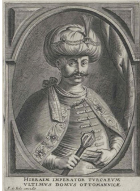
Şekil 14: Peeter II de Jode'nin XVII. yüzyılın İkinci Yarısına Tarihlenen Sultan İbrahim Portresi (Österreichische Nationalbibliothek, 2022)

Hall & Banks ve Ludlow and Company tarafından 1800'lü yıllarda hazırlanan iskambil destesi muhafaza kutusunun üzerinde Great Mogul ibaresine yer verilse de portredeki şahıs, Peeter II de Jode'nin XVII. yüzyılın ikinci yarısında hazırladığı Sultan İbrahim portresidir (W.H. Willshire 1879: 26) (B. Mahir 2011: 169) (Şekil 14). Hall & Banks ve Ludlow and Company isimli üreticinin Great Mogul / Babürlü imgesini resmetmek için Jode'nin tasvirini kullandığı açıktır. İmgelemenin böyle bir yoldan seçilmesinin temel sebebi, Müslümanların tanımının değişmesidir. Başlangıçta sarazen kelimesi ile tanımlanan Müslümanlık, daha sonraki dönemde Türklerin Avrupa üzerindeki tesiri ile birlikte Müslüman ve Türk kelimeleeri aynileşmiştir (İ.H. Danişmend, 1982).