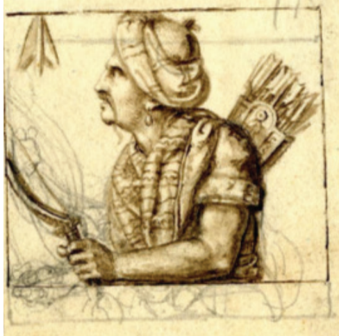
Şekil 8: De Marchi’nin Maça Takımı Jack / Bacak Kartı (The British Museum E, 2022)

Maça takımının jack / bacak kartı üzerinde Osmanlı sultanı tasvir edilmiştir. De Marchi tarafından Milano’da bir iskambil kartının eskizi olarak el ile çizme suretiyle XIX. yüzyılda yapılmıştır. Çift yönlü olarak tasarlanan kartta Sultan, profilden bıyıklı ve küpe takmış vaziyette resmedilmiştir. Sultanın elinde kılıç, sırtında sadak, başında ise düz tepeliğe sarılmış bir sarığı bulunmaktadır (Şekil 8).