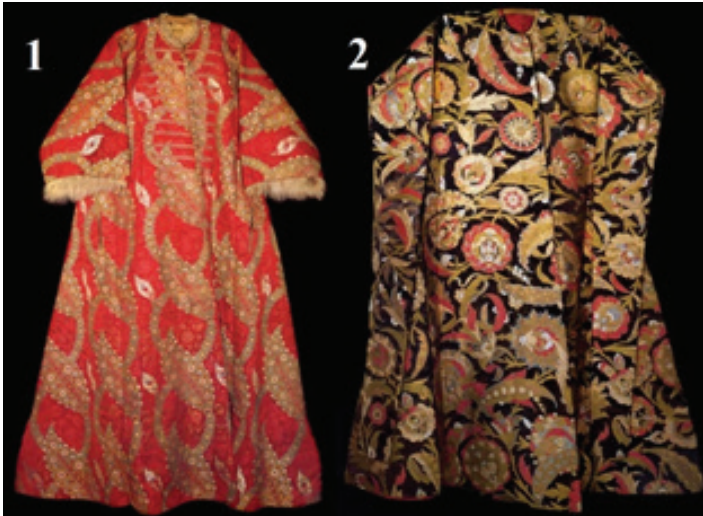
Şekil 16: 1 – II. Bayezid' e Ait Olduđu Dřnlen Kapanie ve apraıtlı Kaftan (Ottoman Turkish Garment Database, 2022) 2 – Kanuni Sultan Sleyman'ın Ođlu Şehzade Bayezid' e Ait Olduđu Dřnlen Kaftan (Ottoman Turkish Garment Database A, 2022)

PW monogramlı usta ve Peter Fltner' in kartlarındaki şahsiyetlerin zerine giydikleri kaftanlar, Osmanlı giyim kuşamıyla uyum ierisinde. PW monogramlı ustanın kral kartındaki sultanın giydiđi kaftan kapanievari bir kaftandır. PW monogramlı ustanın jack / bacak kartlarındaki ve Peter Fltner' in kral kartındaki şahsiyetlerin kaftanları ise, eteđe kadar uzanan ve giyilmeyen kollarıyla Osmanlı dnemindeki rneklerle oldukça fazla benzerlik gstermektedir (Şekil 16) (N. Atasoy 2020: 709-710). Ancak tasvirlerde kaftanların boylarının diz hizasında bitmesinin iki temel sebebi olabilir. Bunlardan ilki Avrupa'da XIV. yzyıldan sonra yaygınlaşan Hose isimli pantolon olabileceđi gibi bir diğr sebep, Osmanlı askerlerinin savaş esnasında daha rahat etmek iin yarım boy kaftan giymeleri veyahut da yarım boy kaftanı olmayan askerlerinde kaftan eteklerini bellerine iliřtirmelerinden dolayı gerekleşmiş olabilir (R.H. Kemper 1977: 70-71) (Bađcı, ađman, Renda, ve Tanındı, 2006: 220-223).