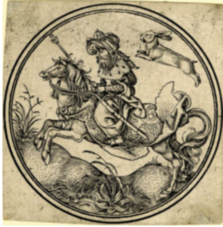
Őekil 2: PW Monogramlı Ustanın TavŐan Takımı Kral Kartı (The British Museum, 2022)

ği ile 1499-1503 yılları arasında yapılmıştır. Sultan, şahlanmış at üzerinde profilden, sakallı ve bıyıklı olarak resmedilmiştir. Sultanın elinde asa, belinde kılıç, başında ise b rk-i horasani denen taylasanlı sarıđı bulunmaktadır.  zerinde desensiz bir Őalvar, kapitoneli i  kaftan ve kapani evari k rkl  dıŐ kaftanı olup kolları eteđe kadar uzanmaktadır.