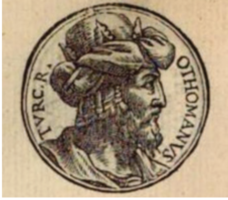
Şekil 10: Guillaume Rouille'nin 1553 Tarihli Promptuarium Iconum Insigniorum Eserindeki Osman Gazi Portresi (Rouille, 1553, s. 180)