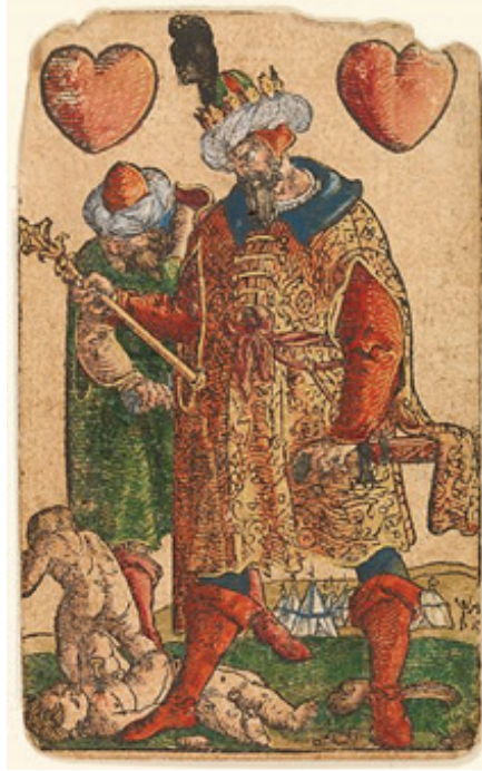
Şekil 5: Peter Flötner’in Kupa Takımı Kral Kartı (The Metropolitan Museum of Art, 2022)

Kupa takımının kral kartında Osmanlı sultanı ve askerinin var olduğu bir kompozisyon yer almaktadır (Şekil 5). Peter Flötner tarafından Nürnberg’de ağaç baskı ve sulu boya tekniğinde 1540 yılında yapılmıştır. Sultan ve askeri bir ordugahın önünde bebekleri katlederken tasvir edilmiştir. İncil’de bahsi geçen Hirodes’in Masumların Katline gönderme yapılarak, Türklerin zulmünden bahsedilmiş, Hristiyanlık tarihinin ilk dönemlerindeki düşman ile kartın yapıldığı dönemdeki düşman olarak görülen Türkler aynileştirilmiştir. Sultan, profilden, sakallı ve bıyıklı olarak resmedilmiştir. Sultanın elinde asa, belinde kılıç başında ise börk-i horasani denen sarığı bulunmaktadır. Üzerinde kolları eteğe kadar uzanan, yakası geriye doğru açılan bitkisel motifli ve çaprast düğmeli kaftanı bulunmaktadır. Bebeklere kılıcıyla hamle yapmak üzere olan askerinde ise pelerinvari bir kaftan ve düz tepeliğe sarılmış kaftanı bulunmaktadır.