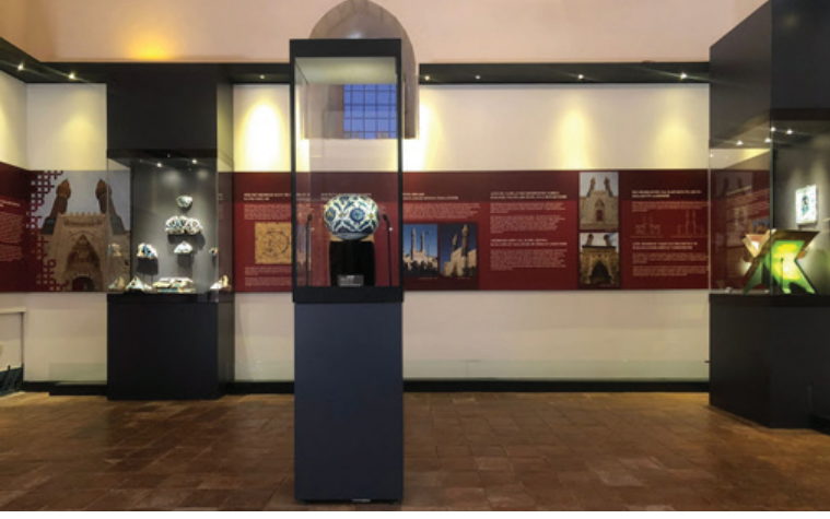
Fotoğraf 2: Kuzey doğudaki büyük oda, Sahip Ata Odası, çini ve ahşap sergileme.

Yapının kuzey cephesindeki odalarda; İslam medeniyetinde eğitim, (Fotoğraf 3), Anadolu’da medrese ve vakıf kültürü (Fotoğraf 4) (Fotoğraf 5 a, b, c), Gök Medrese’nin sanatsal değeri, yapımı, şehir planlamasındaki yeri, Gök Medrese kronolojisi, restorasyon ve bakım süreci anlatılmaktadır.