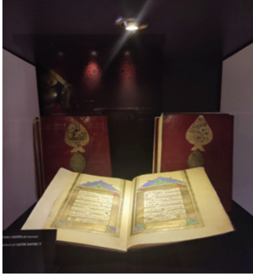
Fotoğraf 4: Vakıf kültürü, el yazması Kur'an-ı Kerim cüzleri.