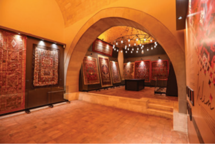
Fotoğraf 11 a: Sivas halısı ve kilimi sergileme odası.

Güney doğu köşedeki kütüphane kısmında Sivas halıları ve kilimleri sergilenmektedir. Bu odanın girişinde bulunan tonozlu dikdörtgen alanda Sivas kilimleri, buraya bir kemerle açılan, zemini yükseltilmiş kubbeli alanda Sivas halıları sergilenmektedir. (Fotoğraf 11 a, b, c) Sayı olarak çok fazla olan ve sergilenemeyen halı ve kilimlerin bilgilerinin yüklendiği dokunmatik masa da bu odada yer almaktadır. (Fotoğraf 12)