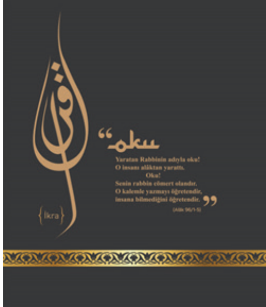
Fotoğraf 3: İslam Medeniyetinde eğitim odasından bir görüntü.

Yapının kuzey cephesindeki odalarda; İslam medeniyetinde eğitim, (Fotoğraf 3), Anadolu’da medrese ve vakıf kültürü (Fotoğraf 4) (Fotoğraf 5 a, b, c), Gök Medrese’nin sanatsal değeri, yapımı, şehir planlamasındaki yeri, Gök Medrese kronolojisi, restorasyon ve bakım süreci anlatılmaktadır.