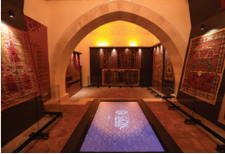
Fotoğraf 11 c: Sivas halısı ve kilimi sergileme odası. (Mze arşivi)