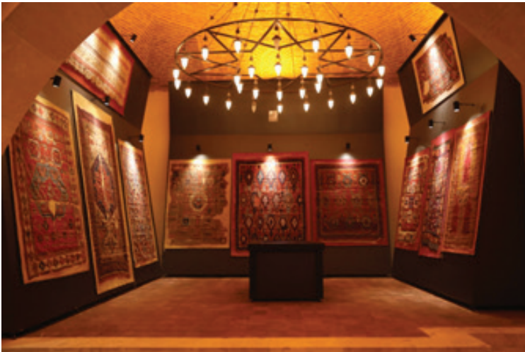
Fotoğraf 11 b: Sivas halısı ve kilimi sergileme odası. (Müze arşivi)