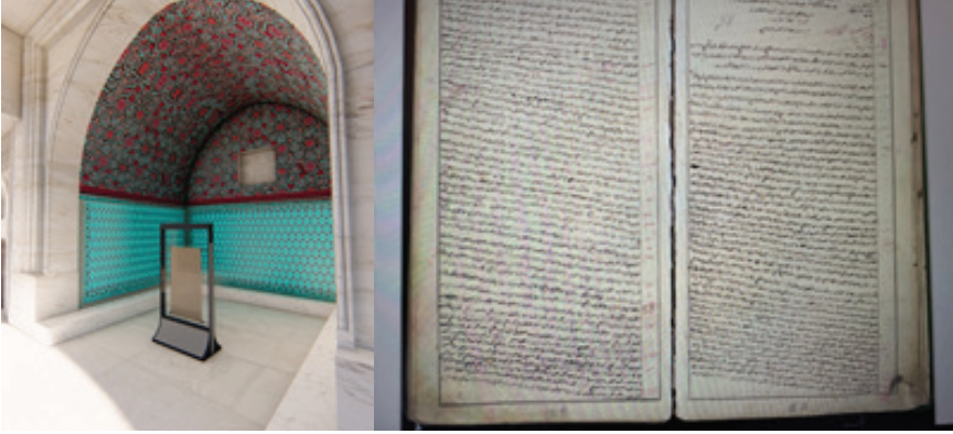
Fotoğraf 6: Kuzey ve gney eyvanda Gk Medrese vakfiyesinin ve çevirisinin kopyasının grntleri (Mze arşivi)

Kuzey ve gney eyvanda panolarda Sahip Ata'nın Gk Medrese vakfiyesinin ve çevirisinin grntleri sergilenmektedir. (Fotoğraf 6)