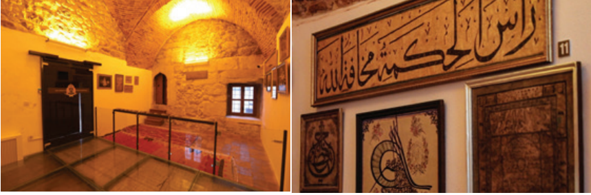
Fotoğraf 8: Derslik canlandırması ve hat levhalardan görüntüler

Girişin kuzeyindeki kubbeli oda darülkurra, derslik odasıdır. Burada derslik canlandırması yapılmıştır. Duvarlarda, müze koleksiyonunda bulunan hat levhalardan bazı örnekler sergilenmektedir. (Fotoğraf 8) Girişin güneyindeki kubbeli oda ise mescittir. Burada da mescit canlandırması yapılmıştır. (Fotoğraf 9)