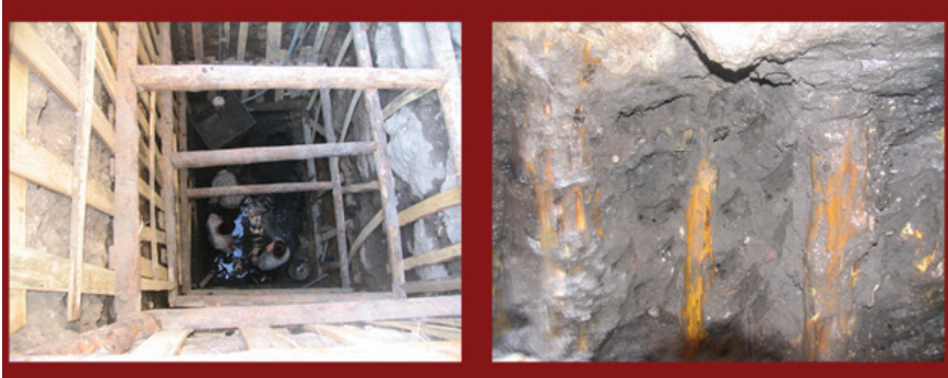
Fotoğraf 7: Gk Medrese restorasyonu odasında fore kazık sistemi anlatımı (Mze arşivi)

Bataklığın stnde asırlar boyu ayakta kalan Gk Medresenin temellerinden, yaklaşık 900 yıllık ardıç ağaçları çıkmıştır. Bunlar yapıda 751 yıl önce uygulanmış bir mhendislik harikası olan Fore Kazık Sistemidir. (Fotoğraf 7)