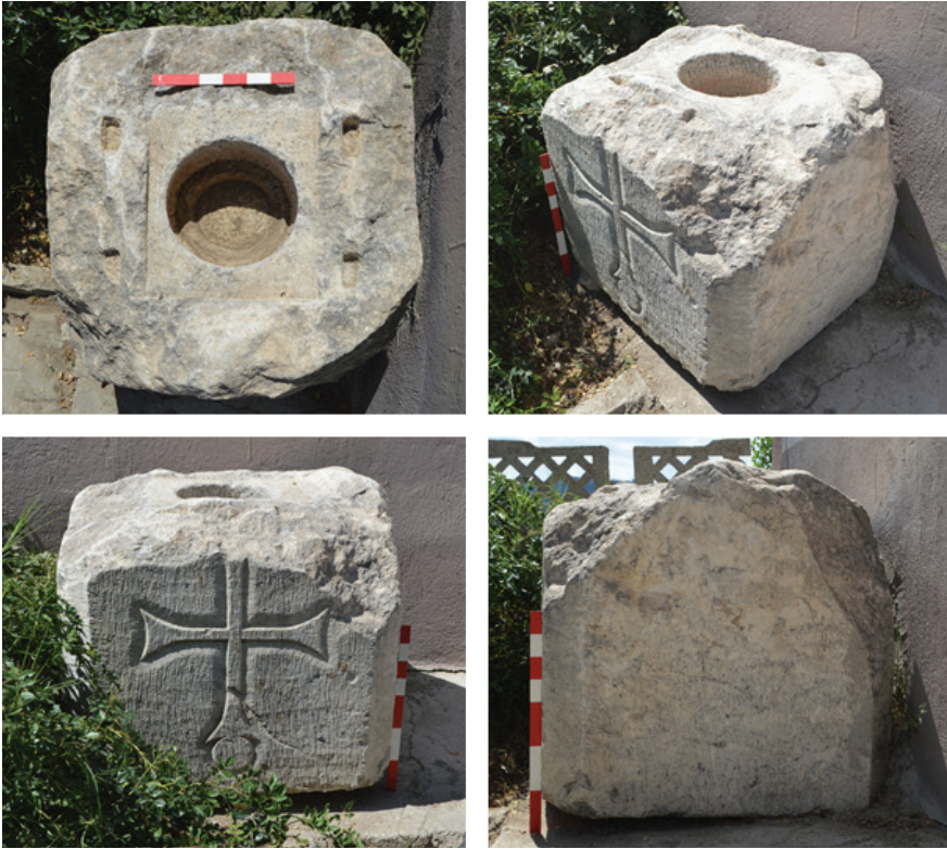
Resim 01-04. Özburun altarı