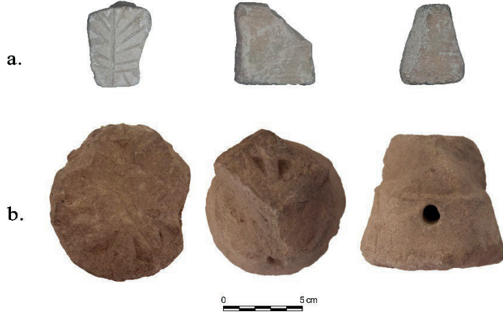
Görsel: 8 – Silifke Kalesi Damga Buluntuları (a.2023 kazı döneminde bulunan ekmek damgası, b.2018 kazı döneminde bulunan damga)