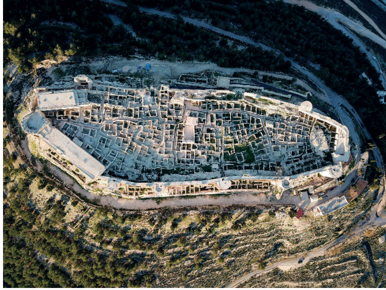
Görsel 3 – Silifke Kalesinin iç kısmı Havadan Görünümü