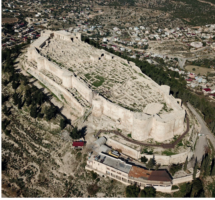
Görsel 3 – 2023 Yılı Silifke Kalesi Kazı Çalışmaları Sonrası Hava Fotoğrafi