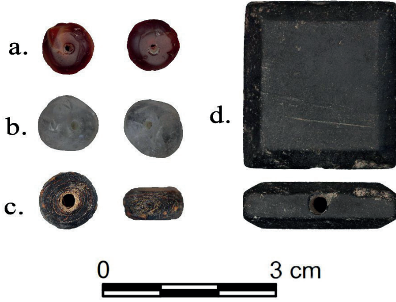
Görsel 9 – Silifke Kalesi 2023 Yılı Boncuk Buluntuları (a. Akik Boncuk, b. Kuvars Boncuk, c. Ahşap Boncuk, d. Siyah Oniks? Boncuk)