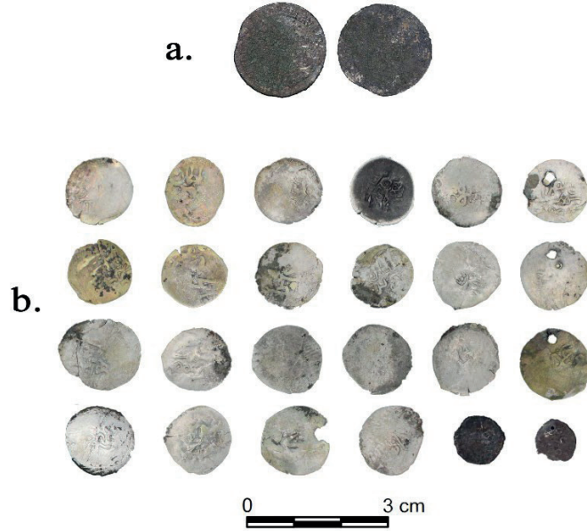
Görsel 12 – Silifke Kalesi 2023 Yılı Sikke Buluntuları (a. A-21 Doğusu (CD) 47 No.lu Mekânda ortaya çıkarılan 1660 yılına tarihlenen 14.Lois dönemine ait Fransız sikkesi, AG, 20mm, 2,20gr, ky.6, b. A-5 11 No.lu Mekânda Ortaya çıkarılan 1756-57 yılları arasına tarihlenen 3.Osman Dönemi 24 adet sikkeden oluşan define buluntusu, AG, 9-15mm, 0.35- 0.63gr.)