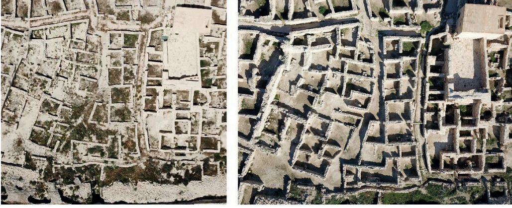
Görsel 4 – A-5 ile A-12 Arasında Kalan Mekanların Kazı Çalışmaları Öncesi ve Sonrası Hava Fotoğrafi