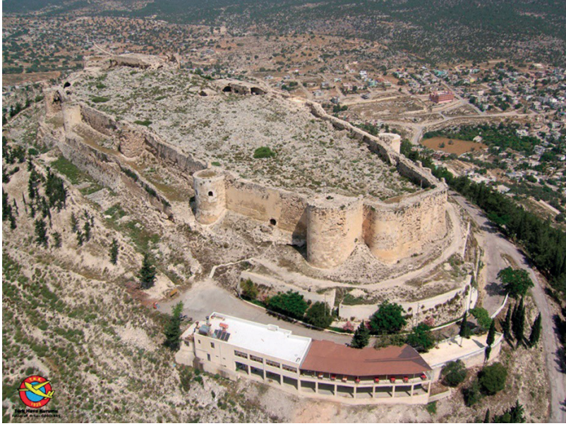
Görsel 2 – Kazı Çalışmaları Öncesi Hava Fotoğrafi