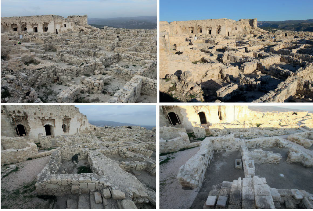
Görsel 5 – Konservasyon Çalışması Öncesi ve Sonrası