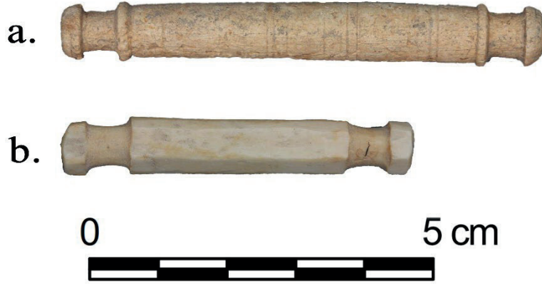
Görsel 7 – Silifke Kalesi 2023 Kemik Makara Buluntuları