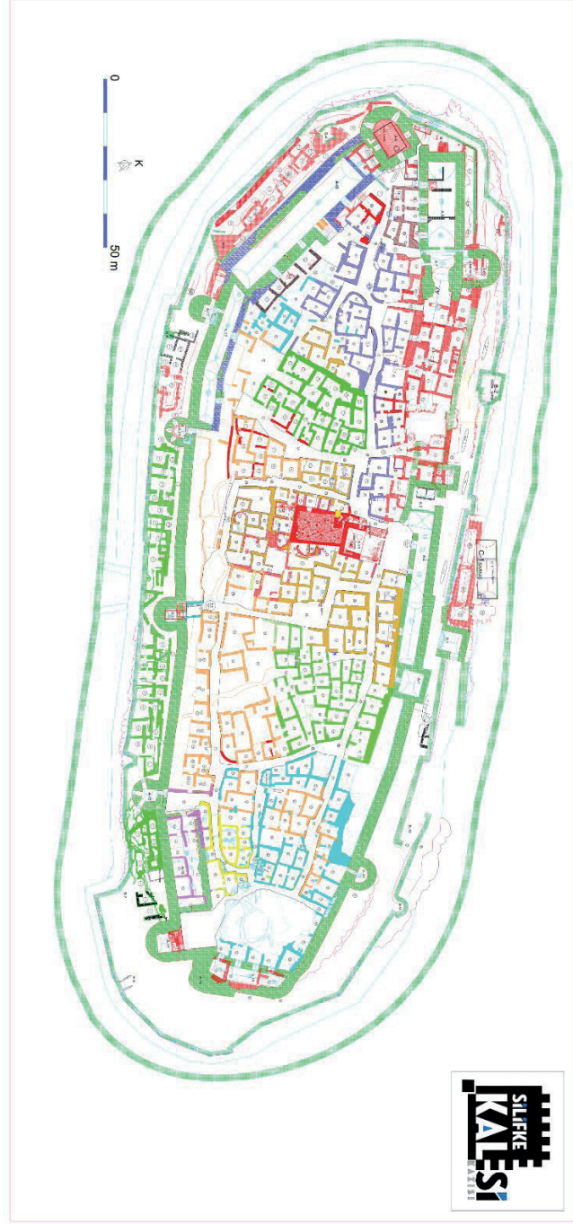
Görsel 13 – Silifke Kalesi Çalışma alanlar Çizim