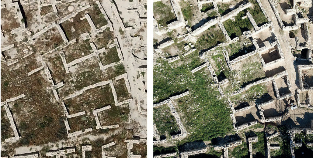
Görsel 6 – A-16 ile A-20 Arasında Kalan Mekanların Kazı Çalışması Öncesi ve Sonrası Hava Fotoğrafi