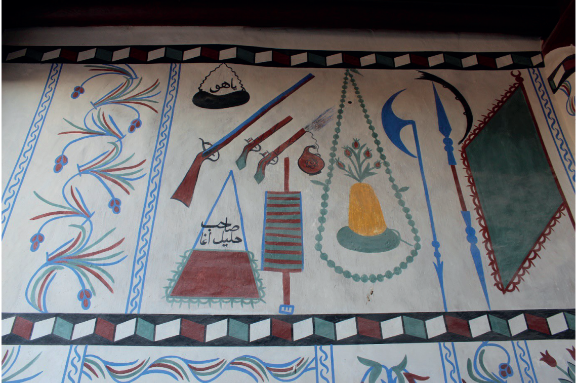
Görsel 7: Pamukkale/Belenardıç Camii Son Cemaat Yeri Doğu Duvarı