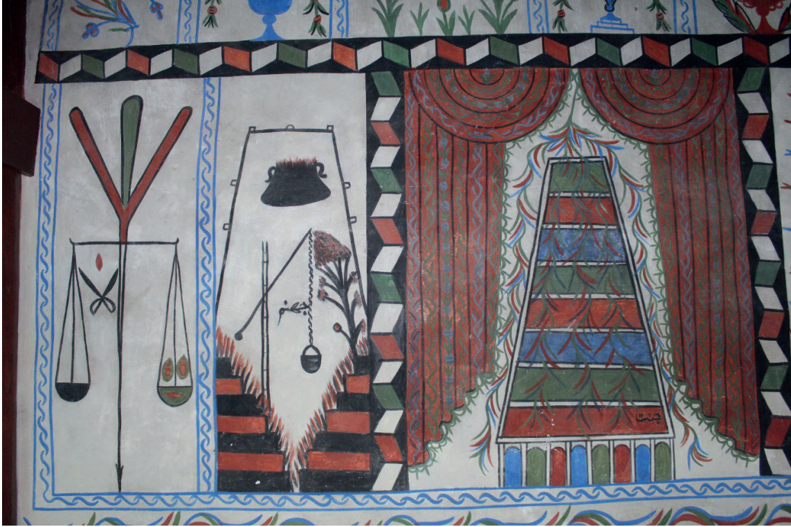
Görsel 9: Pamukkale/Belenardıç Camii Mizan Terazisi, Cehennem ve Cennet Tasvirleri

mavi renkli sekiz yatay basamak, aşağıdan yukarıya doğru giderek daralmıştır. En alttaki kırmızı basamağın kenarına Arapça harflerle “ cennet ” ibaresi okunmaktadır. Sekiz basamaklı katmanın tabanında, içleri mavi, yeşil ve kırmızı renklerle boyanmış, adeta basık kemerli kapıları andıran dikey bölmeler mevcuttur. Bu betimlemeyi en üstte, tek bir kökten çıkarak iki yana ve sekiz katlı basamağın üzerine doğru aşağıya sarkan kıvrık dallar donatmıştır. Son olarak cennet tasviri, iki yanda perde kompozisyonu ile vurgulanmıştır.