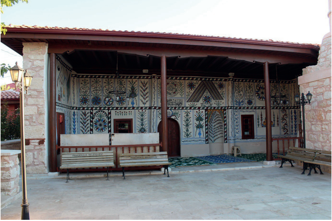
Görsel 6: Pamukkale/Belenardıç Camii Son Cemaat Yeri