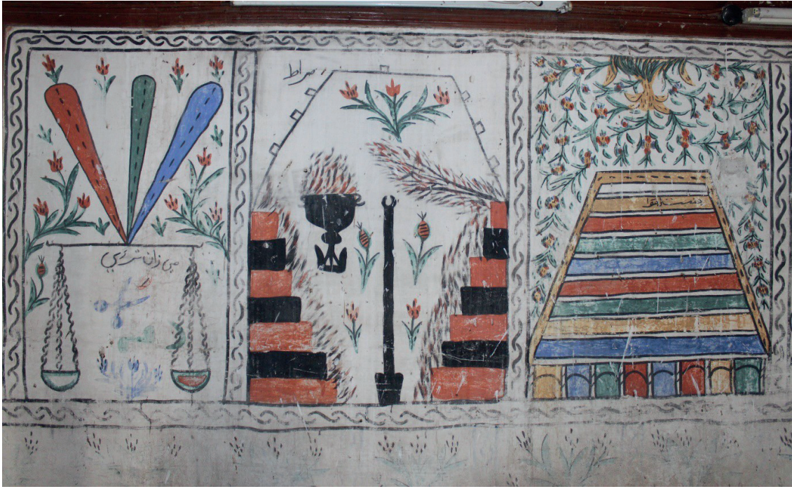
Görsel 13: Pamukkale/Akköy Yukarı Camii Mizan Terazisi, Cehennem ve Cennet Tasvirleri

sola yatık vaziyette kuru bir ağaç ve ağzından ateş saçan kazan resmedilmiştir. Bu betimlemeleri ise üstte, çizgisel olarak ele alınmış sırat köprüsü çevrelemektedir. Köprünün hemen yanına Arapça harflerle “ Sırat ” yazısı yazılmış ve alt kısmına ise aynı kökten çıkan üç lale motifi işlenmiştir. Cennet tasvirli resimde mavi, sarı, yeşil, kırmızı renkli sekiz yata basamak, aşağıdan yukarıya doğru giderek daralmıştır. En yukarıdaki sarı basamakta Arapça harflerle “ Cennetü’l-me’va ” yazısı okunmaktadır. Sekiz basamaklı katmanın tabanında, içleri sarı, mavi, yeşil ve kırmızı renklerle boyanmış, adeta basık kemerli kapıları andıran dikey bölmeler bulunmaktadır. Bu betimlemeyi en üstte, tek bir kökten çıkan ve iki yana doğru aşağıya sarkan kırmızı çiçekli ve yeşil yapraklı bitkisel motifler tamamlamıştır.