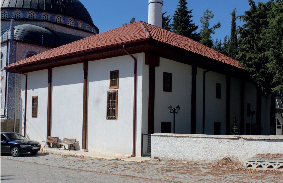
Görsel 1: Baklan/Boğaziçi Eski Camii Güney ve Doğu Cephesi

Denizli'nin Baklan ilçesine bağlı Boğaziçi Mahallesi'nde yer almaktadır (Görsel 1). Caminin hariminde üç tarih okunmaktadır. İkisi H. 1188/M. 1774-1775 tarihi olmak üzere harimi ayıran ahşap desteklerin kemer köşeliğindeki limon ağacı altında ve geometrik motifin ortasında görülmektedir (Görsel 2). Üçüncü tarih olan H. 1293/M. 1876-1877, harimin doğu duvarının kuzey kenarında, sancak, mızrak, teber, farklı türden sarıklar, keşkül, tüfekler, kılıç, heybe gibi sembolik tasvirleri içeren panonun üstündeki yazı şeridinin sonunda bulunmaktadır (Görsel 3). Bu yazı şu şekildedir: “ Okurum hakk ayeti salavatıyla salavatı akabinde münacatı şefaata ya Resululallah 1293 ”. Söz konusu verilere göre harimin örtü sistemindeki bezemelerin H. 1188/M. 1774-1775 tarihinde yapıldığı ve caminin de yaklaşık aynı tarihlerde inşa edildiği belirtilmiştir. H. 1293/M. 1876-1877 ise duvar resimlerinin yapıldığı tarih olduğundan bahsedilmiştir. Nitekim örtüde ve duvarlarda görülen bezemelerin konu ve üslup bakımından farklı özellikler göstermesi ve tarihi bilinen Belenardıç Camii'nin (inşa: 1884, duvar resimleri: 1885-1886) duvar resimleriyle benzer olması ileri sürülen düşüncüyü desteklediği ifade edilmiştir (Çakmak 1995: 534).