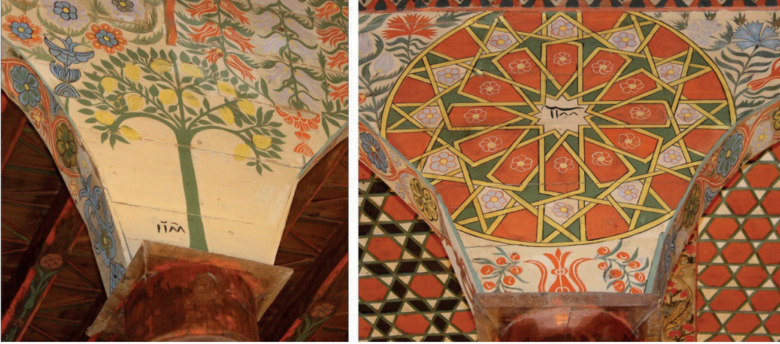
Görsel 2: Baklan/Boğaziçi Eski Camii Harimindeki 1188 Tarihleri