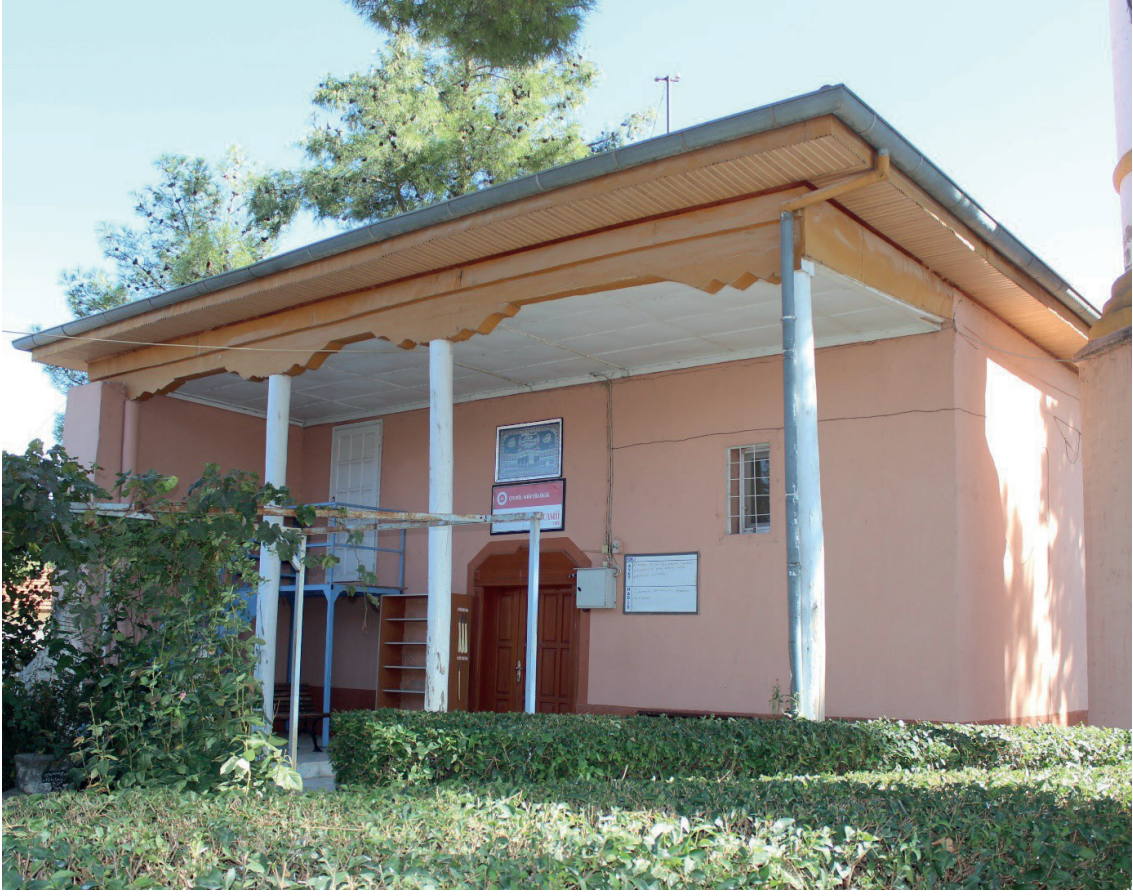
Görsel 14: Çivril/Bulgurlar Camii Son Cemaat Yeri

Kareye yakın planlı harim, mihrap duvarına dik uzanan üç sahına ayrılmış olup, her sahin iki sıra halinde ikişerden dört ahşap destekle taşınmıştır. Harimin kuzeyinde bir yan duvarla kapalı olan son cemaat yeri mevcuttur. Kuzeybatı köşede ise özgün olmayan minaresi yükselmektedir. Harimin duvarlarında görülen resimlerin konusu ağaçlar, saat, perde, vazodan çıkan çiçekler, Kâbe, cami, ibrik, karpuz ve kavun, çeşitli bitkisel ve geometrik bezemeler, mizan terazisi, cennet ve cehennem gibi sembolik tasvirler ve yazılardan oluşmaktadır (Görsel 15). Harimin duvarları ince bir sıvayla kaplanmış ve bu sıvanın üzerine duvar resimleri işlenmiştir (Dalkılıç 2023: 1306-1341).