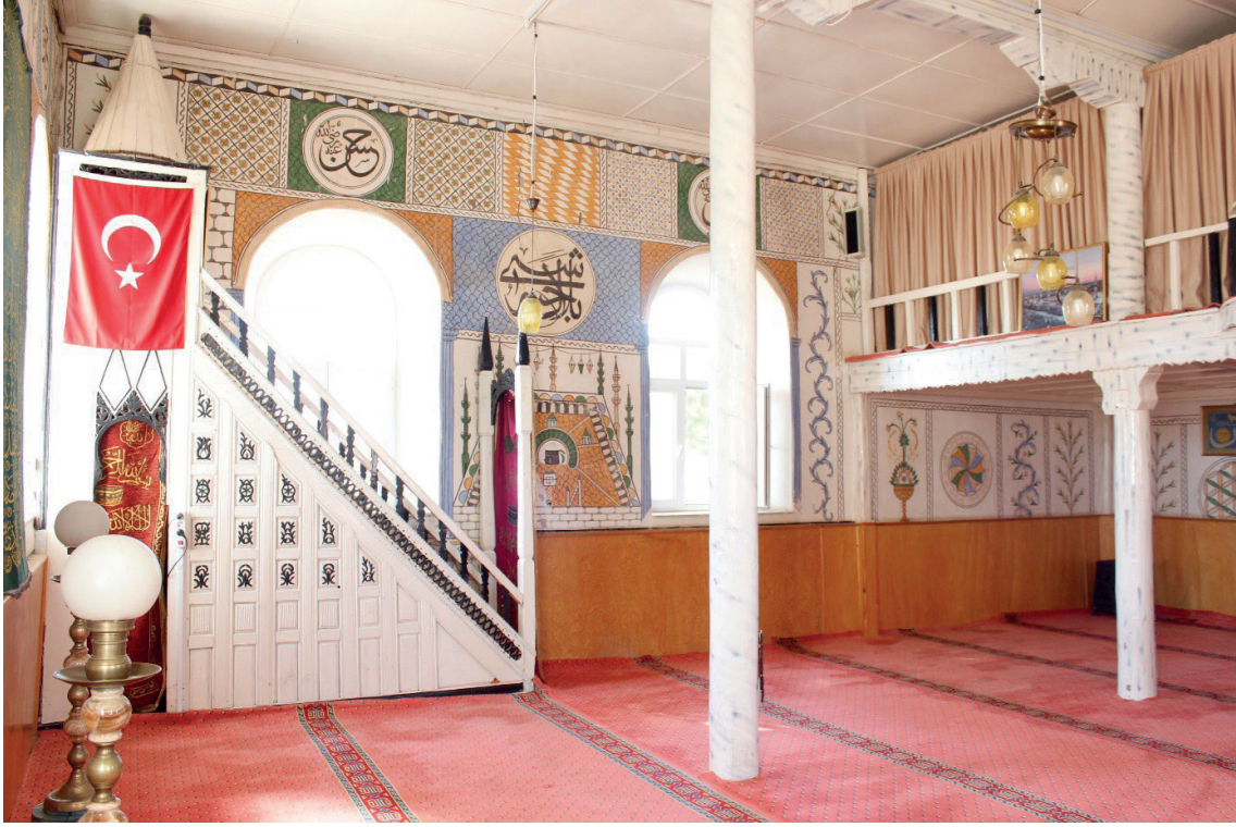
Görsel 15: Çivril/Bulgurlar Camii Harimi