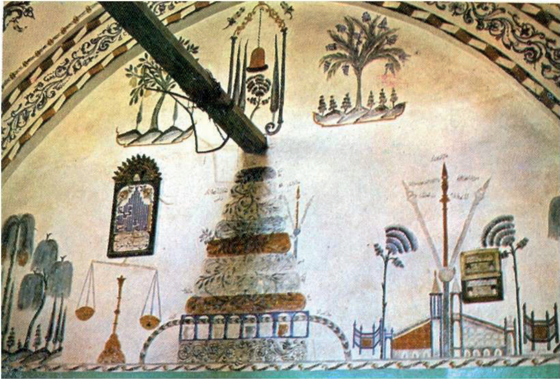
Görsel 18: Tokat/Zile Şeyh Nasreddin (Nusret) Türbesi (Çal 1987: 433)