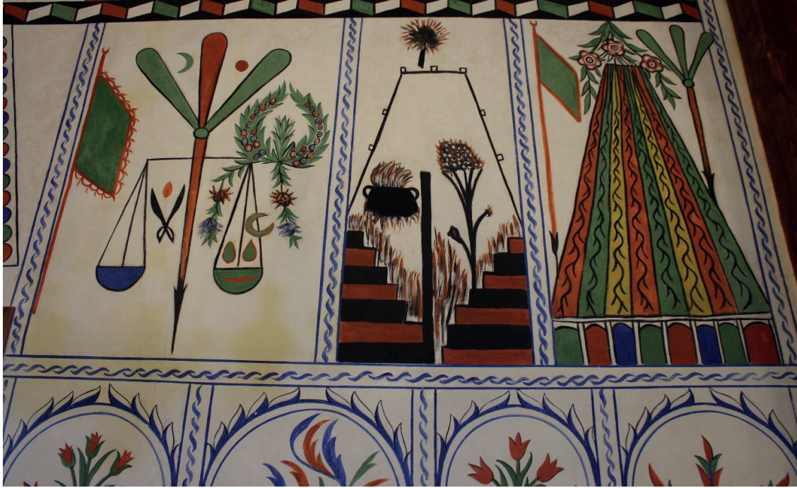
Görsel 5: Baklan/Boğaziçi Eski Camii Mizan Terazisi, Cehennem ve Cennet Tasvirleri (Çiftiyürek Arşivi, 2024)

yukarıya doğru daralarak piramidal biçim alan bu basamakların içlerine kıvrık dal şeklinde motifler çizilmiştir. Her bir basamağın alt kısmında, içi yeşil, kırmızı, mavi renklerle boyanmış, adeta basık kemerli kapıları andıran dikey bölmeler bulunmaktadır. Basamakların en üst bölümünde, aynı kökten çıkan üç adet kırmızı çiçekli ve yeşil yapraklı bitkisel motif görülmektedir. Bu betimlemenin bir yanına sancak, diğer yanına üç kollu bir mızrak resmedilmiştir.