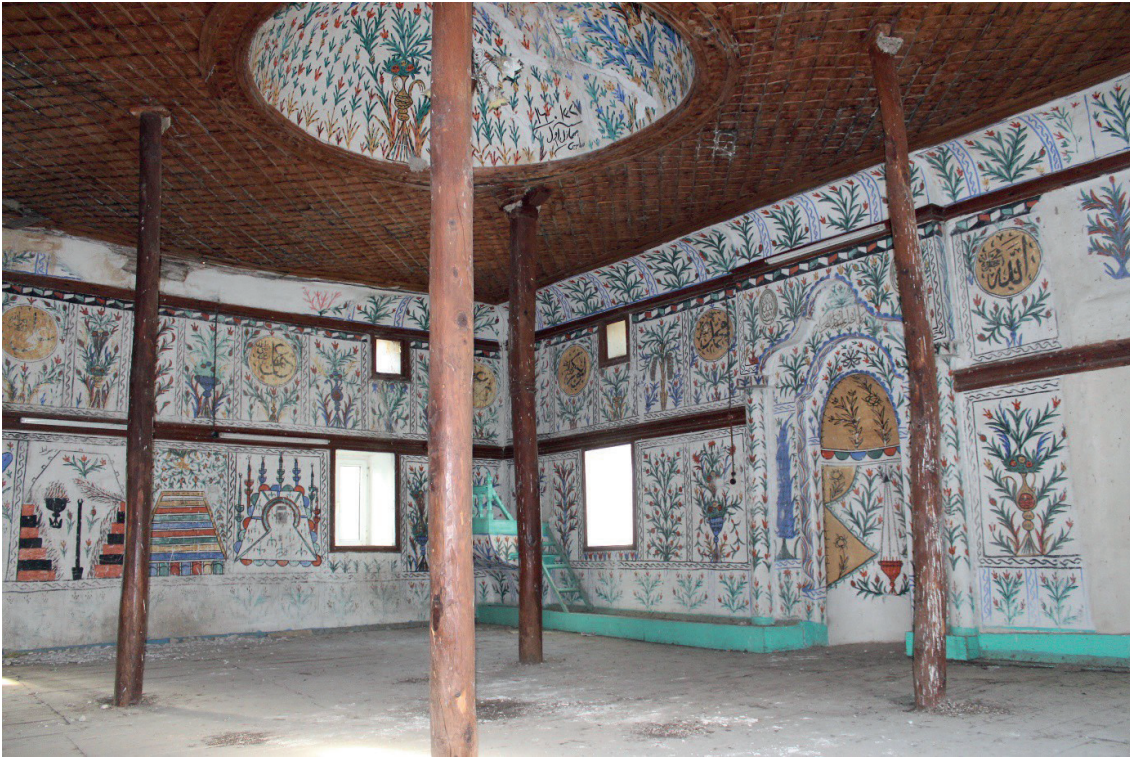
Görsel 12: Pamukkale/Akköy Yukarı Camii Harimi

Kareye yakın dikdörtgen planlı harimin ortasında, dıştan belli olmayan ve dört ahşap desteğin taşıdığı küçük bir kubbe vardır. Yapının kuzeyinde son cemaat yeri mevcuttur. Kuzeydoğu köşedeki minare ise özgün değildir. Yapıda ahşap ve duvar üzerine yapılmış çeşitli süslemeler görülmektedir. Bunlardan duvar resimleri harimde ve son cemaat yerinde olmakla birlikte son cemaat yerindeki resimler dökülmüş vaziyettedir. Konu olarak ağaçlara, vazo ve ibrikten çıkan çiçeklere, çeşitli bitkisel motiflere, Kâbe tasvirine, kandil ve perde motifine, geometrik bezemelere, mizan terazisi, cennet ve cehennem temalı sembolik tasvirlere ve yazılara yer verilmiştir (Görsel 12). Harimin duvarları ince bir sıvayla kaplanmış ve bu sıvanın üzerine duvar resimleri işlenmiştir (İnce 2001: 65-79; Yurtsal 2009: 121-126; Dalkılıç 2023: 2150-2186).