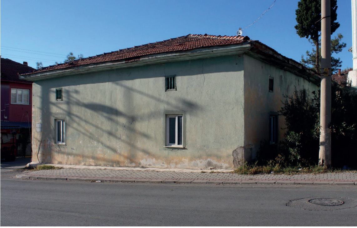
Görsel 10: Pamukkale/Akköy Yukarı Camii Güney ve Doğu Cephesi