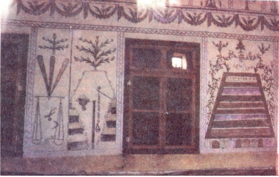
Görsel 17: Muğla/Fethiye Seki Tekke Camii (Arık 1988: 134)