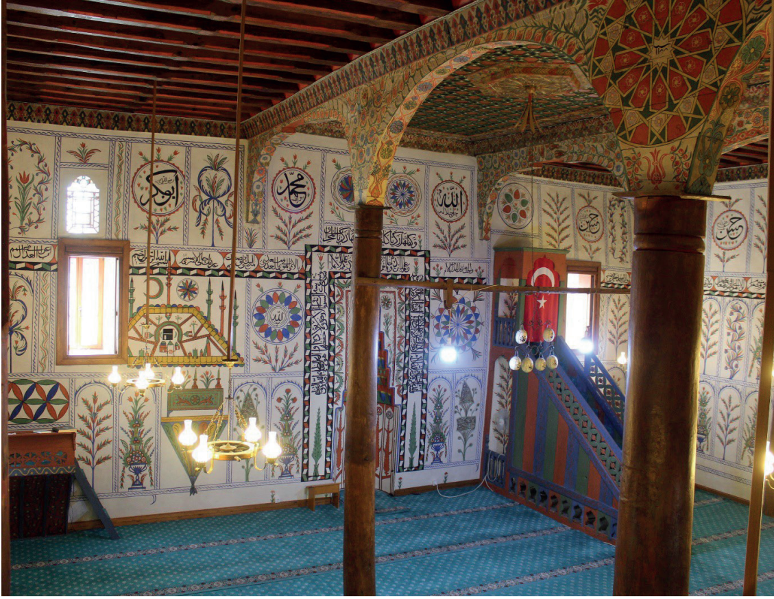
Görsel 4: Baklan/Boğaziçi Eski Camii Harimi

sarıklar, tüfekler, kılıç, heybe, mizan terazisi, cennet ve cehennem gibi sembolik tasvirler, yazılar yer almıştır (Görsel 4). Harimin duvarları ince bir sıvayla kaplanmış ve bu sıvanın üzerine resimler işlenmiştir (Çakmak 1995: 529-540; Beykal 1997: 73-90; Yurtsal 2009: 87-99; Şener 2011: 86-92; Dalkılıç 2023: 329- 390).