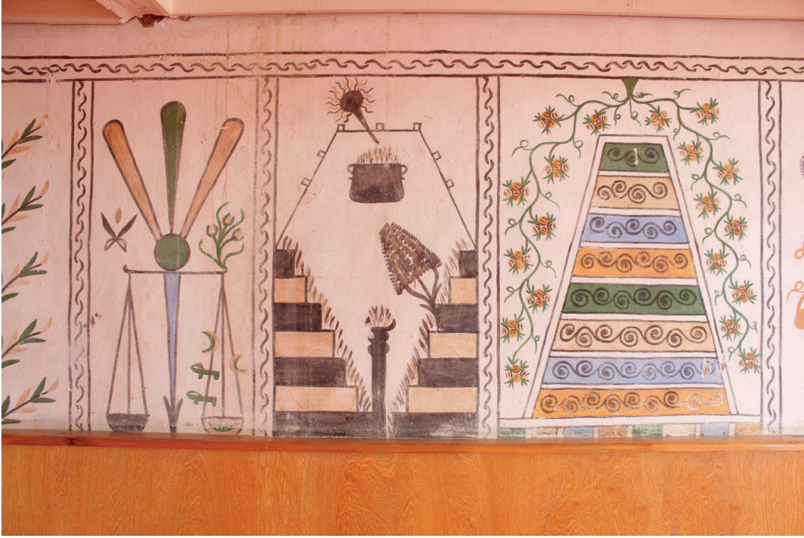
Görsel 16: Çivril/Bulgurlar Camii Mizan Terazisi, Cehennem ve Cennet Tasvirleri