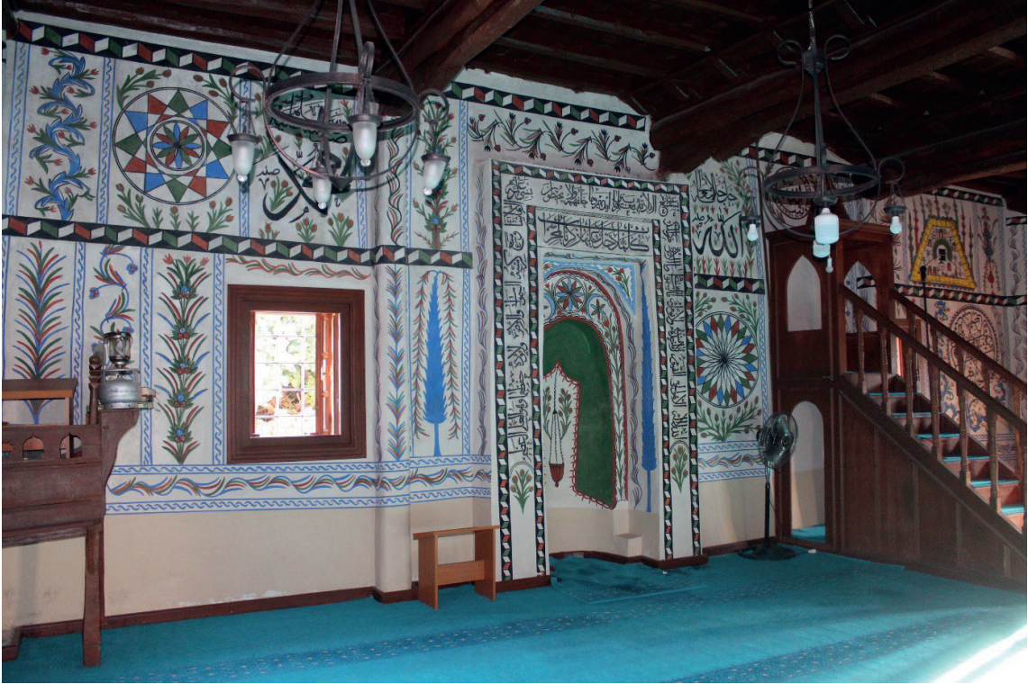
Görsel 8: Pamukkale/Belenardıç Camii Harimi

Kareye yakın dikdörtgen planlı harim, mihrap duvarına dik uzanan dört sahına ayrılmış, her sahin serbest ve duvara bağlı ahşap desteklerle taşınmıştır. Kuzeyinde önü açık, yanları kapalı son cemaat yeri bulunmaktadır. Kuzeybatıdaki minare yenilenmiştir. Harimde ve son cemaat yeri duvarlarında ağaçlara, vazodan ve ibrikten çıkan çiçeklere, çeşitli bitkisel motiflere, geometrik bezemelere, kandil ve perde motifine, kabe ve cami tasvirlerine, sancak, mızrak, teber, tesbih, sarık, tüfek, silah, heybe, mizan terazisi, cennet ve cehennem gibi değişik sembolik tasvirlere, yazılara yer verilmiştir (Görsel 8). Harimin duvarları ince bir sıvayla kaplanmış ve bu sıvanın üzerine duvar resimleri işlenmiştir (Çakmak 1994: 19-26; Yurtsal 2009: 115-120; Şener 2011: 98-102; Dalkılıç 2023: 2187-2227).