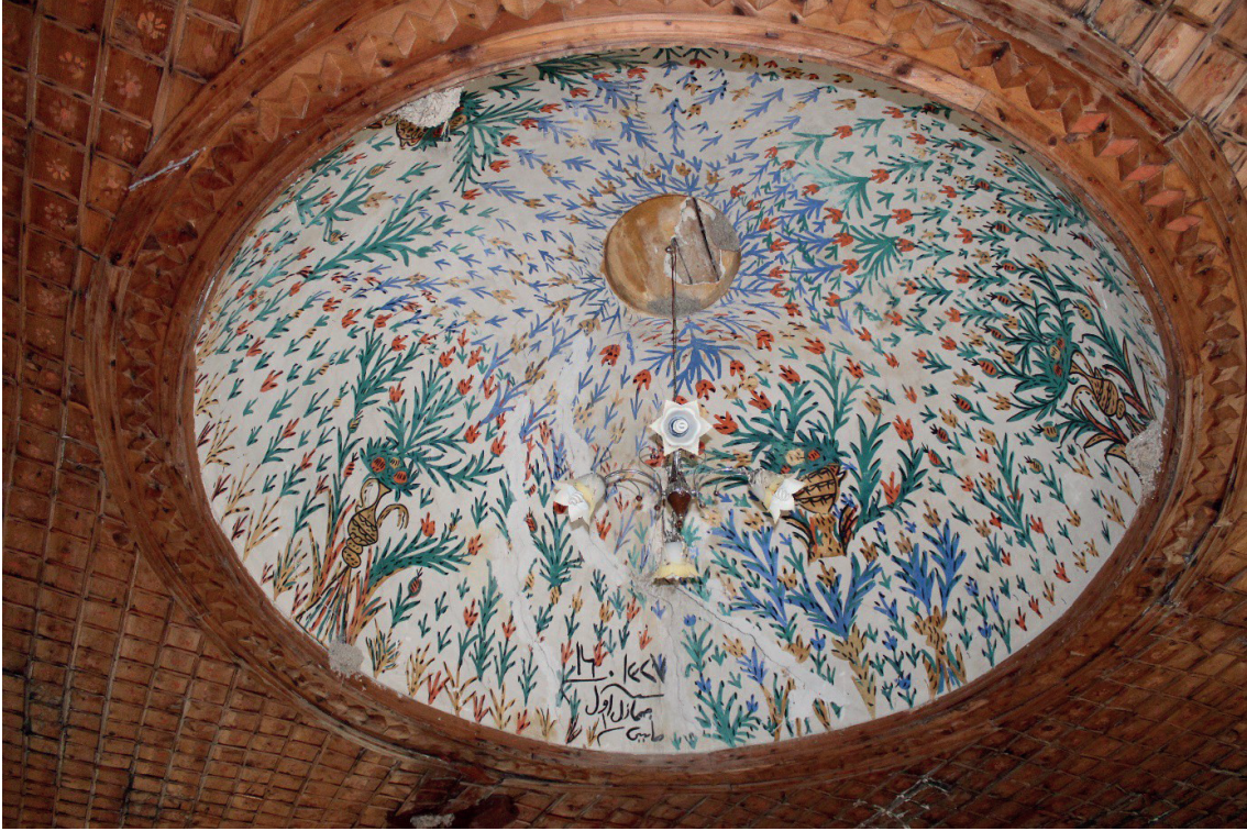
Görsel 11: Pamukkale/Akköy Yukarı Camii Küçük Kubbesi