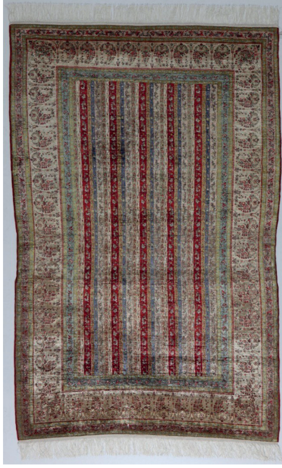
Görsel 16: İpek halı seccade. Env. No. 42/1300, Ölçü. 118 x 185 cm.