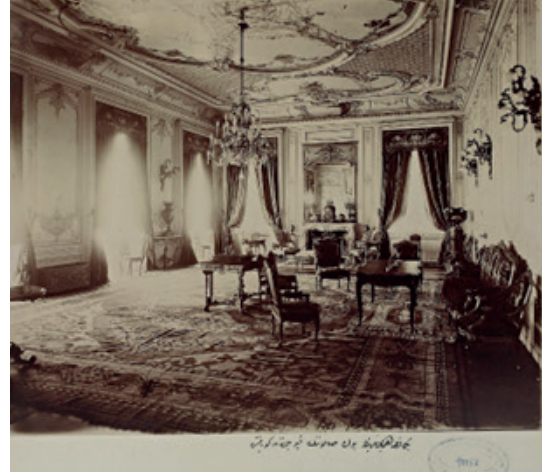
Görsel 12: Masa altında tespit edilen halı

Tarihi Görselğrafta Yıldız Sarayı'nda çalışma masası altında eş deseni görülen 11/1071 envanter numaralı seccade örneğinden Koleksiyonda ölçüleri birbirine çok yakın fakat yıpranmışlık ve kondisyon olarak farklı 11/1070, 42/1275 ve 42/1276 envanter numaralarına kayıtlı toplam dört adet halı seccade yer almaktadır. Kula yöresi seccadelerine benzemektedir. Madalyonlu ve çift mihraplı halı seccadenin atkı, çözüğü ve ilmek iplikleri ipektir. 60 x 60 (dm) dokuma kalitesindeki seccade de sentetik boyar maddeler kullanılmıştır. Seccade Hereke seccade, Türk düğümü tekniğinde dokunmuş seccadede ilmek ipliklerinin yanı sıra atkı-çözüğü iplikleri de ipektir. Koleksiyonda çift mihraplı ve madalyonlu tasarım özelliği gösteren az sayıdaki halı grubu arasında bulunmaktadır. İkişer birbirinin tekrarı dar, biri geniş bordürlü halıda stilize çiçek motifleri görülür. Geniş bordürde sıralı bir şekilde tekrarlanan taç yapraklardan çıkmış stilize karanfil motifleri yer almaktadır. İç içe iki mihraplı halıda dış mihrabın iki başı basamaklıdır. İçteki madalyon stilize motiflidir. Krem zeminde pembe serpmeye stilize yaprak motifleri tüm kenarları dolular. Bir köşesinde kartuş içerisinde Hereke damgası bulunmaktadır.