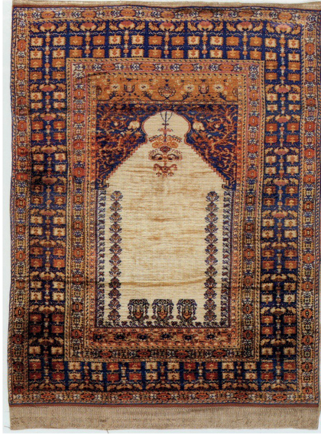
Görsel 13: İpek halı Seccade. Env. No. 7174, ölçü: 123 x 160 cm. Cumhurbaşkanlığı Koleksiyonu.

Milli Saraylar'ın dışında tespit edilen geleneksel desenlerde tasarlanarak, Gördes halılarında kullanılan motifler ile dokunmuş bir halı seccade ipek atkı ve ilmek iplikleri ile dokunmuştur. Halı seccadede damga bulunmamaktadır. Atatürk'ün terkesinden olan seccade tek mihraplıdır. 36 Mihraptan ilahi ışığı sembolize eden kandil sarkmaktadır. Sütunlu, stilize köşe dolgulu seccade bordür ve diğer motifleri ile Gördes halı seccadelerinin özelliğindedir. Bu halı seccadenin alışılmış olan geleneksel Gördes halılarından farkı, ipek iplikle ve yüksek kalitede dokunmuş olmasıdır. Bu özellikler geleneksel desende dokunmuş halılara Hereke'nin getirdiği yeniliklerdir.