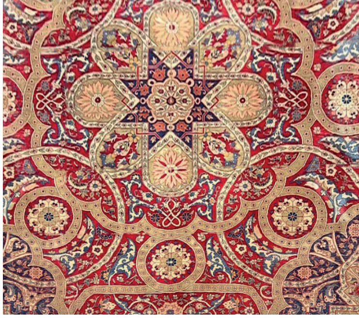
Görsel 20: Lahey Adalet Sarayı'na hediye edilen halıdan detay.