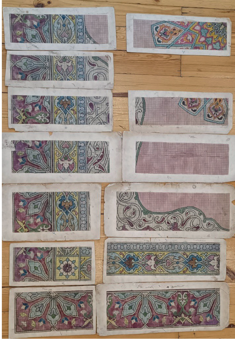
Görsel 19: Halı deseni çizim paftaları. Hereke İpekli Dokuma ve Halı Deseni Arşivi.

Görsel.19'da görülen halı deseni çiziminde merkezde tasarlanan madalyonda ve bordürlerde, Türk halı sanatında Selçukludan beri kullanılan geometrik düzenleme dikkat çeker. Geometrik düzenlemelere rumi kıvrımları eşlik eder. Çizimin zemin renginde Hereke halılarında bir dönem tercih edilmiş olan pembe renk kullanılmıştır. Zemin köşelerdeki tercih edilmiş olan rumi kıvrımlar ve bordürdeki kartuşlar Hereke Fabrika-i Hümayunu'nda dokunmuş olan saray halısı üslubundaki eserlerde klasikleşmiş bir tercih olmuştur.