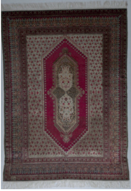
Görsel 11: İpek halı seccade. Env. No. 11/1071. Ölçü: 145 x 205 cm. http://nek.istanbul.edu.tr:4444/ekos/GÖRSELGRAF/90552-0014.jpg.