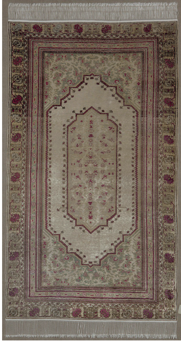
Görsel 4: İpek halı seccade. Env. No: 14/2821. Ölçü: 100 x 175 cm. (Milli Saraylar Görselgraf Atölyesi Arşivi)

Yöresel özellikte üretilmiş halı seccade, atkı, çözü ve ilmek ipliklerinin ipek olduğu, Milas yöresi özellikleri taşıyan bir örnektir. 60 x 60 (dm) dokuma kalitesi ile üretilmiş seccade, çift mihraplıdır. Hereke seccade, krem zemin üzerine açık yeşil ve pembe sentetik boyar maddelerin kullanıldığı ipek iplikler ile dokunmuş çift mihraplı bir örnektir. Milas seccadelerini hatırlatan eser, madalyonlu seccadeler grubuna girmektedir. Geniş bordür krem zemin üzerinde siyah konturlu açık yeşil ve pembe renklerin kullanıldığı stilize edilmiş alternatif yaprak ve ağaç motiflidir. Orta zemin iç içe yerleştirilmiş simetrik mihrap şeklindedir. Sol alt bölümünde kartuş içerisinde Hereke yazısı okunmaktadır.