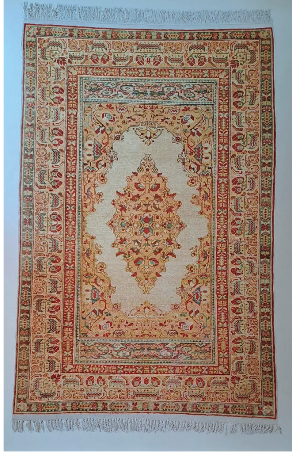
Görsel 5: Yün halı seccade. Env. No: 11/1028, Ölçü: 130 x 195 cm.

Anadolu desenlerinde dokunmuştur. Halı seccadenin atkı ve çözgü iplikleri pamuk, ilmekler ise sentetik boyarmaddeler ile boyanmış yün ipliklerden oluşmaktadır. 45 x 45 (dm) kalitede, Türk düğümü ile dokunmuştur. Madalyonlu seccadenin ana zemini sarı renklidir. Dışta yeşil içte kırmızı ince bordür arasında kalan geniş bordür sarı zemin üzerine stilize edilmiş yaprak ve çiçek desenlidir. Oval madalyon, köşe dolguları, ayetlik ve tabanlık bölümleri de aynı stil motiflerle dolgulanmıştır. Bu halı önceki çalışmamızda Sivas olarak geçse de doku, iplik, renk ve kalite olarak incelendiğinde Hereke olduğu tespit edilmiştir. 34