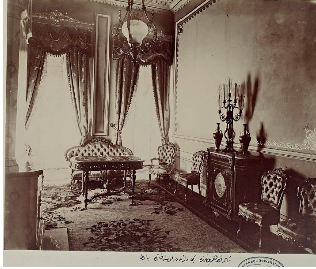
Görsel 15: “Şale kasrı Hümayunlarının üst katında bir oda.”, Yıldız Şale 6 numaralı oda. Erişim Tarihi 19.12.2024 http://nek.istanbul.edu.tr:4444/ekos/GÖRSELGRAF/90552---0059.jpg

Tarihi Görselgraflarda tespit edilen Uşak halı özelliğinde dokunmuş Hereke halı odanın ölçüsüne göre yapılmıştır. Sultan II. Abdülhamid (1876-1909) döneminde yüksek kapasitede halı üreten Hereke Fabrikâ-î Hümayûnu'nda üretilmiş halılardan çok sayıdaki örneğin Yıldız Sarayı'nda çok rağbet gördüğü ve tercih edildiği anlaşılmaktadır. Koleksiyonda korunmakta olan halı günümüzde Beylerbeyi Sarayı'nda sergilenmektedir. Halının atkı, çözü ve ilmek iplikleri yündür. Krem, kırmızı, sarı zeminli ince bordürler arasında mavi zeminli genişbordür yer alır. İnce bordürler krem, mavi ve pembe ile su şeklinde dal ve çiçek motifleriyle süslüdür. Geniş bordür sarının tonlarıyla iri hatları ve aralarda bir dal üzerinde yer alan küçük çiçek motifleriyle alternatif olarak yerleştirilmiştir Hatayi, stilize yaprak ve kandil motiflidir.