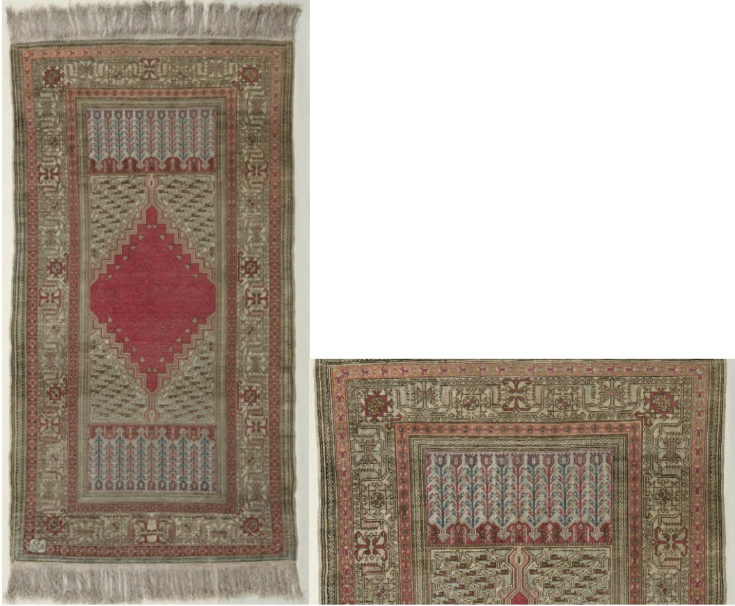
Görsel 2: İpek halı seccade. Env. No:14/2629, Ölçü: 100 x 184 cm.

Geleneksel desen ve motiflerin kullanıldığı seccadede atkı, çözü ve ilmek iplikleri ipektir. 19. yüzyılda bilindiği üzere geleneksel Türk halılarında kullanılan doğal boyalar yerine sanayileşme ile birlikte büyük oranda sentetik boyar maddeler tercih edilmiştir. Çift mihraplı seccade Ladik yöresi halı özellikleri göstermektedir. 60 x 60 (dm) 32 dokuma kalitesi ile Hereke'nin yüksek dokuma özelliğini yansıtır. Seccadenin mihrap altı ve üzerindeki stilize lale motifleri Ladik seccadelerinde karakteristiktir. Bu seccadelerde mihrap tek veya üç nişli tasarlanmaktadır. Ayetlik ve tabanlıklarda stilize lale motifleri bulunur. Seccadenin zemini koyu pembe renkli, basamaklı ve çift mihraplıdır. Mihrap köşelerinde kalan üçgenler geometrik ve bitkisel motiflerle doldurulmuştur. Krem zeminli geniş bordürü, geometrik ve bitkisel bezemeli ince bordürler çevrelemektedir. Halı Hereke damgalıdır.