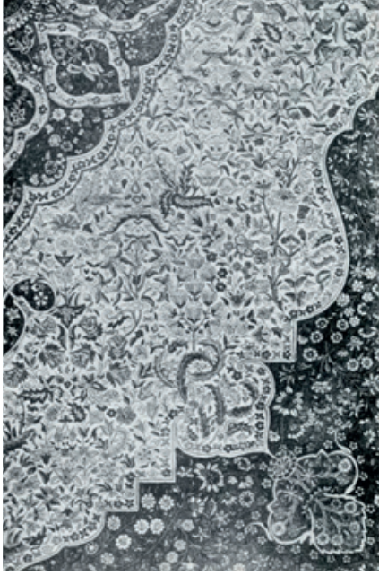
Görsel 12: Osmanlı Ressamlar Cemiyeti Gazetesi. Sayı 17.