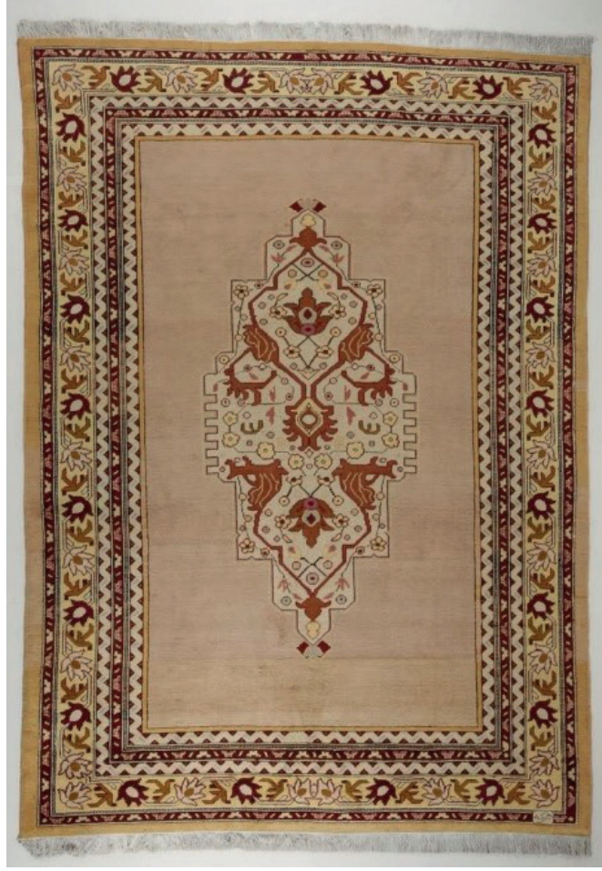
Görsel 8: Yün halı, Env. No:12/1297. Ölçü: 295 x 460 cm.

Halı şeması, bordür motifleri, madalyon tasarımı, stilize motifleri ile Uşak halısı özelliği göstermektedir. Hereke halının atkı ve çözgü iplikleri pamuk ilmek iplikleri ise Türk düğümü tekniğinde atılmış yün ipliktir. Halıyı en dışta düz sarı renkli bir etlik dolanmaktadır. Etlik kısmından sonra kırmızı zeminli soyut yaprak çiçekli ince bir bordür; sarı zeminli ve bir ters bir düz yerleştirilmiş kırmızı ve sarı renkli hatai ve stilize yaprak süslemeli geniş bordür bulunmaktadır. Geniş bordürü kesintisiz olarak devam eden S kıvrımlı ince bordür; kırmızı zeminli ince bordürün tekrarı ve yine S kıvrımlı bordür çevreler. Halının ana zemini düz açık pembe. Zemine oval yerleştirilmiş madalyon stilize edilmiş yaprak, rumi ve hatai motiflidir. Halının bir köşesi Hereke yazılıdır.