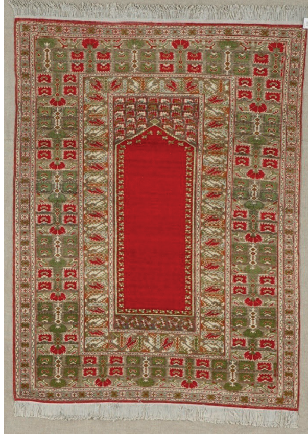
Görsel 3: Yün halı seccade. Env. No:13/78. Ölçü: 110 x 144 cm. (Milli Saraylar Görselgraf Atölyesi Arşivi)

Yöresel özellikler gösteren eserler arasında görülen halı seccade Gördes yöresi desen özellikleri göstermektedir. 33 Tek mihraplı seccadenin dokunmasında sentetik boyar maddeler ile boyanmış yün ilmek iplikleri kullanılmıştır. Atkı ve çözgü iplikleri ise pamuktur. 80 x 80'lik yüksek dokuma kalitesi ile dikkat çeker. Halının bordür desenleri ve köşe dolguları Gördes yöresi desen özelliklerini vermektedir. Tek mihraplı seccadenin ana zemini düz parlak kırmızı renklidir. Mihrabı, içte çepeçevre stilize bitki çiçekli ince dal çevreler. Tek mihraplı seccadenin dar bir tabanlık bölümü bulunmaktadır. Geniş ve ince bordürleri sütlü kahverengi zeminli ve stilize yaprak desenlidir.