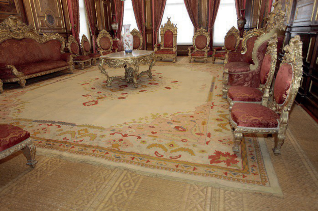
Görsel 7: Yün halı. Env. No. 3/794. Ölçü:625 x 750 cm. (Milli Saraylar Görselğraf Atölyesi Arşivi)

Günümüzde Beylerbeyi Sarayı'nda sergilenen yöresel motifler ile dokunmuş Hereke taban halısıdır. Beylerbeyi Sarayı 26 numaralı odada sergilenmektedir. Uşak halısı özelliğindedir. Halının atkı, çözgü ve ilmek iplikleri yündür. Gördes düğüm tekniği ile dokunmuştur. Dıştan içe sarı, mavi, pembe, koyu sarı zeminli su şeklinde desenli ince bordürleri vardır. Geniş bordür açık yeşil zeminde sarı tırtıklı yaprak, pembe şakayık çiçekleri ile süslüdür. Köşe dolguları pembe zeminde stilize lale, küçük çiçek ve dilimli kenarlı uzun yaprak motifleriyle bezenmiştir. Halının ana zemini krem renklidir. Ortada oval formlu madalyon yer alır. Madalyonun baklava şeklinde tepeliği vardır. Açık yeşil zeminli madalyon sarı yaprak, kırmızı ve koyu sarı iri soyut çiçeklerle süslüdür. Madalyon mavi ve pembe çizgilerle konturlanmıştır. Ayrıca madalyonu dıştan çevreleyen çiçek ve yaprak motifleri görülür.