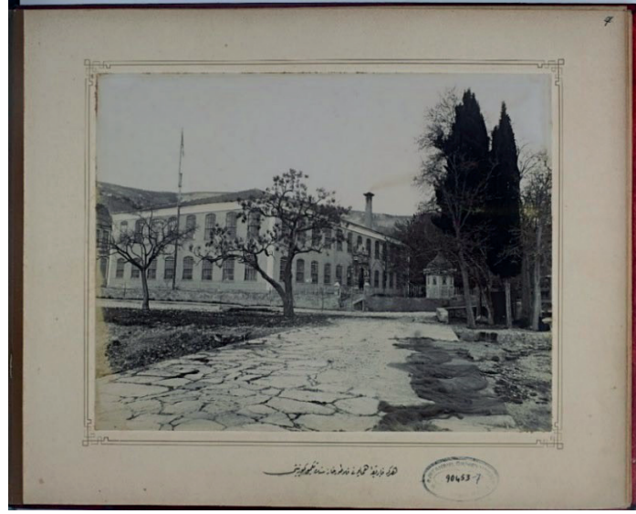
Görsel 1: Hereke Fabrikâ-i Hümayûnu. Halıhane.

Hereke Fabrikası Osmanlı ve Cumhuriyet döneminde tarihte rol oynamış önemli diplomatik konukları ağırlamıştır. Bunlar içerisinde Alman İmparatoru Kaiser II. Wilhelm de yer alır. Alman İmparatoru'nun 1898'de Hereke Fabrikasını ziyareti nedeniyle deniz kenarında inşa edilmiş köşk ahşap konstrüksiyonludur. 14 1894 yılında Mısır Hıdivi Abbas Hilmi Paşa'nın annesinin Hereke Fabrikâ-i Hümayûnu'nda ağırlandığı ve kendisi için bir ziyafet verildiği arşiv belgelerinden öğrenilmektedir. 15 Fabrika'da dokunan ürünler ziyarete gelen yabancı konuklara verilen diplomatik hediyeler arasında yer almıştır.