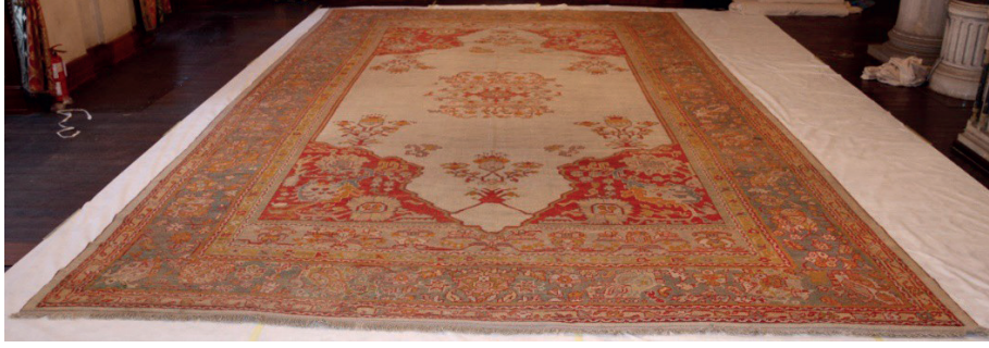
Görsel 14: Yün halı. Env. No. 4/369. Ölçü.460 x 745 cm. Milli Saraylar Görselgraf Atölyesi Arşivi.