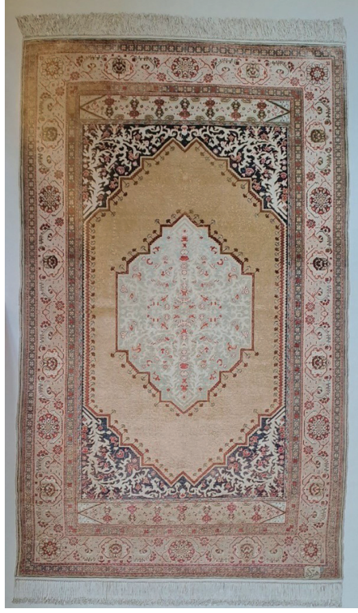
Görsel 6: İpek halı seccade. Env. No: 13/291. Ölçü. 116 x 194 cm.

Stilize desenli çift mihraplı seccade geleneksel motifler ile tasarlanmıştır. Köşe dolguları nefsi yeşil üzerinde krem rengi stilize kıvrım dallarla dolguludur. Bu kıvrımlı dallı köşe dolguları Gördes seccadelerin karakteristiğidir. Halı seccade 70 x 70 (dm) dokuma kalitesindedir. Atkı iplikleri ipek, çözgü iplikleri pamuk, ilmek iplikleri sentetik boyar maddelerle boyanmış ipek ipliklidir. Türk düğümü kullanılmıştır. Aynı zamanda madalyonlu seccadeler grubuna girmektedir. Simetrik kompozisyonludur. Halı seccadenin ayetlik ve tabanlık bölümleri bulunmaktadır. İki ince bordür arasında yer alan geniş bordür krem zemin üzerine stilize edilmiş gül motifidir. İç içe iki mihraplıdır. Gül ve hatailer S kıvrımı çizen hat arasında alternatif olarak sıralanır. Hereke damgalıdır.