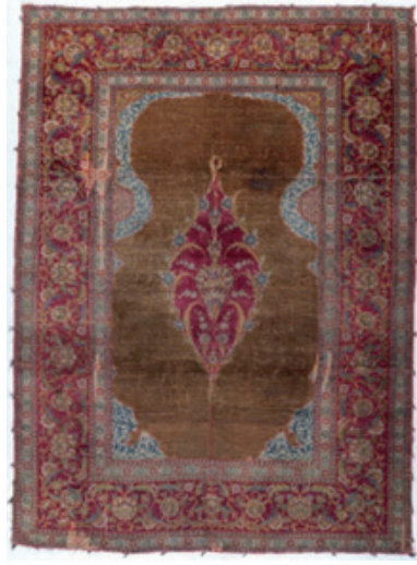
Görsel 9: Hereke Seccade 140 x 180 cm. Env. No: 13/794. (Milli Saraylar Görselgraf Atölyesi Arşivi) Görsel 10: Topkapı Sarayı'nda yer alan halı seccade.17.yy. Env. No: 13/2037 (Suat ALKAN 2024)

Bu saray halısı örneğinde Bergama yöresinde kullanılan küçük rozetlerle çevrili büyük bir madalyondan oluşan kompozisyon düzenlemesi görülmektedir. Bu motifler bazı Batı Anadolu 35 özellikle de Bergama ve Manisa halılarında görülen madalyon deseniyle büyük benzerlikler göstermektedir. Halıda saray halısı geleneği ve yöresel motifler bir arada görülmektedir. Halıyı bu yönü de ilginç kılar. Eser, 17. yüzyıldaki saray halısı geleneğini 19. yüzyılda yaşatmıştır. Halının birebir eşi Topkapı Sarayı'nda yer almaktadır. Eser I. Ahmet için dokunmuştur. 17. yüzyılda dokunmuş ve Topkapı Sarayı'nda muhafaza edilen eserin Hereke Fabrikâ-î Hümâyûnu'nda kopyası dokunmuştur. Topkapı Sarayı'nda muhafaza edilen önemli eserlerden kopya üretim yapılmıştır. Seccade. Seccade ipek ve yün karışık malzeme ile dokunmuş madalyonlu ve tek mihraplıdır. Atkı ve çözgüler ipek, ilmekler yün iplikle atılmıştır. Seccadedeki ana renkler sentetik ve doğal karışık malzemeler ile boyanmış sarı (solmuş olması nedeniyle krem görülmektedir) ve bordo renktedir. Halı seccadenin üçer ince bordürleri arasında bordo zemin üzerine hatai ve hançer yaprağı desenli geniş bordürü yer alır. Mihrap kemeri oldukça geniş ele alınmıştır. Oval formulu madalyonda hatai ve tepe kısmında lale motifi yer alır. Halının bir köşesinde kartuş içerisinde Hereke yazısı okunmaktadır.