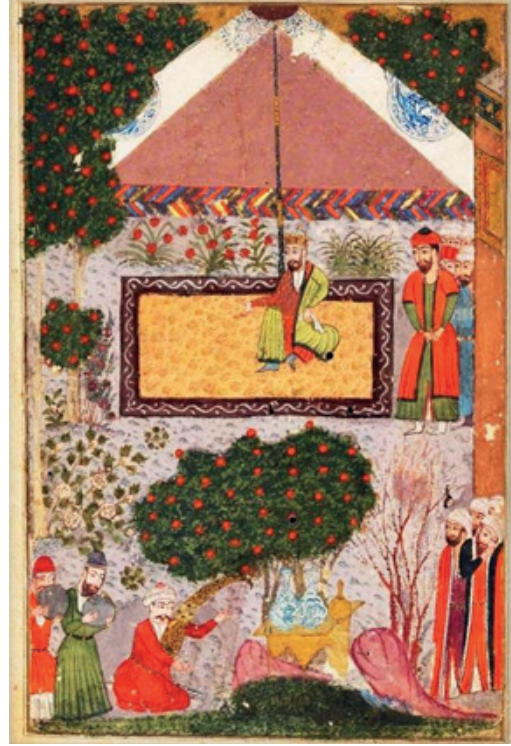
Görsel 4: İbrahim Sultan'a Takdim Sayfası, İbrahim Sultan Şehnâme'si, Bodleian Library, Ouseley Add. 176, fol. 12a.