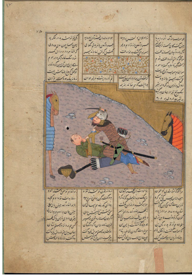
Görsel 16: Rüstem'in Suhab'ı Öldürmesi, İbrahim Sultan Şehnâme'si, Bodleian Library, Ouseley Add. 176, fol. 92a.

Gerek üslup benzerlikleri gerekse kompozisyon kurguları karşılaştırıldığında üzerinde çalışılan eserin İbrahim Sultan dönemi kitap sanatları geleneklerini yansıttığı görülmektedir. Eserin minyatürlerinin de 15. yüzyılın ilk yarısında Şiraz'da hazırlanan yazmaların minyatürleri ile bir üslup birliği gösterdiği de anlaşılmaktadır. İbrahim Sultan dönemi minyatürleri Celâyiri dönemi ile Türkmen Karakoyunlu-Akkoyunlu dönemleri minyatürleri arasında bir köprü görevi de görmüştür. Celâyiri üslubunun devamını sağlamış, Türkmen dönemine etki ederek de yeni bir üslubun doğuşuna katkıda bulunmuştur.