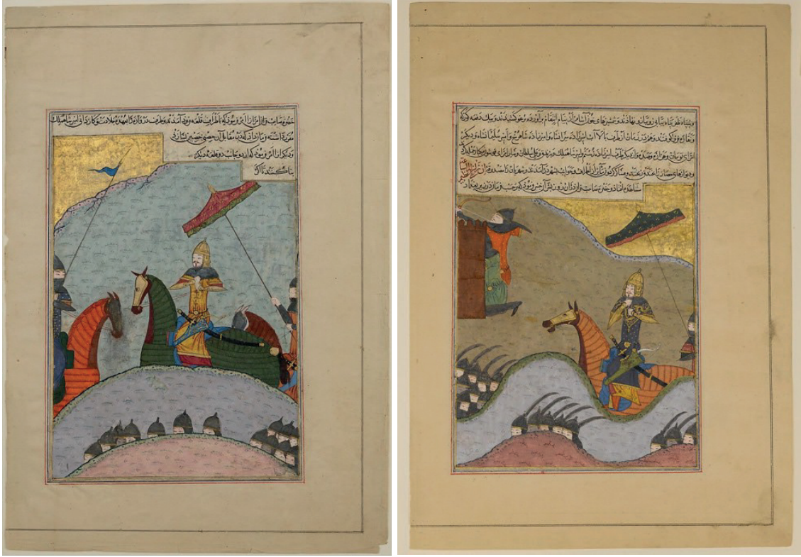
Görsel 7: Timur'un Gortin Kalesi'ni Kuşatması, Zafernâme, Şiraz, 1436, Metropolitan Museum, Rogers Fund, 1955, 55.121.16.