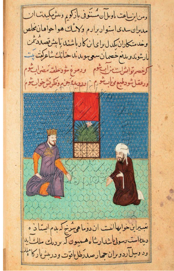
Görsel 14: Padişah Hilâr ile Veziri Bilâr, Kelile ve Dimne, SK, F. 3682, y. 420a.

Minyatürlerdeki figür tiplerinde de yine bir üslup birliği ile seçilmektedir (Görsel 9, Görsel 10, Görsel 12, Görsel 13, Görsel 14, Görsel 15) Bu insan figürleri incelendiğinde, birbirleri ile oldukça benzer oldukları görülür. Erkek figürlerin sakal ve bıyık şekilleri aynıdır, siyah iri gözlere, yay şeklinde kaşlara sahiptirler, genellikle ince ve uzun bir şekilde resmedilmişlerdir. Figürlerdeki jestler de içinde buldukları ruh halini yansıtacak şekildedir. Bu şekilde figürlerin duygu ve düşüncelerinin verilerek yansıtılması, minyatürlere bir canlılık kazandırmıştır. Üzerlerindeki kıyafetler, kadınların başlarına taktıkları başlıklar ve sarıklar da birbirleriyle hemen hemen aynı formlardadır. Minyatürlerdeki canlı renkler, özellikle figürlerin kıyafetlerinde seçilmektedir.