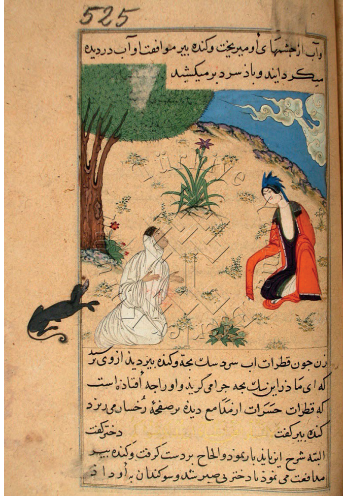
Görsel 15: Ağlayan Köpek ile Genç Kadını İkna Etmeye Çalışan Kocakarı, Sindbâdnâme, SK, F. 3682, y. 525a.

Çalışmanın konusu olan İbrahim Sultan Antolojisi (F. 3682) minyatürleriyle benzer özellikler gösteren minyatürler, İbrahim Sultan döneminde üretildiği tespit edilen Berlin Antolojisi (MS. I.4628), İbrahim Sultan Şehnemesi (Bodleian Library, Ouseley Add. 176) ve sayfaları dağılmış durumda olan Zafernâme minyatürlerinde de yer almaktadır. Söz konusu eserlerin hepsi İbrahim Sultan'ın Şiraz valisi olduğu dönemde Şiraz'da ortaya konulmuşlardır.