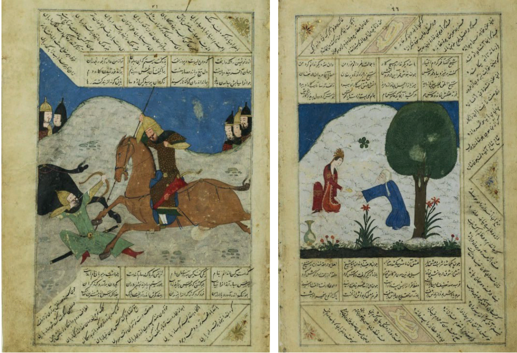
Görsel 2: Rüstem ve Afrasiyab'ın Mücadelesi, Firdevsî, Şehnâme, Şiraz, 1420 (Berlin, Museum für Islamische Kunst, MS.I.4628, y.21.

bunun devam etmesi eserin Şiraz'da yapıldığını kanıtlar niteliktedir. Bu dönemde ortaya konulan yazmalardaki yalın manzaralar, kompozisyon kurgusu ve üslup özellikleri bu eserde biraz daha dekoratif bir hal almıştır. Eser Firdevsî'nin Şehnâme'si, Ferideddin Attar'ın Mantık el-Tayr'ı ile Nizamî, Hâcû Kirmânî ve Emir Hüsrev Dehlevî'nin şiirlerinden bazı bölümleri içermektedir (İnal 1995: 134).