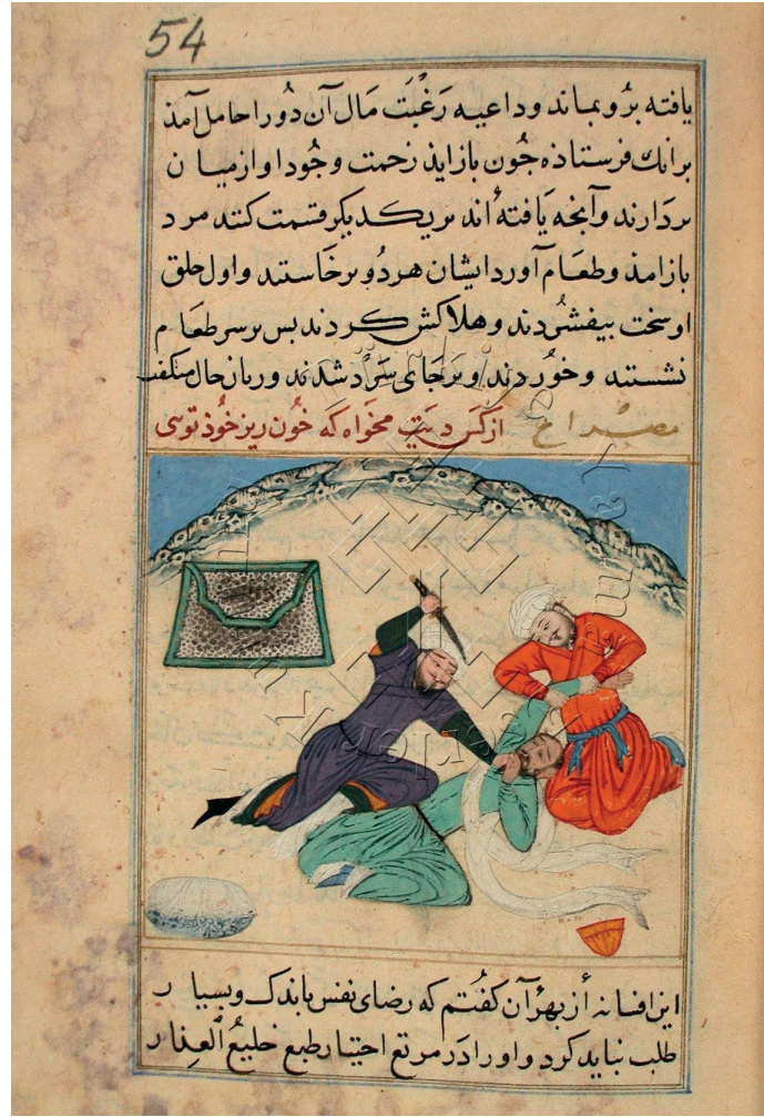
Görsel 10: Üç Haramiden İkisinin Diğerini Bıçaklaması, Marzubannâme, SK, F. 3682, y. 54a.

yeşil renkli karolar ile kaplanmıştı. Resmin ortasında bulunan kapı açıklığına uzun dalları olan ve çiçek açmış bir ağaç motifi yerleştirilmiştir. Beyaz bir kıyafet giymekte olan kadın, iki elini yukarı kaldırarak açmış, Dahhâk'a yakınlarından birini bağışlaması için yalvarır pozisyonda tasvir edilmiştir, kafası da yana doğru eğiktir. Arkasında duran iki erkek figüründen daha kısadır. Aynı altıgen karolar arka fonda yer alan duvarda da yarıya kadar yerleştirilmiştir, duvardakiler lacivert renklidir. Duvardaki bu karoların bittiği kısımda önce ince yeşil bir şerit, onun üzerinde ise genişçe bir bordür sırası yer almaktadır. Ortada yer alan açıklıkta, ağacın bittiği kısma kadar yeşil renkli bir perde sarkmaktadır. Açıklıktan gözüken gökyüzü koyu mavi olarak boyanmıştır. Duvarın beyaz olarak bırakılmış bölümlerine ise bazı yazılar yazılmıştır.