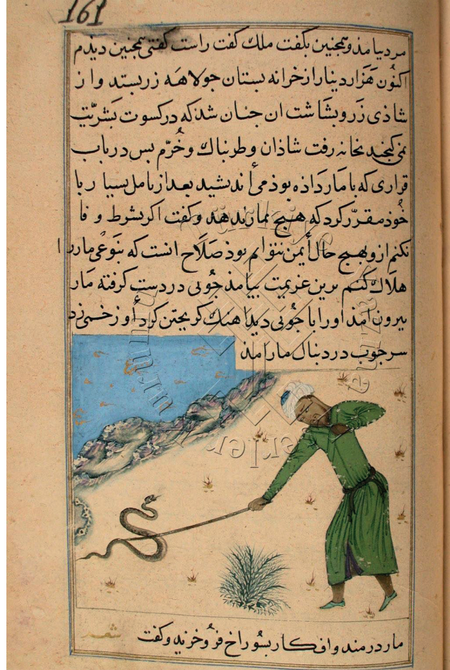
Görsel 12: Emîr Cülehâ'nın Yılanı Sopayla Öldürmesi, Marzubannâme, SK, F. 3682, y. 161a.

Emîr Cülehâ'nın Yılanı Sopayla Öldürmesi minyatürünün (Görsel 12) metinde anlatılan hikâyeye göre büyük bir yılan, bir dağın eteğinde kıvrılmış olarak yatmaktadır. Bu sırada bir yılancılın kendisine doğru geldiğini görür. Kendi kendine: “Eğer kaçarsam kurtulamam, deliğe girersem de çıkacak yolumu kapatacaktır. En iyisi ölü gibi durayım da belki beni bırakıp gider” diye düşünür. Yılanın bu şekilde yerde yattığını gören yılancıl da: “Eğer canlıysa kendisini alırım, ölüyse de mühresini çıkarırım, bir süre onunla geçinirim” diye içinden geçirir. Yılan, yılancılın gitmediğini ve kendisine yaklaştığını anlayınca: “Benden vazgeçmeyecek, eğer mühremi almak istiyorsa beni kesin öldürür, o beni öldürmeden ben ona bir darbe vurayım da kurtulma ihtimalim olsun” der ve yılancıl mühreyi almak için elini uzatınca, yılan ağır bir darbe indirir ve hemen yuvasına kaçar. Hikâyede verilmek istenen nasihat düşmanlar bir zarar vermeden önce kişinin kendisini korumak için elinden geleni yapmasının gerektiğidir. Minyatürde, yılancılın elindeki sopa ile yılanı vurduğu an tasvir edilmiştir. Üzerinde yeşil bir kıyafet ve başında beyaz bir başlık bulunan figür yılanı doğru hafif eğilmiş bir pozisyondadır. Vurduğu sopa yılanın kuyruk kısmına denk gelmiştir. Yerde bulunan yılan ise kendisini kurtarıp kaçmak için ve karşısındakine zarar vermek için başını havaya doğru kaldırmıştır. İki figürün arasına bir bitki kümesi yerleştirilmiştir. Konunun dışında başka hiçbir detay yoktur.