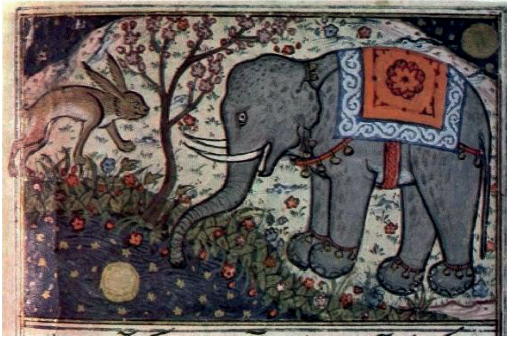
Görsel 1: Tavşan ile Fil, Kelile ve Dimne, TSMK, R. 1023, 102v (İnal 1995).

İbrahim Sultan döneminde hazırlanan eserlerdeki minyatürlerin Muzafferî üslubu ile ilişkisi, bugün Topkapı Sarayı Müzesi Kütüphanesi'nde (TSMK, R.1023) bulunan ve H. 816 (M. 1413) tarihinde hattat Yûsuf Amiri tarafından yazılan ve İskender-İbrahim Sultan iktidarlarının değiştiği dönemde yapıldığı düşünülen bir Kelile ve Dimne yazması minyatürleri ile açıklanmıştır. Eserdeki minyatürler üslup olarak kendinden önceki Şiraz-Muzafferî dönemi minyatürleri ile büyük benzerlik gösterir. Bu benzerlik iki önemli konuyu açıklığa kavuşturur. Buna göre de İskender Sultan hem Celâyirli Tebriz geleneğinde ustalara patronluk etmektedir hem de Şiraz'ın eski geleneğinde Görselyapan yerli nakkaşlara da sipariş vermektedir. Yazmada karşımıza çıkan küçük boyutlu minyatürlerdeki dikkat çeken en önemli özellik sadeliktir. Moğol tipinde insanların da yer aldığı yazmanın nakkaşı İlhanlı geleneğini eski Şiraz geleneği ile bağdaştıran örnekler ortaya koymuştur. Tavşan ve fili tasvir eden (Görsel1) sahnede doğa motiflerinin biraz daha zengin bir biçimde İlhanlı üslubunu hatırlattığı görülür. Bunlarda serbest fırça darbeleri bitkiler ve çiçekler göze çarpar. (İnal 1995: 132-133).