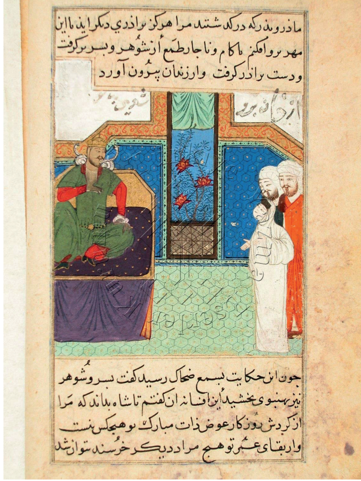
Görsel 9: Hanbevî, Dahhâk'ın Huzurunda, Marzubannâme, SK, F. 3682, y. 13b.

Yazmada resimlenmiş olan Hanbevî'yi Dahhâk'ın Huzurunda tasvir eden (Görsel 9) hikâyenin ana konusu; kardeşin, diğer yakınlarla tercih edilmesidir. Dahhâk, oldukça zalim bir hükümdardır. İki omzunda beslediği iki yılan her gün iki insanın beynini yem olarak vermektedir. Bir gün Hanbevî isimli kadının eşi, çocuğu ve kardeşi bu amaç için Dahhâk'a götürülür. Kadın bu duruma feryat eder ve Dahhâk'tan, birini kendisi için bağışlamasını ister. Hükümdar kadının durumuna acıyarak, kardeşi, çocuğu ve eşinden birisini kendisinin tercih etmesini, seçtiği kişiyi serbest bırakacağını söyler. Kadın durumu düşündükten sonra kardeşinin kurtarılmasını tercih eder. Dahhâk, kadının bu tercihinin şaşırarak sebebini sorar. Kadın da annesinin ve babasının öldüğünü, bu nedenle tekrar kardeş sahibi olmasının mümkün olmadığını fakat yeniden evlenir ise eş ve çocuk sahibi olabileceğini, onların sevinciyle üzüntülerini unutabileceğini söyler. Hükümdar Dahhâk, kadının bu düşüncesini beğenir ve kardeşi ile birlikte eşi ve çocuğunu da bağışlar.