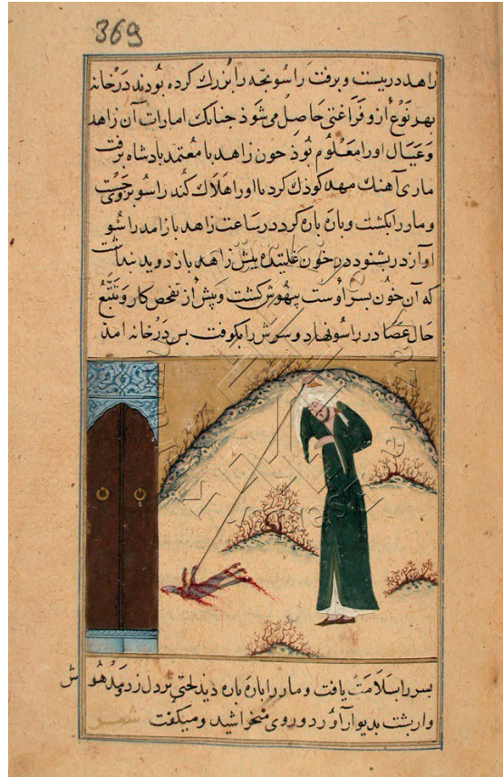
Görsel 13: Sopayla Suçsuz Kedisini Öldüren Zahid, Kelile ve Dimne, SK, F. 3682, y. 369a.

Eserdeki minyatürlerin ortak bir üslubu yansıttığı anlaşılmaktadır. Minyatürler metinlerde anlatılan olayların görsel bir yansımasıdır ve bir üslup birliği içinde ele alınmışlardır. Bu üslubun özelliklerine bakıldığında ilk dikkat çeken solgun tonlarda boyanmış zeminler ve yüksek tutulmuş ufuk çizgisi olur. Bunu Marzubannâme ile aynı eserde yer alan Kelile ve Dimne'deki minyatürlerde de çok net bir şekilde görmek mümkün olabilmektedir. (Görsel 10, Görsel 11, Görsel 12, Görsel 13). Bu zeminin üzerinde mutlaka bir doğa unsuru bulunmaktadır. Bu doğa unsurları genellikle kümeler halinde çizilmiş olan küçük çiçeklerdir ve bu çiçekler kırmızı, mor, beyaz, mavi ve yeşilin tonlarında boyanmışlardır. Çiçeksiz olarak yerleştirilmiş düz bitkiler de yer almaktadır.