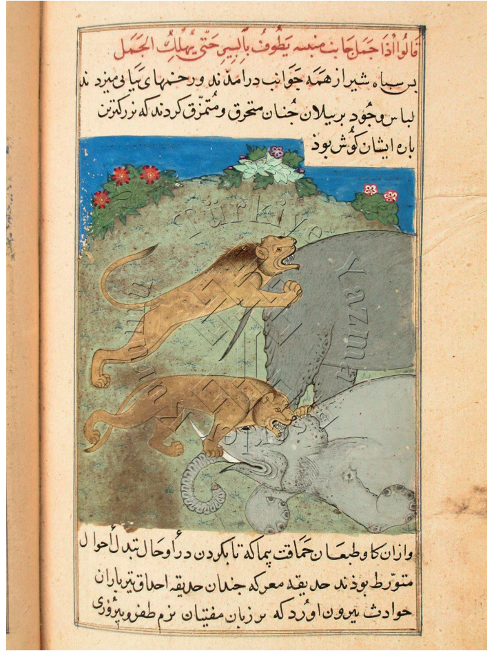
Görsel 11: İki Aslanın, İki File Saldırması, Marzubannâme, SK, F. 3682, y. 153b.

ikisi ona saldırırlar ve nihayetinde de bıçaklayarak arkadaşlarını öldürürler. Onu öldürdükten sonra içinde zehir bulunan yemekleri yiyerek kendileri de ölürler. Eserde bu olayın anlatılış sebebi olarak, nefse boyun eğmenin doğru bir davranış olmadığını göstermek olduğu söylenmektedir. Minyatürde, tam iki haraminin birleşerek diğer üçüncü haramiyi bıçakladıkları an ele alınmıştır. Haramilerden biri bıçaklanan kişinin baş tarafındadır ve iki eli ile yerdekinin kolunu kavramış durumdadır. Diğer harimi ise elindeki bıçağı havaya kaldırmış, yerde yatan haramiyi bıçaklamak üzeredir. Bir eli ile de adamın elini tutmaktadır. Bıçaklanan haraminin başındaki başlığı olayın hareketini vermek istercesine yere düşmüş vaziyettedir, başındaki sarık da çözülmüştür, yüzündeki korku ifadesi çok net anlaşılmaktadır. Yere düşen şapkanın karşısında ise getirdiği zehirli yemeklerin yer aldığı sepet göze çarpmaktadır. Üçünün de kıyafetleri farklı ve canlı renkler ile boyanmıştır. Oldukça sade bir sahnedir, mekânın neresi olduğu tam anlaşılamamaktadır. Arka fonda bu dönem resimlerinde çoğunlukla görülen oval bir tepe vardır. Gökyüzü maviye boyanmıştır. Yüzlerde kullanılan jestler de dikkat çekicidir.