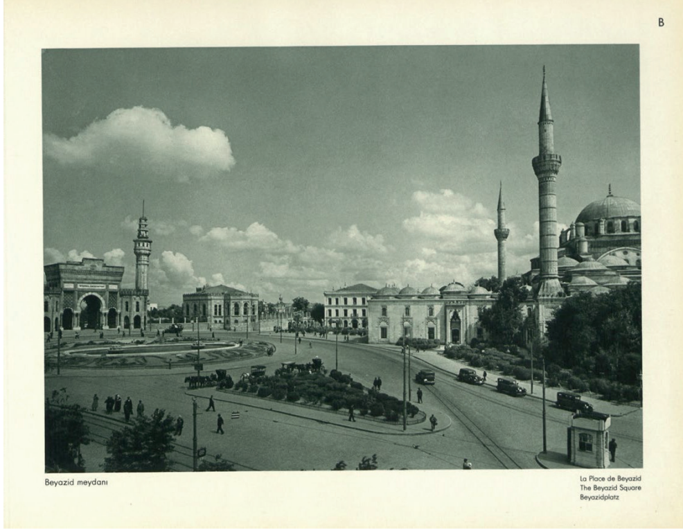
Görsel 10: “Beyazid Meydanı” (Fotoğrafla Türkiye).

“ Moda Koyu ” isimli imajda Moda Deniz Kulübü binası ile dönemin kent kültürünün ürünü Park (Koço) Lokantası görülmektedir. Her yıl düzenlenen kürek, yelken, yüzme gibi deniz sporları yarışlarından birinin görüldüğü “Yeni Türkiye’nin İstanbulu’nun modern yüzü” deniz, kayıklar, yelkenliler fotoğraflanmıştır. Aya Ekaterini Ayazması üzerindeki Park (Koço) Lokantası ile 1900’lerin başında kayıkhanesi olarak kullanılan (Atun Atlı 2019: 176) Moda Yat Kulübü binası semtte spora dayalı bir kamusal alan oluşturmaktadır. 10 Temmuz 1935 tarihli “ Moda Yat Kulübü Açıldı ” başlıklı Zaman Gazetesi’nde (s. 1), Atatürk’ün himaye ettiği belirtilen kulübün açılışı duyurulmuş, yapıyla Cumhuriyet gençliğinin deniz sporlarında kendini geliştireceği belirtilmiştir. 7 Temmuz 1935 tarihli “ Deniz Yarışları Çok Muhteşem Oldu ” başlıklı Tan Gazetesi’nde (s. 6), kulüpte düzenlenen yarışmalara dair fotoğraflar paylaşılmıştır.