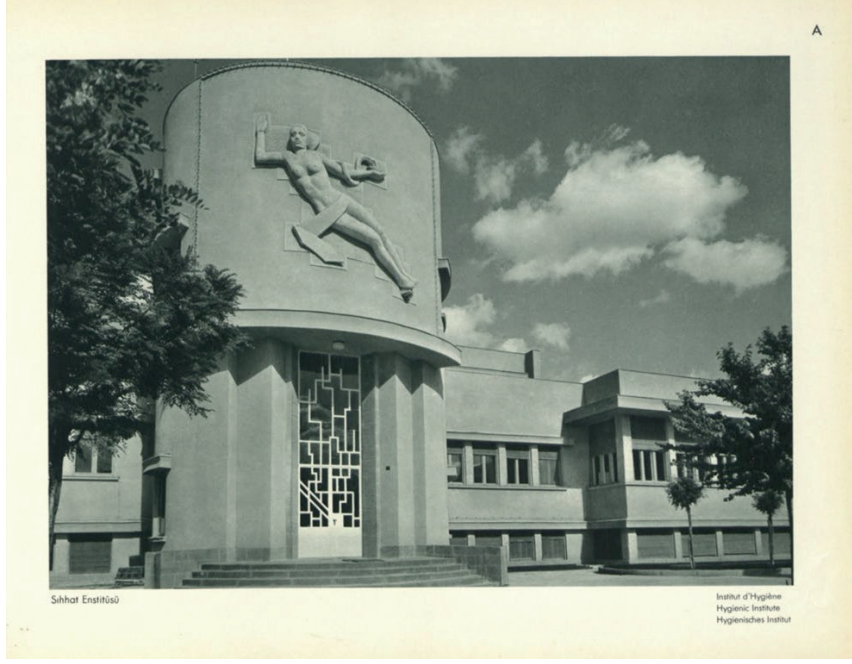
Görsel 4: “Sıhhat Enstitüsü” ( Fotoğrafla Türkiye).