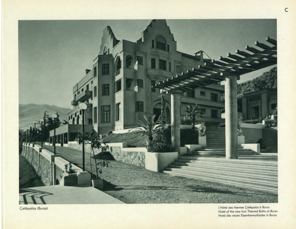
Görsel 9: “Çelikpalas (Bursa)” (Fotoğrafla Türkiye).

larıyla kütüphanesinin olduğu söylenmiştir (Aslanoğlu 1980: 132). Türk Anonim Şirketi'nin yaptırdığı otel ve hamam yapısının peyzaj çalışmasının, açık ve kapalı gazinolar ve muhtelif fıskiyeli havuzları içerdiği söylenmiş, projede arazi vaziyeti, mevcut binaların birbiriyle ve bahçeyle ilişkisi değerlendirilmiş yapının giriş kısmına da Mustafa Kemal'in bir büstünün konulduğu belirtilmiştir (Kaplıca Oteli Bahçe Projesi-Bursa 1933: 292). 10 Temmuz 1936 tarihli “ Bir Sıhhat Kaynağı: Çelikpalas ” başlıklı Ulus Gazetesi'nde (s. 5), bu kurumla memlekete modern kaplıca ve iyi otelciliğin güzel bir eserinin verildiği vurgulanmış, yapıyla birlikte Bursa şehrinin modern bir görünüme kavuştuğu, yapının bahçesinin de dönemin kamusal alanlarından biri haline geldiği bilgisi verilmiştir.