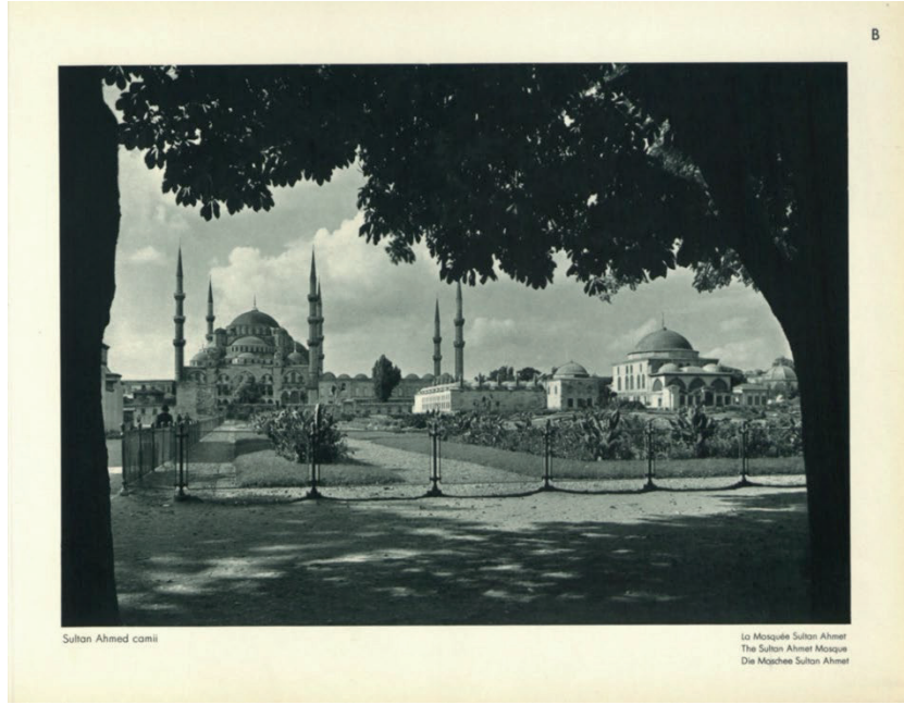
Görsel 6: “Sultan Ahmed Camii” (Fotoğrafla Türkiye).

“Rüstempaşa Camisi” isimli imajda yapının taşıyıcı unsuru fil ayaklarının üzerindeki ünlü çini bezemeler görülmektedir. “Süleymaniye Camisi” imajında külliye camisi ile dış avlu duvarı ve sâlis, râbi medreseleri gece fotoğraflanmıştır. “Mihrimah Camisi” Edirnekapı semtinde bulunan Mihrimah Sultan adına yapılan külliye camii semtin arka planda görüldüğü şekilde fotoğraflanmıştır. “Üsküdar’da bir Cami” isimli imajda yer alan camii Mihrimah Sultan adına Üsküdar’da yapılan külliye camii camiidir ve imajda son cemaat yeri görülmektedir. “Boğaziçinden Ortaköy Camisi” görselinde Boğaz vurgusu yapılmakta ve camii arka planda gözükmemektedir. “Rumeli Hisarı” imajında savunma yapılarından sur duvarları yapının üzerinden “Rumelihisar kaleleri ve bir eski çeşme” görselinde hisar, karşı kıyıda fotoğraflanmıştır. İmajdaki yapı, Küçüksu Kasrı Çeşmesi de denilen Mihrîşah Sultan Çeşmesi’dir. Bursa faslı albüme Yeşil Camii, Yeşil Türbe ve Şehzade Mustafa Türbesi ile yansımıştır. “Yeşil Camiden” görselinde caminin mihrap kavsarası, “Yeşil Caminin penceresi” imajında caminin künde kari pencere kanatları “Yeşil Türbenin kapısından” görselinde Mehmet Çelebi Türbesi de denilen türbenin kapısı ve avlusu “Yeşil Türbeden” imajında yapının mihrabı fotoğraflanmıştır. “Mavi çiniler (Bursa)” imajında bahsi geçen çiniler Şehzade Mustafa Çelebi Türbesi’ne aittir. “Yeşil Caminin çinileri” görselinde yapı ismi yanlış aktarılmış, mevzu bahis Manisa Muradiye Camii çinileridir.