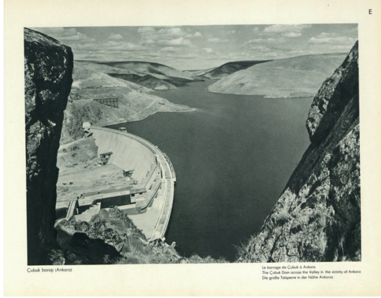
Görsel 7: “Çubuk Barajı (Ankara)” (Fotoğrafla Türkiye).