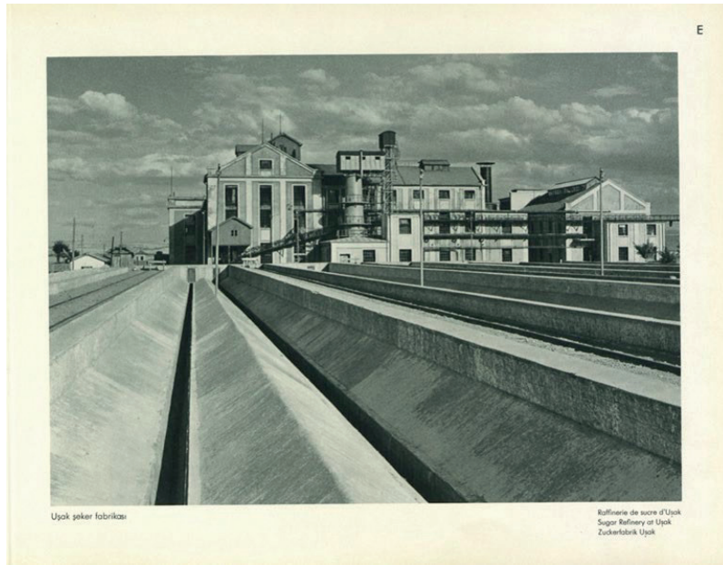
Görsel 11: "Uşak şeker fabrikası".

duğu düşünülmüştür. 1894 yılının Annuaire Orientale 'inde Çanakkale'de üretilen ürünler arasında tuzlu balık ve konserve edilmiş sardalya'nın yer aldığı, aynı tarihlerde Erdek'te ise sadece tuzlu balık üretimi olduğu söylenmiştir. 1914'te Erdek'te tuzlu balık ticareti yapan beş adet tüccar bulunduğu bunlardan üçünün yabancı olduğu belirtilmiştir (Yentürk 2007: 28-29). 18 Haziran 1932 tarihli " Balık Bolluğu " başlıklı Akşam Gazetesi 'nde (s. 9), Erdek ilçesinde bir konserve fabrikası açmanın bölgenin iktisadi hayatını iyileştireceği vurgulanmıştır. Bu haber, Cumhuriyet Dönemi iktisat hayatı çerçevesinde Osmanlı'dan beri kullanılan yerel ürünlerin tanıtılması adına oluşturulabilecek "yeni" girişimler için önem arz etmektedir. 29 Temmuz 1937 tarihli " Erdek'te Neler Gördüm " başlıklı Türk Dili Gazetesi 'nde (s. 2), Erdek'te bir balık konserve fabrikası açıldığı duyurulmuştur. Bu yapıların, devralınan endüstri mirasının "yenileşme" hareketi vurgusu ve üretilen sanayi ürünlerinin "asrı" ülkelerle kıyaslanabilecek düzeye getirilmek istenmesi sebebiyle albüm için tercih edildiği düşünülmüştür.