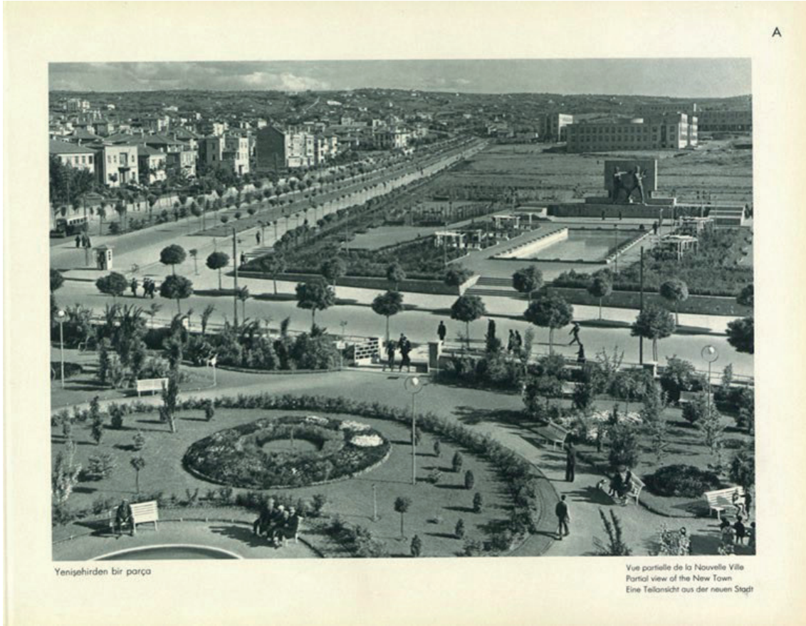
Görsel 2: “Yenişehirden bir parça” (Fotoğrafla Türkiye).