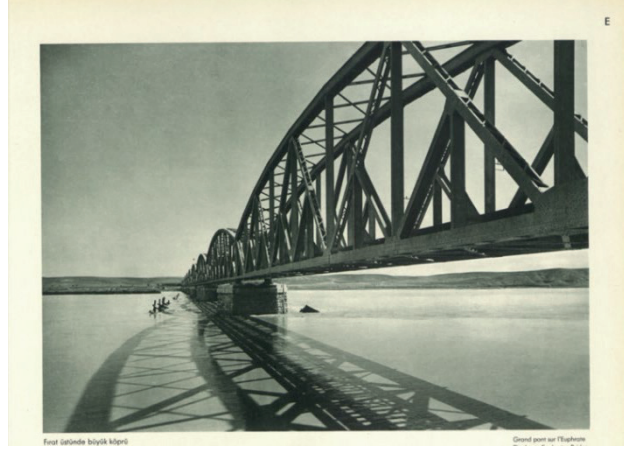
Görsel 8: "Fırat üstünde büyük köprü" (Fotoğrafla Türkiye).

bir imajla albümde yer almıştır. 1894'te Anadolu-Bağdat demiryolunun lokomotif ve vagon tamiri için Eskişehir'de Anadolu Osmanlı Kumpanyası adında bir atelye kurulmuş, 1920'de Eskişehir Cer Atelyesi olarak adı değiştirilmiştir (Koylu 2018: 46-47). 18 Ağustos 1937 tarihli " Eskişehir Cer Atölyesi Tevsi Edilecek " başlıklı Son Posta Gazetesi'nde (s. 5), hükümetin demiryolu siyasetinin onarım ayağı olarak gösterilen atelye, istihdam alanı açması ve demiryollarının tamamlayıcı unsuru olması sebepleriyle albüm için tercih sebebidir.