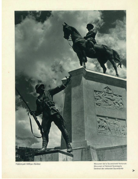
Görsel 3: "Hakimiyeti Milliye Abidesi" (Fotoğrafla Türkiye).

Zafer Anıtı, Anıtkabir inşa edilinceye kadar Ankara'daki devlet törenlerinin yapıldığı yer olarak işlev görmüş, kartpostallar, mecmualar, gezi kılavuzları ve afişler üzerinde görselliği yaygınlaşan ulusal bir simge haline gelmiştir. (Goethe Institut ve TMMOB Ankara 2012: 320). 18.11.1939 tarihli Ulus Gazetesi'ndeki "Pulculuk" başlıklı metin bunun göstergesidir (s. 6).