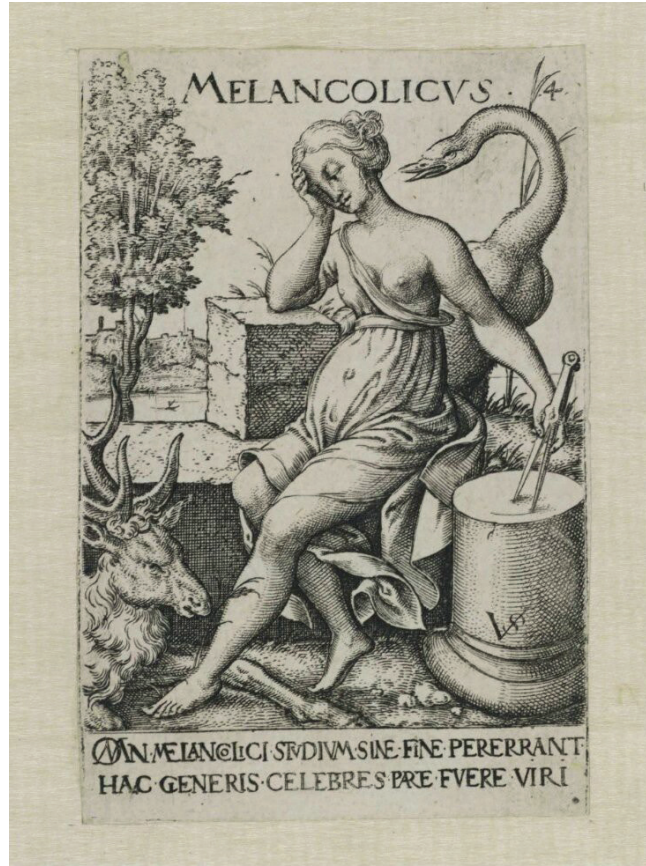
Görsel 5. Virgil Solis (1530-1562). Melancolicvs

Panofsky'ye göre melankoli kavramının bilimsel ve sözde bilimsel folklor düzleminde sanat düzeyine taşındığı ilk temsil olan Dürer'in Melencolia I'i melankoliye dair düşünüş kadar melankoli imgeleminde de öyle büyük bir kırılma yaratır ki, doğrudan etkilediği eserler kadar dolaylı yoldan etkiledikleriyle birlikte (Görsel 5). melankoli literatürünün (Aristotelesçi metinden sonra ikinci) aslı kurucusu haline gelir. Eserin etkisi tüm Avrupa'da hissedilir ve esinleyici kudreti hala bakidir.