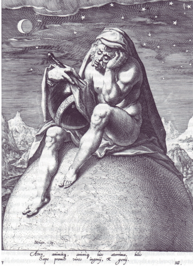
Görsel 3. Zacharias Dolendo (1595). Melankoli olarak Satürn , (Kaynak: Klibansky vd. 1979)

Yine de Rönesans'ın şafağında bir başka gelişme, melankoli yazınına damgasını vurmaya başlar. Dönemin revaçta uğraşı olan astronomiden hareketle Antik dörtlü düşünüş formu yeniden değerlendirilir. Artık her bir mizaç bir arkhe 'yle eşleştiği gibi gezegenle de eşleşir. Melankoliklerin arkhe 'si toprak, gezegeni ise Satürn'dür, (Yates, 2007: 172). Burada Satürn, öncelikle yeryüzünden gözle görülebilen en uzak gezegene, en yavaş dönen mavi gezegene karşılık gelir; ancak aynı zamanda, Yunan Altın Çağı'nda Titanların lideri ve zaman tanrısı olan Kronos'un müspet bir şekilde Latinleştirilmiş versiyonu, tarımla tarım işleriyle meşgul olan Roma tanrısı Satürn'e de göndermede bulunur.