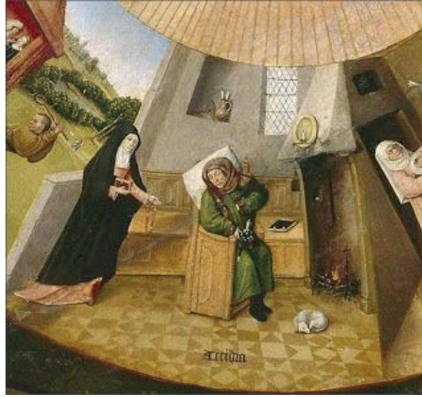
Görsel 1. Hieronymus Bosch (~1500). “Acidia”, Yedi Ölümcül Günah ve Dört Son Şey , Museo del Prado, Madrid.

MS 4. yüzyıl ve sonrasındaki ilk münzevi Hıristiyan keşişleri de Aristoteles'in melankoli metnine, melankoli-deha ilişkisine vakıftılar. Gelgelelim Hıristiyanlar melankoliyi, tıbbi felsefeden ayrı olarak ele alan Galenos'un yaklaşımını ahlakileştirerek temellük edecektir. Hıristiyanlıkla birlikte hastalıklar ve ruhsal bozukluklar artık Tanrının verdiği bir eza ve cezaya tekabül eder. Zaten selamet/kurtuluş kelimesinin kökeninin salus yani sağlık olması tesadüf değildir. Hastalık, ruhun terbiye edilme biçimlerinden, sınamalarından birine tekabül eder (Turner 2011: 30-32). Dolayısıyla Hıristiyanlıkla birlikte melankoli, ruh, beden ve yaşam pratikleri açısından değerlendirilmeye başlanır, ahlakileşir. Ahlakleşmiş bu melankoli, tutkuların kontrolü, beden kontrolü, dindar bir yaşam sürme ve kurtuluşla ilişkili olarak algılanmaya başlanır (Görsel 1).