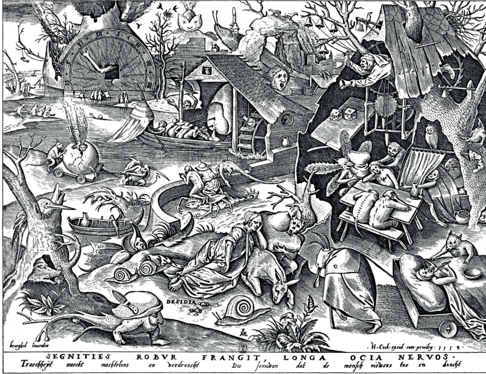
Görsel 2. Pieter Bruegel (1558). Yedi Ölümcül Günah – Disidia.

13. yy'dan itibaren acedia , sıradan insanlar için de kullanılmaya başlanır. Zira keşişlerin toplumsal işbölümü içerisindeki vazifeleri tefekkür ve ibadetken sıradan insanların vazifesiye çalışmaktır; bu görevlerden birinin aksaması miskinliktir. Zamanla acedia uhrevi anlamlarını yitirmeye, aylıklık olarak anlaşılmaya ve tembellikle özdeş hale gelmeye başlayacaktır (Starobinski 2007: 225-9). Melankoli, yani dört özsu düşüncesi ise halka yayıldıkça, nedeni belirsiz hüznün haline gelmeye başlar; artık yalnızca kişileri değil şeyleri de betimleyen bir sıfat haline dönüşür (Prigent 2009: 38).