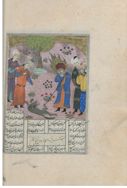
Görsel 3: İsa peygamber, Nizami Hamse (Maḥzenü'l-esrâr), TSMK, H. 775, 1497, 22a.

Türkmen dönemine ait olan H.767 (23a) 'de benzer kompozisyonu devam ettirir durumdadır. Siyah sakallı, alevli hâlesi, elinde asası ile tasvir edilmiş İsa peygamber ve yerde yatan ölü köpek merkezde yer alırken, bu durumu izleyenler sahnenin iki kenarında yerlerini almışlardır. Türkmen dönemi resim üslubunun bir etkisi olarak sade bir doğa bezemesi ile, iki dalı ile yapılmış ağaç ise arka planda yerini almıştır (Görsel 4). Burada figür sayısında artış olmakla birlikte H. 775'de yer alan kompozisyon benzer bir yaklaşım olduğu fark edilebilmektedir (Görsel 3-4).