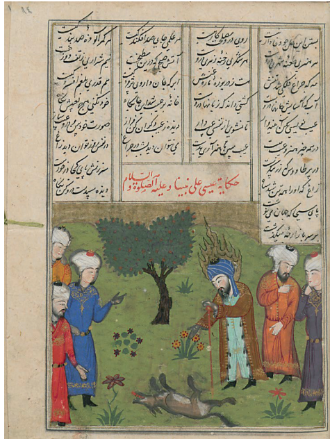
Görsel 1: İsa peygamber, Nizami Hamse, (Mahzenü'l-esrâr), TSMK, R.862, 1442, 14a.

İsa peygamber ile ölü köpeğin betimlendiği ilk örnek 1442 tarihli R. 862 (14a) olmuştur 12 . Timurlu dönemine ait olan yazmanın içerisinde yer alan bu resimde İsa peygamber ve ölü köpek sahninin merkezinde verilmiştir. İsa peygamber elinde asası ve bir eliyle ölü köpeği gösterirken, alev biçiminde hâlesi ile tasvir edilmiştir. Etrafında ise konu ile bağlantılı bir biçimde köpeğin durumunu şaşkınlıkla izleyen insanlar yer almaktadır. Arka planda ise çift dalı bulunan bir ağaç kompozisyonun tamamlayıcısı olarak yerleştirilmiştir. Timurlu dönemi resim üslubunun bir özelliğini doğanın betimindeki sadelik ile, belirgin bir şekilde koyu tonların kullanılmış olmasıyla görebilmektedir (Görsel 1) 13 .