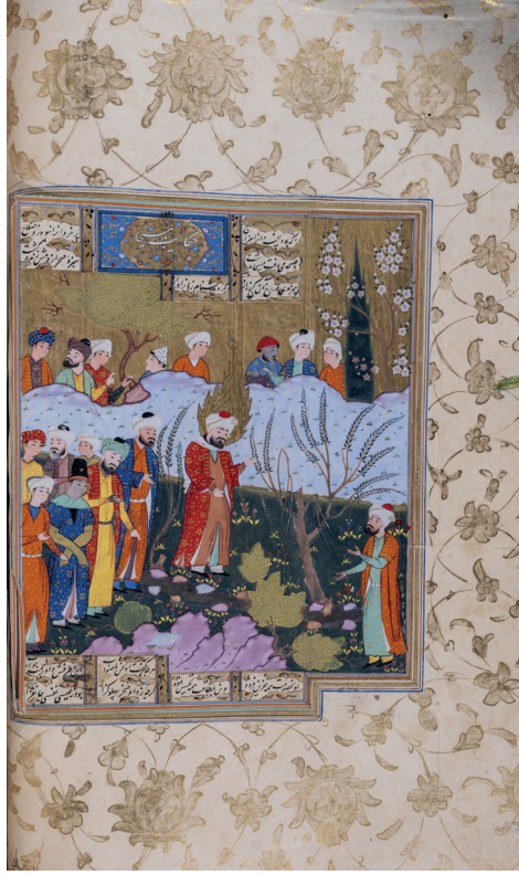
Görsel 6. İsa peygamber, Nizami, Hamse (Maḥzenü'l-esrâr), TSMK, H. 794, 1562-1563, 36b.

üslubunun etkisi olarak parlak ve canlı renkler, detaylı bir doğa betimlemesi ve kalabalık bir kompozisyon görülebilmektedir 16 .