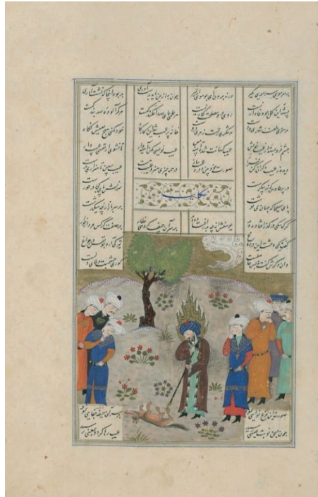
Görsel 4: İsa peygamber, Nizami Hamse (Maḥzenü'l-esrâr), TSMK, H. 767, 1495, 23a.

Türkmen dönemine ait olan H.767 (23a) 'de benzer kompozisyonu devam ettirir durumdadır. Siyah sakallı, alevli hâlesi, elinde asası ile tasvir edilmiş İsa peygamber ve yerde yatan ölü köpek merkezde yer alırken, bu durumu izleyenler sahnenin iki kenarında yerlerini almışlardır. Türkmen dönemi resim üslubunun bir etkisi olarak sade bir doğa bezemesi ile, iki dalı ile yapılmış ağaç ise arka planda yerini almıştır (Görsel 4). Burada figür sayısında artış olmakla birlikte H. 775'de yer alan kompozisyon benzer bir yaklaşım olduğu fark edilebilmektedir (Görsel 3-4).