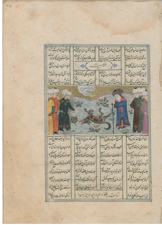
Görsel 2: İsa peygamber, Nizami, Hamse (Maḥzenü'l-esrâr), TSMK, H.787, 1494, 23a.

hâlesi gökyüzü betimi için kullanılan altın yıldız içerisinde kaybolmuştur. Etrafındaki figürler ise el işaretleri ile belli ettikleri şaşkınlıkları ile köpeğe bakmaktadırlar. Türkmen dönemi resim üslubunun bir özelliği olarak oldukça sade bir doğa, yerden çıkan ufak bitkiler ve altın yıldız gökyüzü betimlemesi olarak fark edilebilmektedir (Görsel 2).