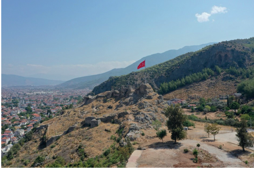
Görsel 1: Fethiye Kalesi'nin genel görünümü.

Anadolu'nun güneybatısında yer alan Fethiye, güneybatı Anadolu'nun diğer merkezleri gibi 13. yüzyılın ikinci yarısından itibaren Türk hakimiyetine girmeye başlamıştır. Bölgeyi kısa zamanda denetimi altına alan Menteşeoğulları'nın doğu topraklarında en önemli yerleşim birimi olarak öne çıkan Fethiye, zaman zaman aileden beylerin muhtemelen yarı bağımsız hareket ettiği bir merkez durumunda olmuştur. Kendilerinden önce Bizans döneminde canlı diyebileceğimiz deniz ticareti Menteşeoğulları ve sonrasında Osmanlı dönemlerinde de devam etmiştir.