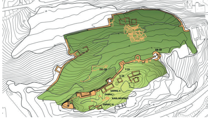
Görsel 2: Fethiye Kalesi ve ortaya çıkarılan mekanlar

Fethiye Kalesinde Mentеше ve Osmanlı dönemi sikkeleri yoğun olarak üst kısımda ele geçmiştir (Görsel 2). Bunlar, kalenin üst kısmında doğudan batıya doğru AB 38, AC-29-30, Y 33, V 34, Sarnıç I-II-III, Kaya Mekân II ile alt kottaki Z 31-32 numaralı plankare veya mekânlardır (Görsel 3). Sikkelerin ele geçtiği yerlerde ortaya çıkarılan seramikler başta olmak üzere bulunan diğer küçük eserler de XIV. ve XV. yüzyıla tarihlenmektedir. Konumuz olan bu sikkeler, Türk dönemine ait henüz bir kitabe ortaya çıkmayan Fethiye Kalesi'nde kazılarla gün yüzüne çıkarılan mekânlar ve diğer buluntularla ilişkileri de göz önüne alındığında özellikle tarihlemede önemli bir veri olarak önem taşımaktadır.