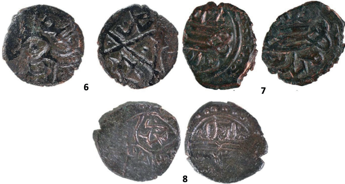
Görsel 10: 6.-7. ve 8. grup sikkeler.

Tire’de basılan sikkenin bir yüzü, ortada üçgen oluşturan düz çizgilerin ayırdığı yan kısımlarına yazılar yerleştirilmiştir. Arka yüz, ortadaki daireye bitişen dalgalı, yatay çizgilerin oluşturduğu iki satırlık yazılardan meydana gelmiştir (Görsel 10/6).