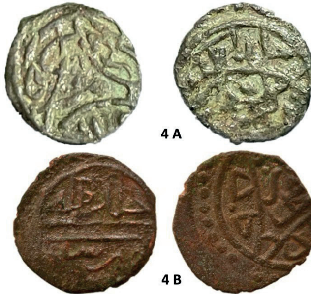
Görsel 8: 4. Grup Sikkeler

Bu grup sikkeler iki farklı tiptedir (Görsel 8). Bunlardan ilkinde ön yüz üç yandan yarım dairelerle bölünlenip ortada üç ayak meydana gelir. Yazılar bu yarım yuvarlaklar içinde yerleşmiştir. Arka yüzde bu defa iki yarım yuvarlak yüzeyi üç satıra ayırmıştır. Bu gruptaki diğer tipte ön yüzde yarım yuvarlak çizgilerin yerini hafif eğrisel üç çizgi alır. Yazılar bu çizgilerin ayırdığı yan kenarlara ve ortaya alınmıştır. Ortadaki yazıyı “Meh-med” şeklinde sultanın adı oluşturur. Arka yüzde yazılar paralel iki düz çizginin ayırdığı iki satıra yerleştirilmiştir.