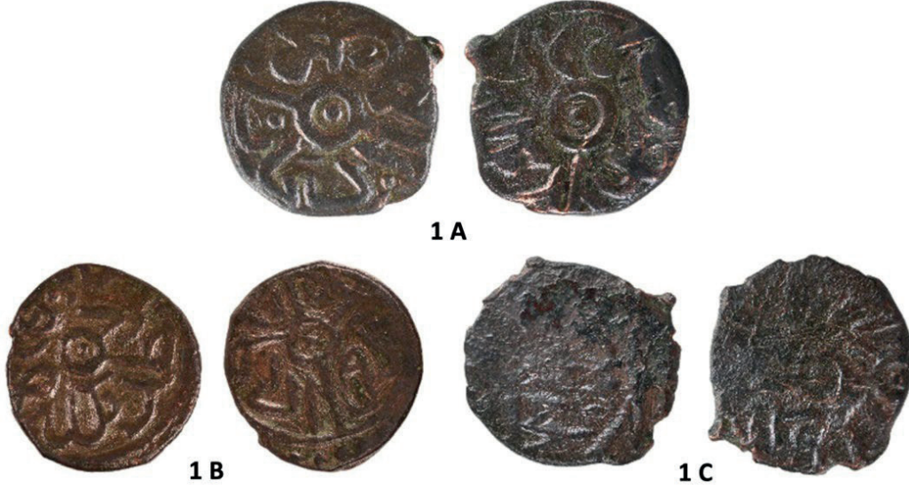
Görsel 4: 1. Grup Sikkeler

Bu sikkeler birbirinden küçük bir farkla ayrılan iki tipte karşımıza çıkmaktadır. Bu sikkelerde her iki yüzün ortasındaki dairenin çevresine yine daire şeklinde yazılar yerleştirilmiştir. Bunlardan ilkinde (1.A-B-C) dairelerin ortasında birer küçük nokta yer almakta, dairelere kadar uzanan yazıların arasındaki düz çizgiler veya uzun harfler kelimelerin arasına girmiştir. Sikke dıştan sınırlayan dairenin dışı tek sıra noktalarla sınırlanmıştır (Görsel 4). Bu örnekler müze ve özel koleksiyonlarda yoğun olarak yer almasıyla bu mangır, Fatih devri bronz sikkeleri içinde dikkat çekici bir yere sahiptir. Bu grup sikkeler üst kalede birbirine yakın olan Sarnıç I- II ve Kaya Mekân II nolu mekânlarda ele geçmiştir. Bu sikkelerden birinin yazıları tam okunmakta olup basım yeri Karahisar olarak tespit edilmiştir.