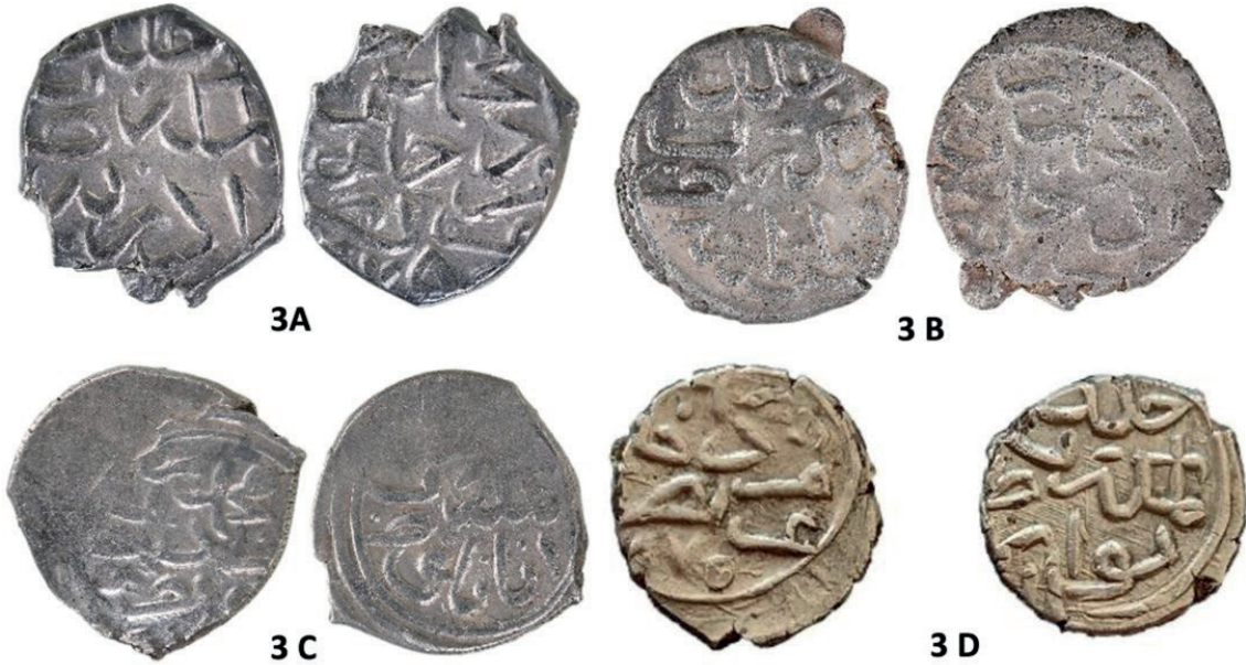
Görsel 7: H. 875/M. 1470-1471 tarihli 3. Grup Sikkeleri.