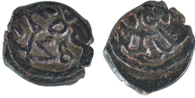
Görsel 5: 1. Grup 2. Tip sikke