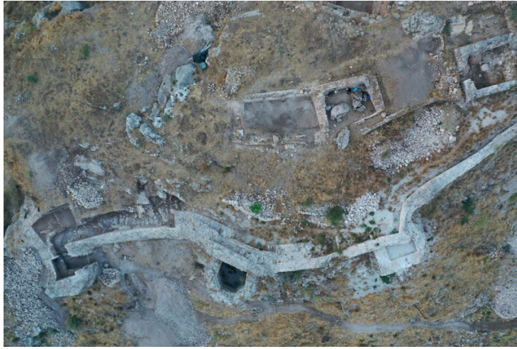
Görsel 3: Fethiye Kalesi'nin üst kısmında ortaya çıkarılan mekanlar.

Fethiye Kalesinde Mentеше ve Osmanlı dönemi sikkeleri yoğun olarak üst kısımda ele geçmiştir (Görsel 2). Bunlar, kalenin üst kısmında doğudan batıya doğru AB 38, AC-29-30, Y 33, V 34, Sarnıç I-II-III, Kaya Mekân II ile alt kottaki Z 31-32 numaralı plankare veya mekânlardır (Görsel 3). Sikkelerin ele geçtiği yerlerde ortaya çıkarılan seramikler başta olmak üzere bulunan diğer küçük eserler de XIV. ve XV. yüzyıla tarihlenmektedir. Konumuz olan bu sikkeler, Türk dönemine ait henüz bir kitabe ortaya çıkmayan Fethiye Kalesi'nde kazılarla gün yüzüne çıkarılan mekânlar ve diğer buluntularla ilişkileri de göz önüne alındığında özellikle tarihlemede önemli bir veri olarak önem taşımaktadır.