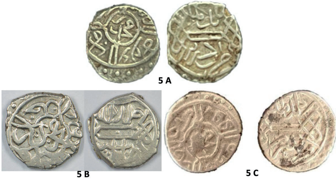
Görsel 9: H. 855/M. 1451-1452 tarihli 5. Grup sikkeler.

Bu grupta, ön yüzde “Muhammed bin” yazısı ortaya daire şeklinde yerleştirilmiş, bu daireden dört yönde çıkan çizgilerin ayırdığı alanlara yine daire şeklinde yazılarla dolgulanmıştır (Görsel 9). Fatih’in tahta çıktığı ilk yıllarda, H.855/M.1451-1452 tarihinde basıldığı anlaşılan bu akçelerde darp yeri olarak Amasya, Edirne ve Serez okunmaktadır.