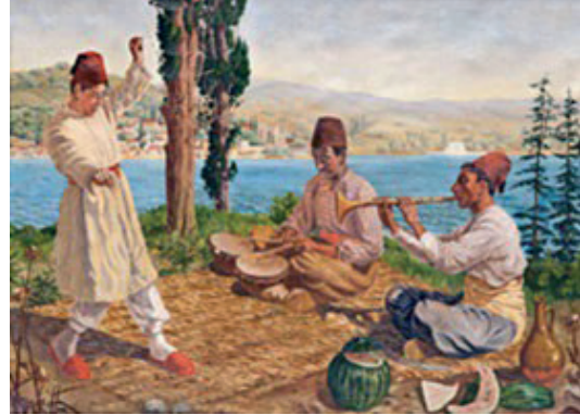
Görsel 26: Joseph Warnia-Zarzecki, "Paşa'nın Keyfi" (Kaynak: Thalasso, 2008: 69)