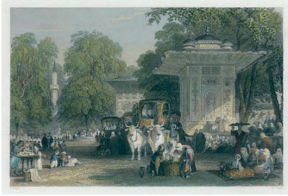
Görsel 24: Joseph Warnia-Zarzecki, "Göksu Mesiresi", Özel koleksiyon