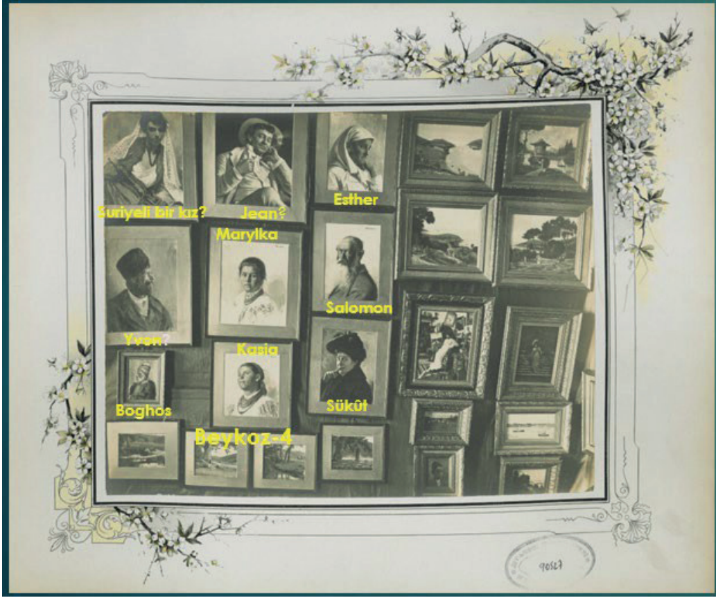
Görsel 11: 1903 Salonu'nda Joseph Warnia-Zarzecki'nin resimleri, İstanbul Üniversitesi Nadir Eserler Kütüphanesi Yıldız Albümleri 90527/10 19

Joseph Warnia-Zarzecki'nin 1903 Salon sergisinde yer alan resimleri, 179-191 arasına numaralandırılmış olup başlıkları şöyledir (Görsel 11): “Boghos” (Boğos), “Jean”, “Yvon”, “Salomon”, “Esther”, “Marylka” (Marika), “Kasia”, “Suriyeli Bir Kız”, “Sükût” ve dört tane “Beykoz” etüdü. Bu sergiyle ilgili olarak yerel basında yine Celal bin Esad (Celal Esad Arseven) imzalı bir yazı, 11 Haziran 1903 tarihli Malumat mecmuasının 388. sayısında yayınlanmış; yazar, J. Warnia-Zarzecki'nin resimlerini, özellikle başlıkları açısından eleştirmiş ve bunu başka örnekler vererek açıklamaya çalışmıştır. Söyledikleri kısım şöyledir: