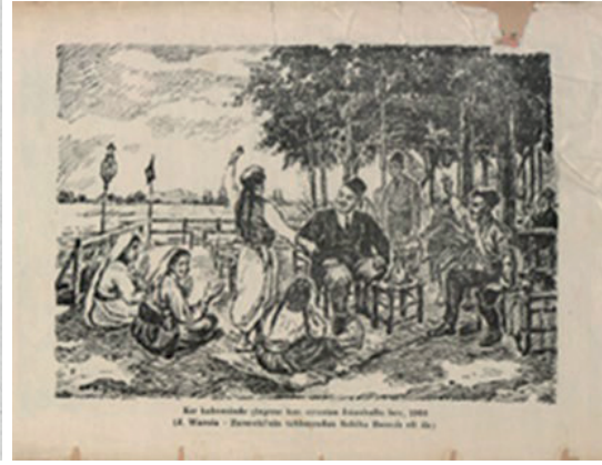
Görsel 14: Joseph Warnia-Zarzecki, “Meşrutiyet Sonrası Keyif Çıkarma” (Kaynak: Franzinski-İsmail Bey 1908: 324)