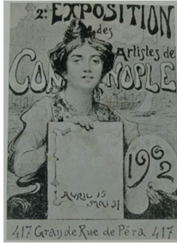
Görsel 9: 1902 Sergisi için F.Zonaro'nun hazırladığı afiş taslağı (Kaynak: Thalasso 2008: 15)

Fausto Zonaro, 1902 Sergisi için bir afiş taslağı hazırlamıştır (Görsel 9). Bir yandan da bu sergi, peş peşe düzenlenen üç sergi arasında yerel ve yabancı basında en fazla bahsedilendir. 15 Nisan 1902 tarihli İkdam gazetesinde “Resim Sergisi” başlıklı anonim yazıda Joseph Warnia-Zarzecki'ye yer verilmekte, “Finis Vanitatum” adlı resminin pek parlak olduğu belirtilirken “Zavallı Hemşire Katina” resmi duygusal olarak nitelendirilmektedir. Bu yazıdan üç gün sonra (18 Nisan 1902) yine İkdam'da, Celal bin Esad imzalı “Sergideki Resimler” adlı yazıda Joseph Warnia-Zarzecki'nin eserlerinden birkaç satırda bahsedilmektedir: