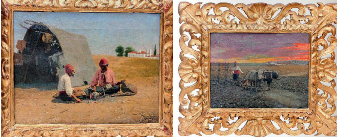
Görsel 20: Joseph Warnia-Zarzecki, “Figürlü Kompozisyon”, tuval üzerine yağlıboya, 26 x 34 cm., Özel koleksiyon

“Salacak’tan Kızkulesi ve İstanbul”, “Çanakkale” ve bir isimsiz tablo 29 . Yukarıda belirtildiği üzere bazı resimler, kaynaklara farklı isimlerle geçmiş, bu farklı isimlendirmelere de yer verilmiştir. Ama bunlardan bazılarının görselleri, yazılı metinlerde olmadığından, farklı ya da aynı isimler tereddüt yarattığından burada görülen sayılar ve soru işaretleri bu belirsizliklerden kaynaklanmaktadır. Bazı resimler gerçekten iki veya daha fazladır, ama bazılarının da aynı resim olma ihtimali vardır. Ayrıca çeviriden kaynaklı olarak birbirinden farklı resim isimleriyle karşılaşılmıştır; örneğin bunlardan özellikle dikkat çeken biri yukarıda bahsedilen “Boğaz’da Yaban Hayatı” adlı resim ve bir diğeri de “Kedi” “Küçük Kedi” ya da “Küçük Bir Kız” olarak adlandırılan resimdir. Söz konusu ikinci resmin görseli de olmayınca gerçekten kedi resmi midir, bir kız için kedi gibi manasında mı kullanılmıştır belli değildir. Ama yukarıda adı geçen Mehmet Ali Tevfik’in 1911 Operaia sergisi ile ilgili yazısında, -sergiyi gezdiği de düşünülürse- tablo için “Küçük Bir Kız” ismini kullanması (Özyiğit 2012: 330), resmedilenin bir kız olma ihtimalini arttırmaktadır. Bunlar sonucunda Warnia-Zarzecki’nin belirlenebilen resimlerinin sayısı ortalama 65’dir.