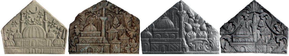
Görsel 2a: Cami (Tunçel 1989), cami ve köşk (Aydın 2022), cami ve türbe (Gökler 2017), cami, türbe ve köşk (Varol 2015),