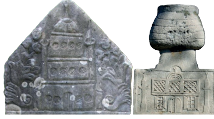
Görsel 8: Çanakkale Ayvacık (Başaran 2020), Denizli (Pektaş 2018)

başlık ile gövde arasında yer alması da yerel etkiyi destekler niteliktedir (Görsel 8).