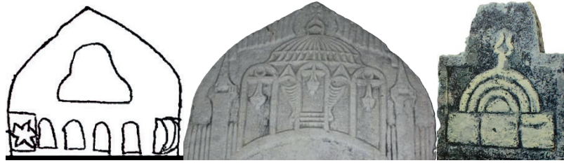
Görsel 9: Manisa Gördes (Biçici 2004), İzmir Ödemiş (Yılmaz 2013), İzmir Foça (Daş 1996)

Manisa Gördes'teki M 1861-1877 yılları arasına ait 3 örnek (Biçici 2004: 417, 437, 441), kubbe ve hemen altındaki pencerelerden oluşan düzenlemesi itibarıyla özgündür. İzmir Ödemiş'te M 1904 tarihli eserde (Yılmaz 2013: 344), caminin kandillerle birlikte iç mekanı tasvir edilirken, dış cephede kenarlara minarelerin yerleştirilmesiyle meydana gelen benzersiz kompozisyon yerel işçiliğe işaret etmektedir. İzmir Foça'daki M 1825 tarihli örnek (Daş 1997: 64) ise sade yapısı ve minaresiz kurgusuyla dikkat çekmektedir. Yüzeye hakim şekilde işlenen cami, tek kademeli cephesi, kubbe örtüsü ve bunun üstündeki alemden ibarettir (Görsel 9).