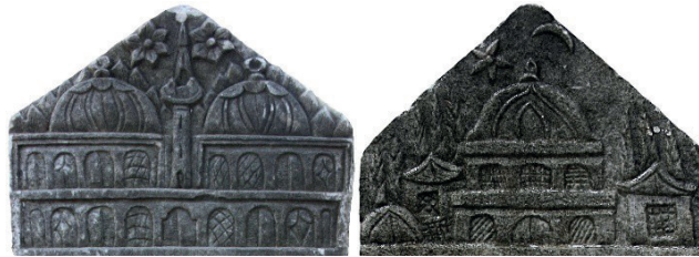
Görsel 6: Minareli ve minaresiz cami tasvirleri (Varol 2019)

Cami tasvirlerinin 582'sinde minare bulunurken 62'si minaresiz şekilde işlenmiştir. Tek minare 498 eserde, çift minare 82, dört minare 2 eserde görülür. Tek minare yüzeyde eksene yerleştirilirken çift minareli düzenleme eksendeki caminin iki kenarında yer almaktadır. Avlulu örneklerde minare gövdesine avlu duvarının üstünde yer vererek kompozisyonda derinlik yaratılmıştır (Görsel 6).