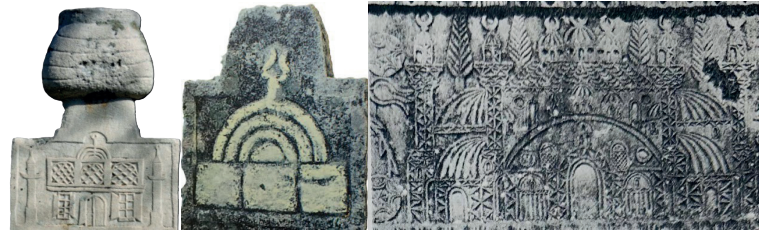
Görsel 10: Denizli (Pektaş 2018), İzmir Foça (Daş 1996), Erzincan (Madran 1971)

Üslup ve kompozisyonun etkisini hissettirdiği diğer husus mezar taşlarındaki cinsiyettir. Büyük oranda kadın mezar taşlarında görülen mimari tasvirler, erkeklere ait 10 eserin bezenmesinde tercih edilmiştir. Bunlardan 7'si Denizli (6) ve İzmir Foça'daki (1) yerel üretim örnekleriyken bunlara ek olarak, Erzincan'ın Kemah ilçesindeki M 1838 tarihli eser de erkek mezarına aittir. Burada, lahit biçimli mezarın uzun kenar yüzeyindeki kompozisyon selvi ağaçlarıyla desteklenmiş olmakla birlikte caminin işlenişi Ege üslubundan oldukça farklıdır (Görsel 10).