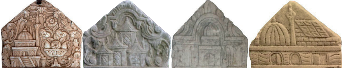
Görsel 1: Cami (Aydın, 2022), köşk (Başaran, 2020), türbe (Bıçıcı, 2020), cami ve konut (Sarı, Mesara, Kurt 2009)

olarak değerlendirilmiştir. Camiye oranla daha küçük boyutlu, kubbe örtülü, tek kademe cepmeli, minaresiz ve camiden bağımsız ya da cephe tasarımı itibarıyla ayrı düzene sahip yapılar türbe 13 ; külah örtülü, genellikle tek kademe cepmeli ve minaresiz 14 yapıları köşk 15 ; tek 16 kademe cepmeli, sundurma çatılı ve minaresiz yapılar konut olarak nitelendirilmiştir 16 . Kompozisyonda mimari yapılar tek bir türden oluştuğu gibi sayıları dörde varan farklı yapı türlerinin bir araya getirilmesinden de oluşturulmuştur ( Görsel 1 ).