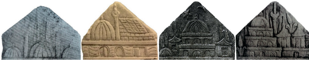
Görsel 3: Tek kademeli (Tunçel 1989), iki kademeli (Sarı, Mesara, Kurt 2009), üç kademeli (Varol 2019), dört kademeli cami tasvirleri (Tunçel 1989)

Camilerin cephe düzeninde avlu duvarı, cami cephe duvarı, kasnak ve örtü elemanı birimleri kademelenmektedir 17 . Kompozisyonlarda perspektifin gözetilmemesi ve bazı örneklerde kademelerin detaylı betimlenmemesi karışıklığa yol açmaktadır. Örnek olarak, birçok eserde kubbe kasnağı ile cami cephesinin veya avlunun eş yükseklikte tutulması ve aynı düzenlemeyle işlenmesi gösterilebilir. Buna çözüm sunabilmek adına camilerdeki her yatay düzlemi bir kademe olarak saydık. Bu bağlamda camilerde bir ile dört arasında değişen kademe düzenlemeleri tespit edilmiştir. Sadece kubbeden oluşan tek kademeli 22 eser, avlu- kubbe veya cephe-kubbe(veya külah) oluşan iki kademeli 264 eser, avlu-cephe-kubbe(veya külah) veya cephe-kubbe kasnağı-kubbe üç kademeli 309 eser, avlu-cephe-kubbe kasnağı- kubbe veya cephe-cephe-kubbe kasnağı-kubbe dört kademeli 49 eser bulunmaktadır (Görsel 3).