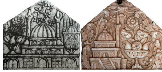
Görsel 4: Avlulu (Tunçel 1989) ve avlusuz cami tasvirleri (Aydın 2022)

506 eserde avluya yer verilmemiştir. Kubbe kasmağı 368 eserde görülürken, 276 eserde kubbe doğrudan beden duvarlarına ya da bunların 25'inde olduğu gibi doğrudan zemine oturmaktadır (Görsel 4).