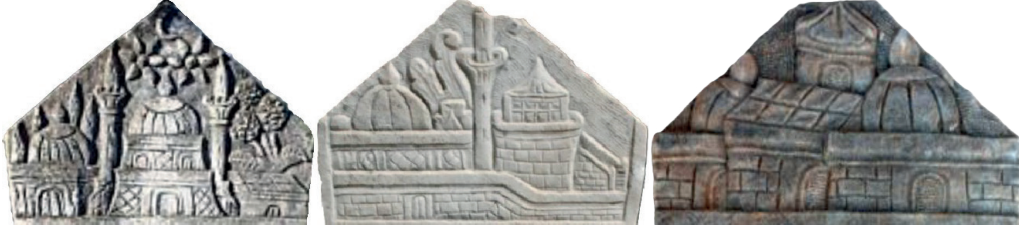
Görsel 2b: cami, türbe ve konut (Yılmaz 2013), cami, kale ve köşk (Biçici 2020), türbe, köşk ve konut (Aydın 2022)

Camilerin cephe düzeninde avlu duvarı, cami cephe duvarı, kasnak ve örtü elemanı birimleri kademelenmektedir 17 . Kompozisyonlarda perspektifin gözetilmemesi ve bazı örneklerde kademelerin detaylı betimlenmemesi karışıklığa yol açmaktadır. Örnek olarak, birçok eserde kubbe kasnağı ile cami cephesinin veya avlunun eş yükseklikte tutulması ve aynı düzenlemeyle işlenmesi gösterilebilir. Buna çözüm sunabilmek adına camilerdeki her yatay düzlemi bir kademe olarak saydık. Bu bağlamda camilerde bir ile dört arasında değişen kademe düzenlemeleri tespit edilmiştir. Sadece kubbeden oluşan tek kademeli 22 eser, avlu- kubbe veya cephe-kubbe(veya külah) oluşan iki kademeli 264 eser, avlu-cephe-kubbe(veya külah) veya cephe-kubbe kasnağı-kubbe üç kademeli 309 eser, avlu-cephe-kubbe kasnağı- kubbe veya cephe-cephe-kubbe kasnağı-kubbe dört kademeli 49 eser bulunmaktadır (Görsel 3).