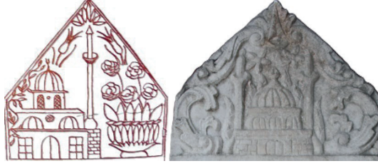
Görsel 11: İstanbul Tokmaktepe (Önge 1968), Aydın Koçarlı (Varol 2015)

ayak taşıdır (Varol 2015: 84-89). Baş taşının iki yüzünde de yer alan kitabeler iki farklı kişiyi belirtmekle birlikte ikisi de erkek adıdır. Dolayısıyla Ege üslubunu yansıtan eser, günümüze ulaşmış tespit edilen mimari tasvirli tek erkek mezar taşıdır 21 (Görsel 11).