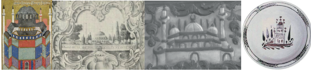
Görsel 12: Minyatür (Bağcı vd., 2006), duvar resmi (Renda 1977), minber yüzeyi (Bayrakal 2004), seramik tabak (Öney 2007)

El sanatları örneklerinde kompozisyonlar daha küçük boyutlu ve sade kurguya sahiptir. Bunlar arasında minyatür sanatı mimari unsurların en çok yer aldığı grubu oluşturmaktadır. Minyatürlü yazma eserlerde doğrudan mimari yapının betimlendiği örnekler olduğu gibi sahneyle ilişkili olarak mimari yapıya yer verildiği de görülmektedir. Ayrıca topografik resimler olarak bilinen örneklerde manzara tasviriyle birlikte çok sayıda mimari yapı betimlenmiştir 23 . Diğer el sanatlarından dokuma örneklerinde seccade ve halı (Karaçay 2015: 141-155; Bayraktaroğlu 2004: 21-36), maden örneklerinde gülabdan ve buhurdan (Ayhan 2014: 61-65), çini ve seramik sanatı örneklerinde 24 mimari kompozisyonlar yüzeyin bezenmesinde tercih edilmiştir (Görsel 13).