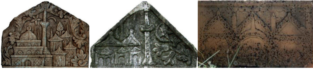
Görsel 5: Kubbe (Aydın 2022), külah (Varol 2019) ve kırma çatı örtülü cami tasvirleri (Budak 2020)

Cami tasvirinde örtü birimi eserlerin 649'unda kubbe, 6'sında külah, 6'sında kırma çatıdır. 5 farklı düzenlemeye sahip kubbe örtüsü eserlerin 523'ünde bir büyük kubbe, 67'sinde bir büyük ve bir küçük kubbe, 27'sinde bir büyük ve iki küçük kubbe, 26'sında iki büyük kubbe, 6'sında bir büyük ve üç veya daha fazla küçük kubbe şeklindedir. Bunlardan sayıca az olan bir büyük ve üç veya daha fazla küçük kubbeli örneklerin tamamı İzmir'dedir. Külah örtülü camiler köşk ile aynı nitelikte olmakla birlikte topluca, içlerinden biri alemlî ve minareli şekilde işlenmiştir. Kırma çatılıların tamamı Kayseri'de bulunmaktadır (Görsel 5).