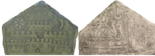
Kale (Elmas, 2023), cami ve saat kulesi (Sarı, Mesara, Kurt 2009)

688 mimari tasvirli mezar taşından 661'inde (%95,93) cami tasvir edilmiştir. Bunlardan 314'ünde tek başına, 184'ünde köşkle, 85'inde türbeyle, 49'unda türbe ve köşkle, 19'unda konutla, 5'inde köşk ve konutla, 3'ünde türbe ve konutla, 1'inde kaleyle ve 1'inde de saat kulesiyle bir arada verilmiştir. Camiden sonra en çok tercih edilen mimari yapı tasviri olan köşk 263 eserde görülür. Bunlardan 184'ünde cami ile, 49'unda cami ve türbe ile, 17'sinde tek başına, 6'sında türbe ile, 5'inde cami ve konut ile, 2'sinde türbe ve konut ile betimlenmiştir. 146 eserde görülen türbe tasviri bunlardan 85'inde cami ile, 49'unda cami ve köşk ile, 6'sında köşk ile, 3'ünde cami ve konut ile, 2'sinde köşk ve konut ile, 1'inde ise tek başına işlenmiştir. Yer aldığı 27 eserin tamamında diğer yapılarla işlenen konut tasviri bunlardan 19'unda cami ile, 5'inde cami ve köşk ile, 3'ünde türbe ve köşk ile bir aradadır. 1 eserde cami ve köşk ile verilen kale tasviri, bir eserde tek başına kompozisyonu teşkil etmektedir. Tek örneği tespit edilen saat kulesi tasviri cami ile işlenmiştir (Görsel 2a, 2b).