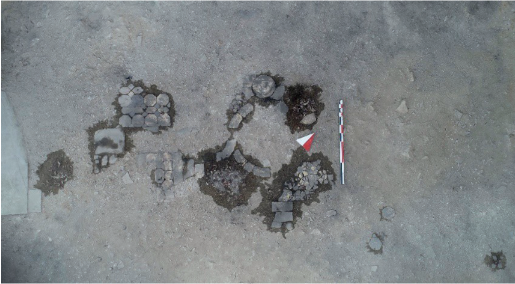
Görsel 8: Batı Kilisesi, opus sectile zemin detayı.