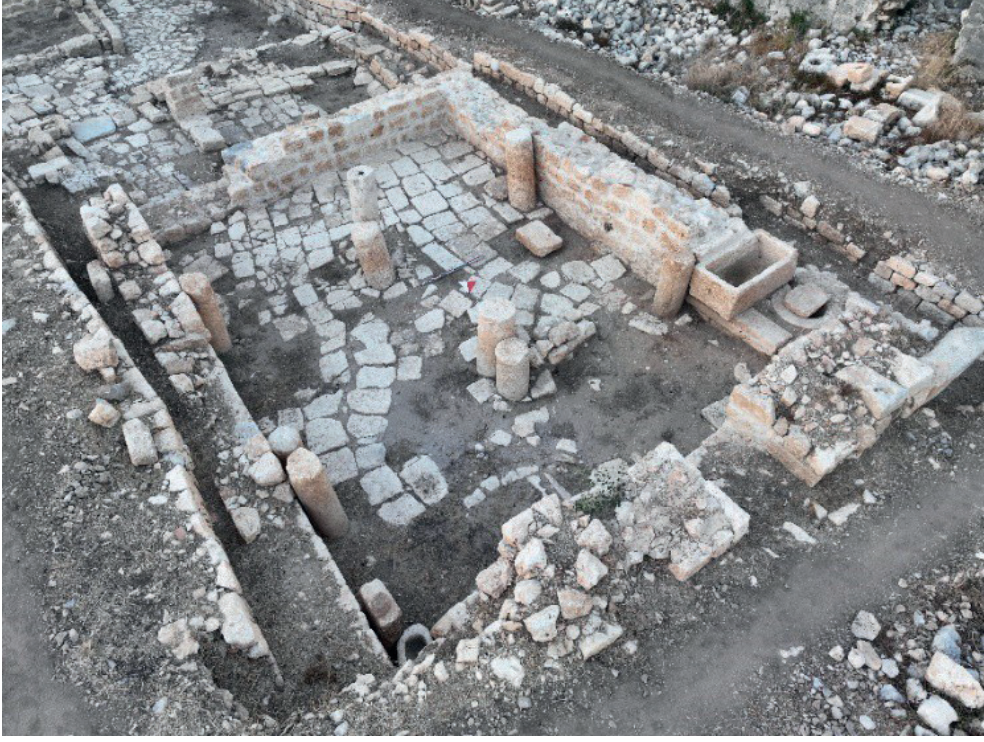
Görsel 9: B-3 Mekanı'nın kuzeydoğudan genel görünümü.