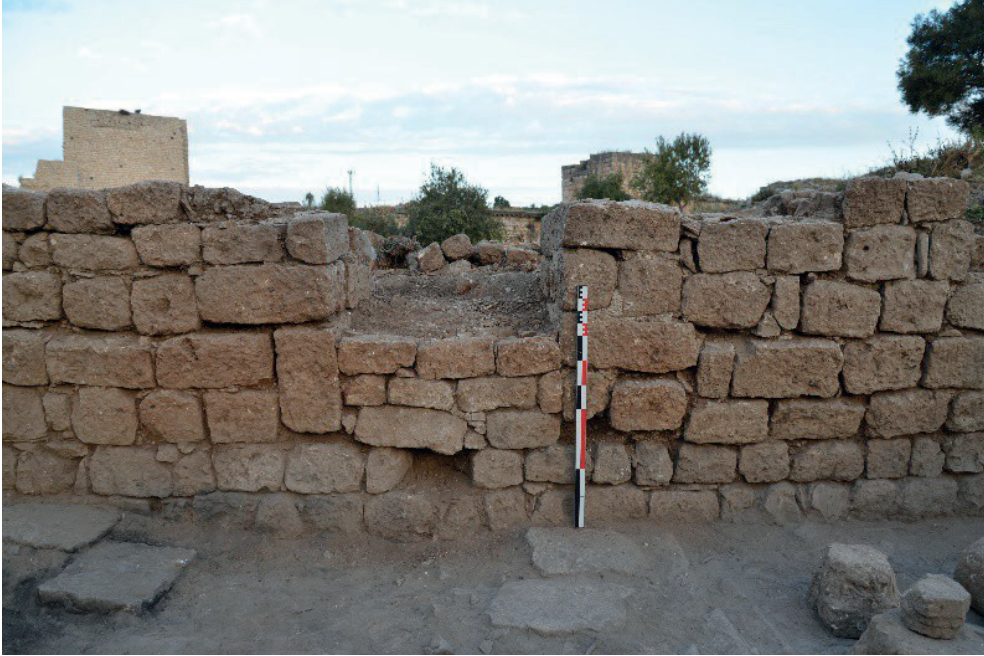
Görsel 10: B-3 Mekanı kuzey duvar detayı.