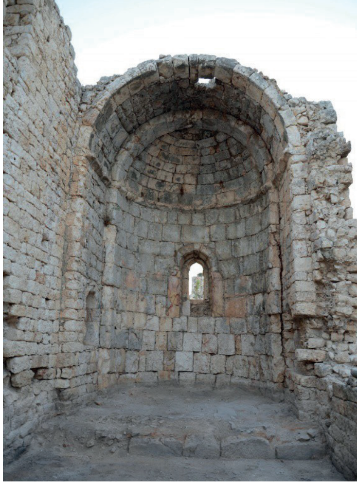
Görsel 6: Batı Kilisesi, apsis genel görünümü.