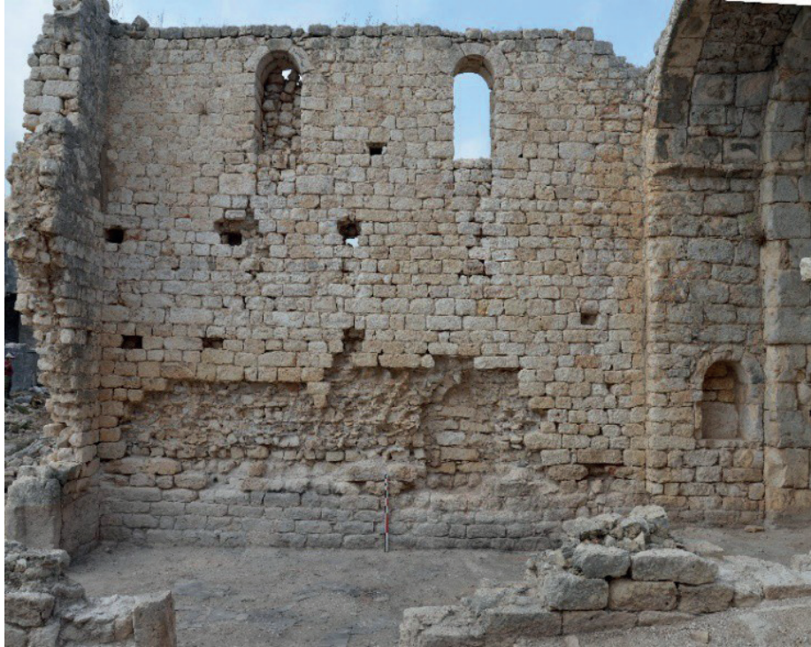
Görsel 3: Batı Kilisesi kuzey duvarın genel görünümü.