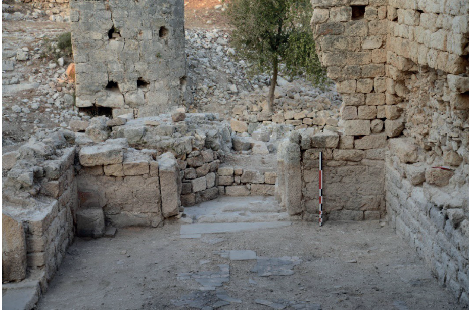
Görsel 4: Batı Kilisesi, batıdaki kapı açıklığının iç mekandan görünümü.