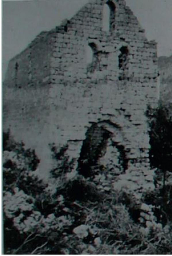
Görsel 12: Batı Kilisesi, kuzeybatıdan genel görünüm (Herzfeld-Guyer 1930: şek.190).