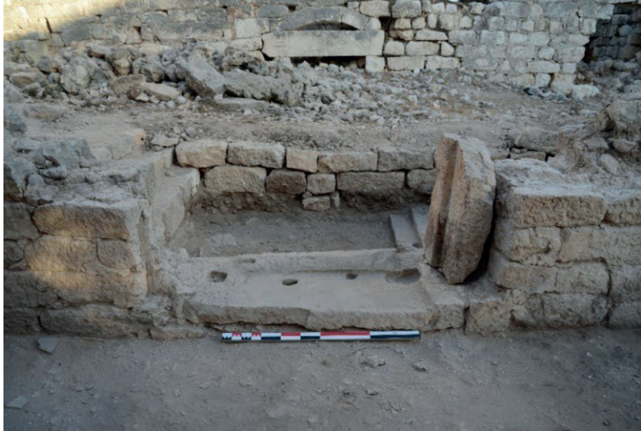
Görsel 5: Batı Kilisesi, güney duvar üzerinde yer alan kapı açıklığı.