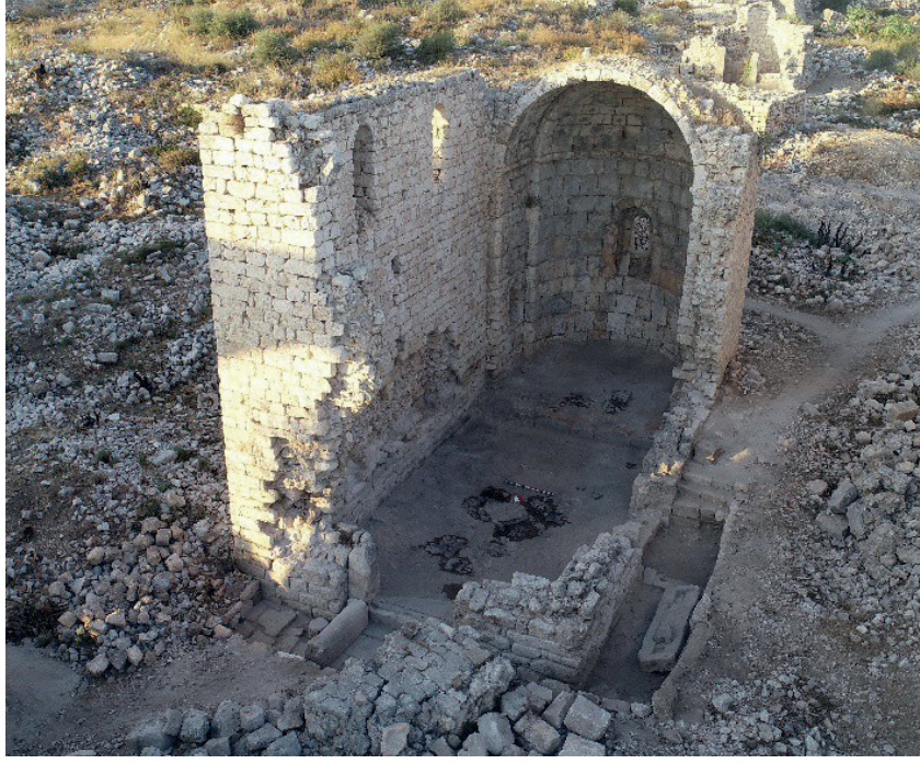
Görsel 2: Batı Kilisesi'nin genel görünümü.